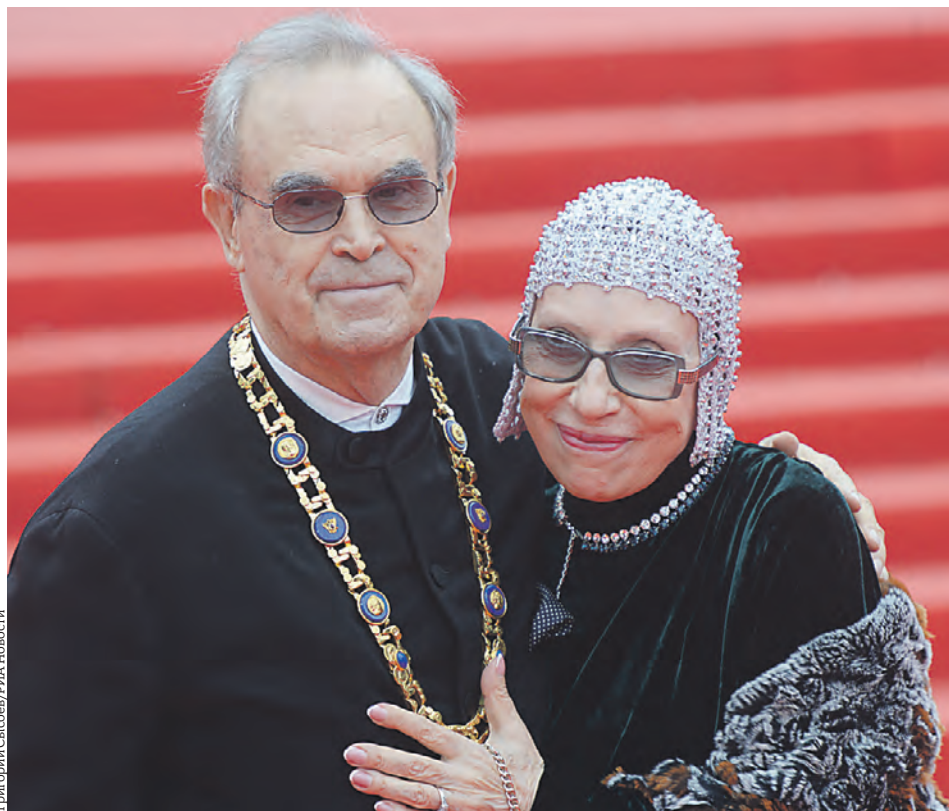
2014 год. Глеб Панфилов и актриса Инна Чурикова на церемонии закрытия 36-го Московского международного кинофестиваля

Инны Михайловны не стало в январе. Глеб Анатольевич пережил ее всего на семь месяцев. Тосковал, болел... Второй инсульт 89-летний режиссер перенести уже не смог, ведь его смысла жизни не было рядом... Чтобы понять, кем и чем была для Глеба Панфилова Инна Чурикова, нужно обязательно посмотреть фильм «Тема» (1986). Там мы видим совершенно неведомую Инну