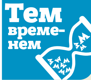
График движения поездов изменится на первом маршруте Московских центральных диаметров с 1 по 30 сентября, сообщили в столичном Дептрансе. Ограничения будут действовать с 19:00 до 6:00. Они необходимы для проведения работ по реконструкции станции Лианозово.