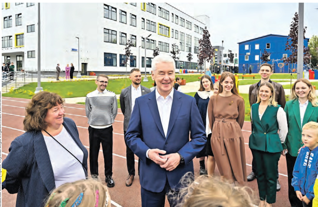
29 августа 2023 года. Мэр Москвы Сергей Собянин (в центре) поздравил учеников и учителей школы «Перспектива» с открытием нового учебного корпуса

■ Вчера мэр Москвы Сергей Собянин осмотрел новую школу, которую построили в Молжаниновском районе, а также выступил на городском педсовете.