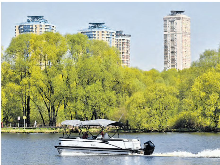
Серебряный Бор стал визитной карточкой района Хорошево-Мневники благодаря уникальному Бездонному озеру, расположенному на территории парка

В 2016 году здесь было открыто Московское центральное кольцо со станциями «Стрешнево», «Панфиловская», «Зорге» и «Хорошево».