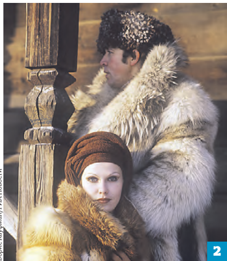
Борис Кауфман/РИА Новости

Одно время дизайнер вообще хотел уйти из профессии