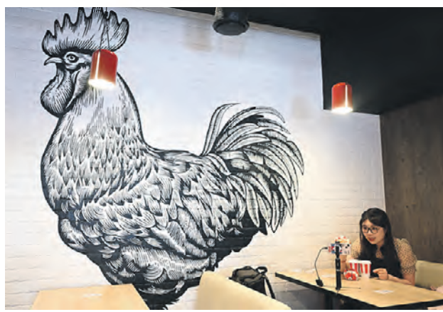
Посетительница в первом ресторане Rostic's, открывшемся на станции «Маяковская»