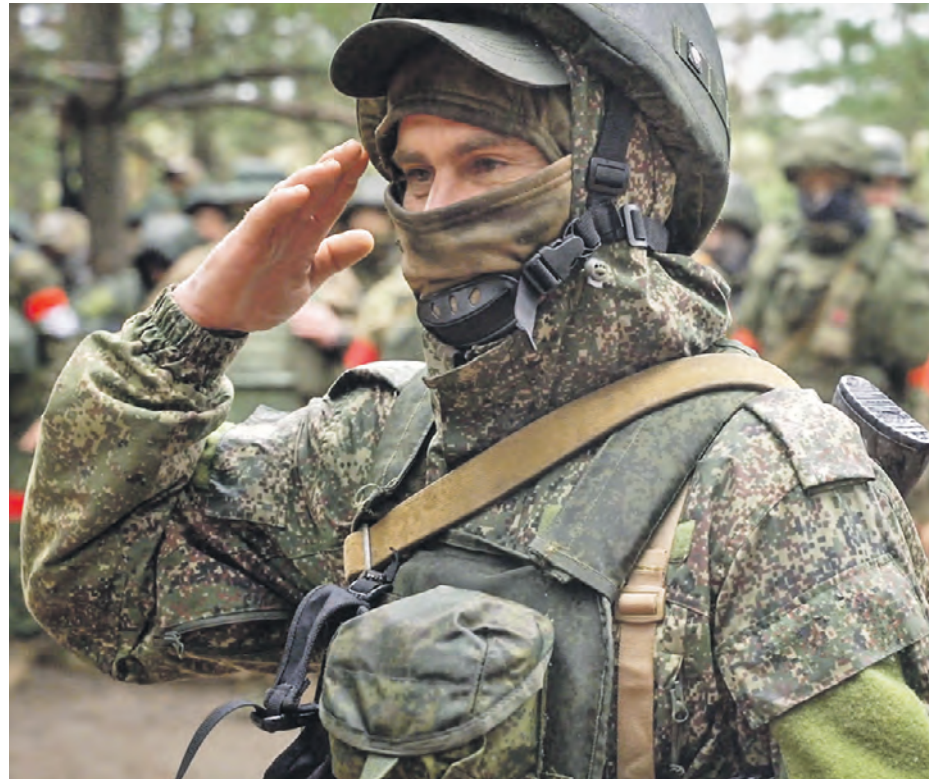
29 апреля 2023 года. Военнослужащий штурмового подразделения во время вручения награды за выполнение боевых задач в зоне спецоперации

Жены участников спецоперации поддерживают своих возлюбленных