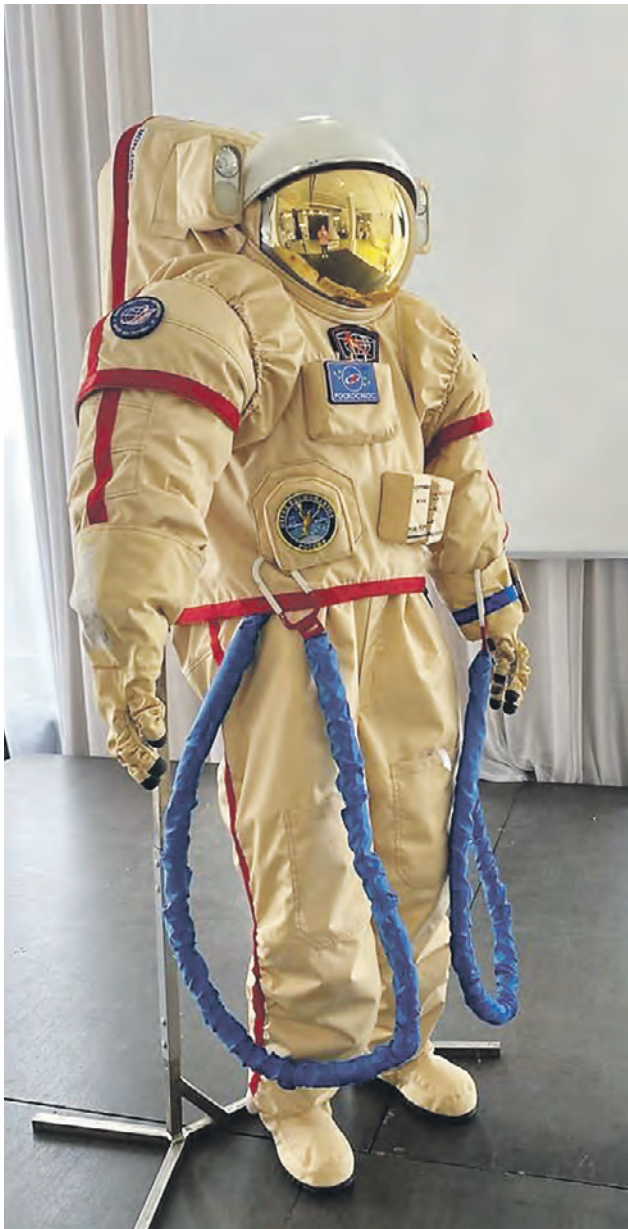
Копия скафандра «Орлан», которую внешне трудно отличить от настоящего, но в космос в таком не улетишь

Корреспонденты «Вечерки» в рубрике «Купи слона» продолжают собирать самые диковинные и оригинальные объявления, которые можно встретить на интернет-сайтах.