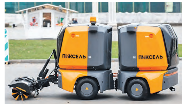
Робот «Пиксель» может делать влажную уборку и подметать тротуары в течение 16 часов