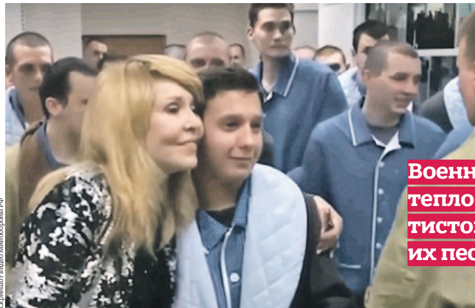
19 апреля 2022 года. Заслуженная артистка России Ольга Кормухина фотографируется с бойцом-участником спецоперации на Украине

Знаменитости выступают перед защитниками Донбасса