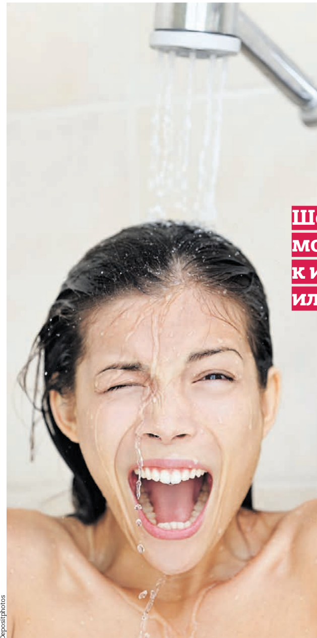
Не стоит принимать холодный душ без постепенной подготовки организма

Считается, что закаливание повышает сопротивляемость организма ребенка инфекциям. Дети легче переносят холод и жару, менее подвержены простудным и другим заболеваниям.