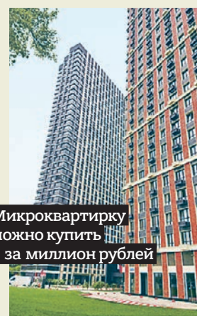
Микроквартирку можно купить и за миллион рублей

В столице начался бум на микрожилье — квартиры площадью до 12 квадратных метров. За ними светлое будущее, уверяют аналитики: горожане не хотят брать ипотеку, предпочитают жить в клетушке, но своей и за скромную цену. Что еще может предложить рынок недвижимости тем, кто не ищет простых путей с. 7