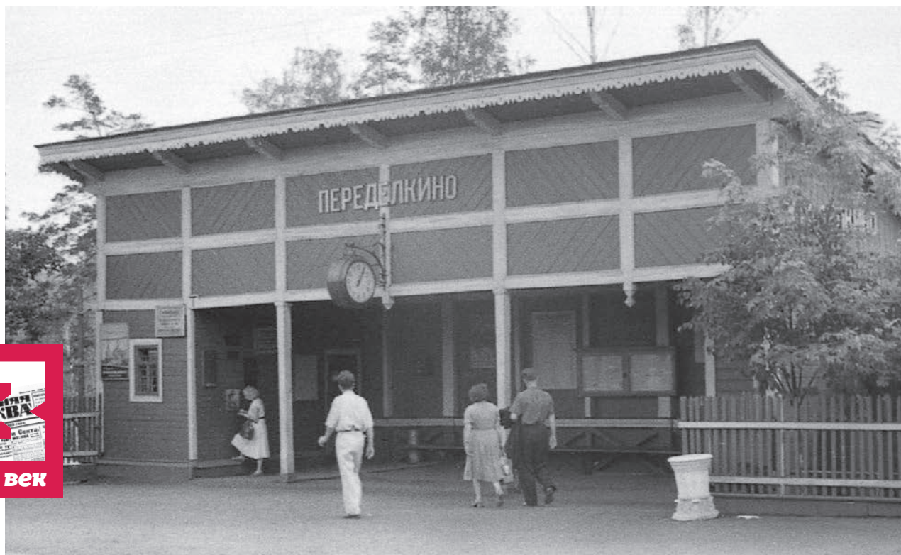
1957 год. Платформа подмосковной станции Переделкино, построенной в 1899 году и входящей в состав Киевского направления Московской железной дороги

Поехал. За билет до Внукова из Переделкино у меня взяли 51 копейку (в два раза дороже, чем от Москвы до Внукова). Из Внукова же до Переделкино у меня взяли за тот же путь только 34 копейки. Почему? Вопросы по следам его приключений действительно есть. Что за праздничный день мог быть 20 июня в 1926 году? Судя по всему, это был День Святой