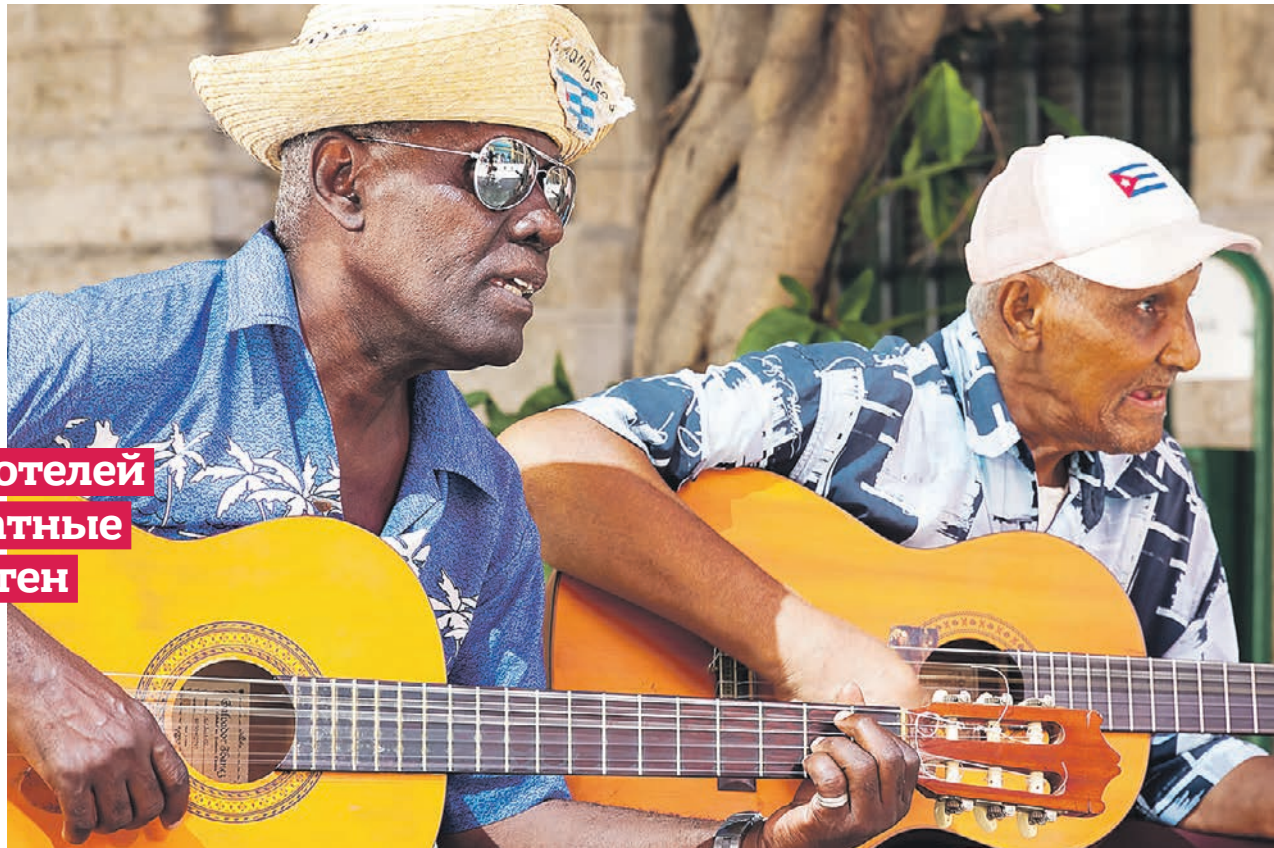
Уличные музыканты Старой Гаваны. Кубинская культура привлекает миллионы туристов

— Тех, кто привился «Спутником Лайт», в Москве немного: эта вакцина появилась недавно, — поясняет