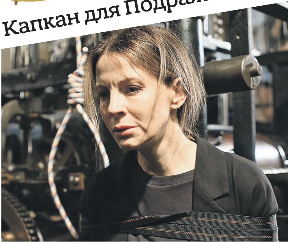
Кадр из сериала «Подражатель»: актриса Евгения Крюкова в роли преступницы Анастасии Перевезенцевой