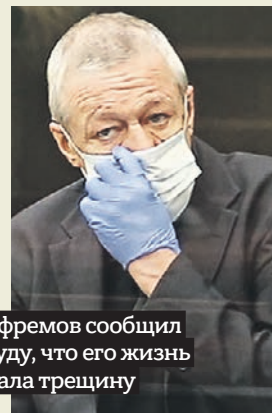
Ефремов сообщил суду, что его жизнь дала трещину

Вчера суд отказал в удовлетворении кассационных жалоб на приговор актеру Михаилу Ефремову, который получил 7,5 года колонии по делу о смертельном ДТП в центре Москвы. Несмотря на то что защита артиста настаивала на смягчении приговора, прокурор ответил: оснований для этого нет. Что теперь ждет актера? с. 11