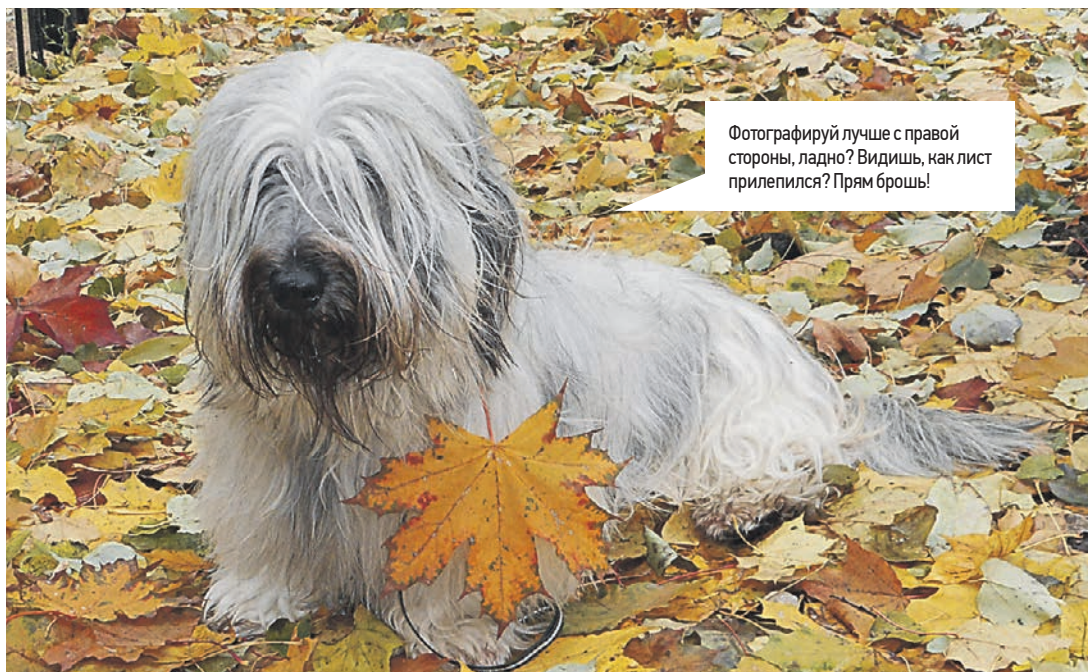
Фотографируй лучше с правой стороны, ладно? Видишь, как лист прилепился? Пряма брошь!

«Вечерка» продолжает акцию «Мой любимый питомец». Присылайте фотографии своих домашних животных на почту vecher@vm.ru . В письме не забудьте указать ваше имя, кличку питомца, а также составить небольшой рассказ о своем любимце, его привычках и о том, как вы проводите время вместе.