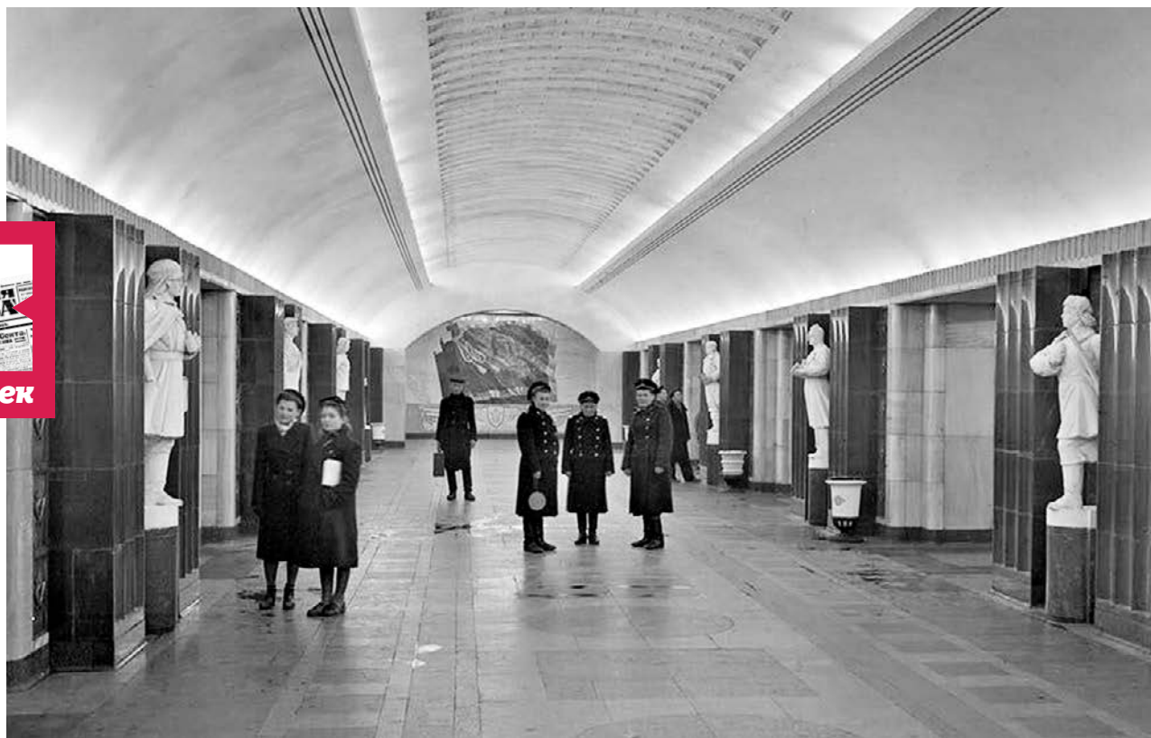
1947 год. Работники столичного метрополитена в центральном зале станции «Бауманская» (по первоначальному проекту она называлась «Спартакoвская»)

«Строительство линий метро третьей очереди осуществляется в основном на глубоком заложении 30–40 метров под поверхностью. Только конечные участки обоих радиусов и конечные станции сооружаются на глубине 9–12 метров. Трасса Замоскворецкого радиуса дважды пересекает Москву-реку и Водоотводный канал. Линия метро здесь пройдет в подводных тоннелях на глубине 20–22 метров под дном реки. Проходка будет