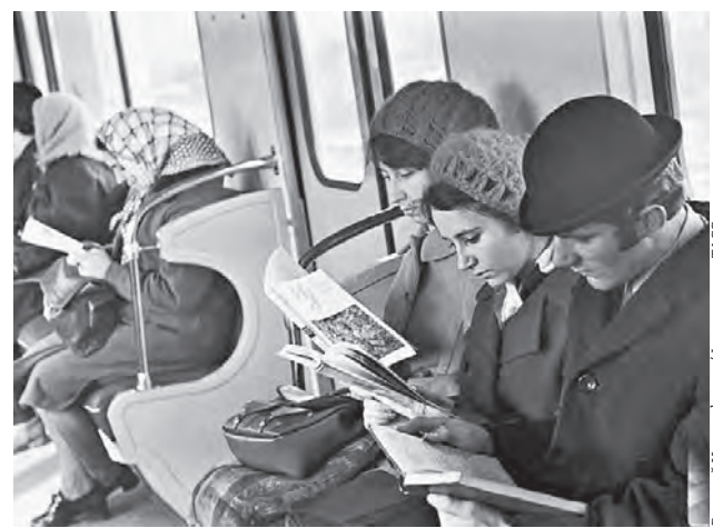
12 октября 1972 года. Пассажиры в вагоне столичного метро