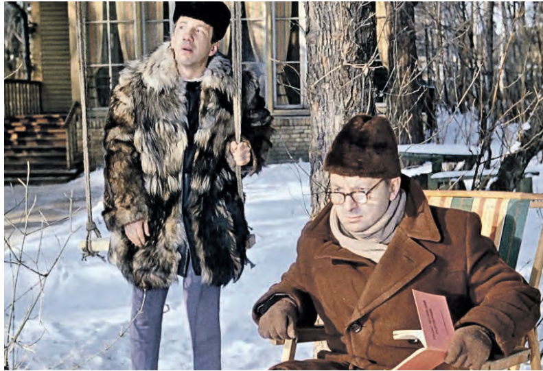
Кадр из фильма «Джентльмены удачи» (1971 год). Косой (Савелий Крамаров — слева) и Хмырь (Георгий Вицин) учат новые слова

■ Понять, что разговариваешь с приезжим, можно уже через несколько минут общения.