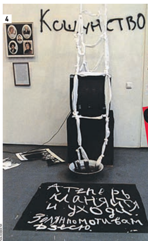
22 апреля 2012 года. Стояние в защиту веры у храма Христа Спасителя (1) 20 сентября 2012 года. Православный активист в центре Москвы (2) 12 октября 2012 года. Митинг против мракобесия на Пушкинской площади (3) 17 января 2014 года. Выставка «Осторожно, религия!» (4) 6 июня 2013 года. Митинг в защиту церкви на Суворовской площади (5) Карикатуры в «Шарли» (6-7)