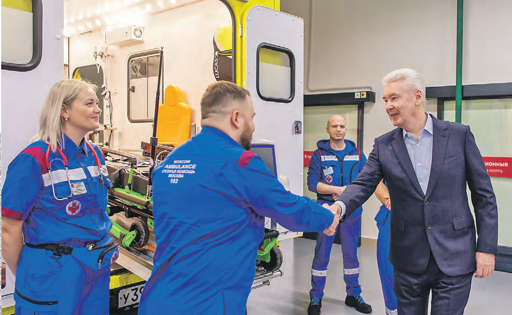
17 января 2023 года. Мэр Москвы Сергей Собянин (справа) во время открытия нового флагманского центра НИИ скорой помощи имени Склифосовского. За последние годы столичное правительство серьезно модернизировало систему оказания медицинской помощи, в том числе экстренной

— Медицинские работники должны соответствовать максимально высоким требованиям профессиональной компетенции, — отметил глава города. Важная составляющая — оснащение клиник современным оборудованием, а также применение современных стандартов организации медицинской помощи. Помимо этого, уточнил мэр, внедряются цифровые решения, в част-