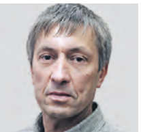
ЮРИ КОЗЛОВ ПИСАТЕЛЬ

Накануне отмечали Всемирный день книги и авторского права. Он был учрежден в 1995 году в память о двух великих писателях Уильяме Шекспире и Мигеле Сервантесе, ушедших из жизни 23 апреля 1616 года в разных концах Европы. Всемирный день книги празднуется читателями, издателями, такими пропагандирующими национальную литературу организациями, как Институт Гете в Германии, Сервантеса в Испании, Камонса в Португалии, Российский книжный союз в России. Посетителям, пришедшим в этот день в магазины, дарят цветы и сувениры, делают скидки на книги. Споры о будущем бумажной книги ведутся давно. Последние исследования относят время окончательного прощания с ней на 2030–2040 годы. Не факт, что подобные прогнозы сбываются. Сегодня отмечается возвращение читателей к классической бумажной книге. Куда менее праздничной представляется ситуация с авторским правом.