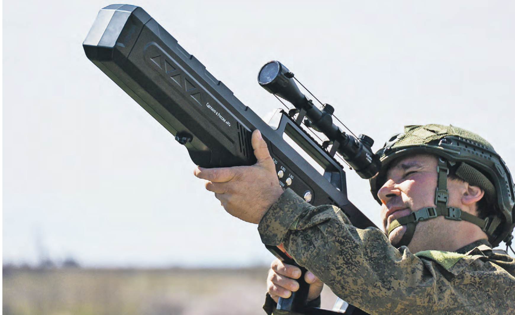
4 апреля. Военнослужащий 97-го мотострелкового полка группировки войск «Днепр» с противодронным ружьем во время боевой работы на линии боевого соприкосновения вдоль берега реки Днепр в Запорожской области

Глава военного ведомства отметил, что высокий боевой потенциал российских подразделений позволяет постоянно оказывать огневое воздействие на противника и не давать ему удерживать линию обороны. — Вашингтон для недопущения краха Вооруженных сил Украины намерен выделить почти 61 миллиард долларов киевскому режиму, — дополнил Шойгу. — Большая часть ассигнований уйдет на финан-