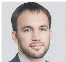
АЛЕКСЕЙ ВОЛКОВ ПРЕЗИДЕНТ ОБЩЕРОССИЙСКОГО СОЮЗА ИНДУСТРИИ ГОСТЕПРИИМСТВА