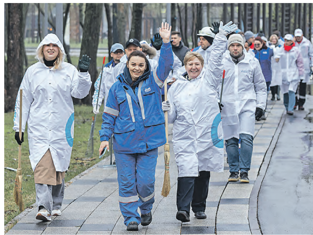
19 апреля. Прошедший субботник превратился для волонтеров Московского нефтеперерабатывающего завода в настоящий праздник

зуют технику, чтобы помыть не только фундамент памятников, но и сами памятники. Их тщательно намыливают: активно трут щетками и используют кисточки, чтобы добраться до самых труднодоступных мест и очистить мелкие детали. После этого сооружение оставляют на 10–15 минут, чтобы раствор, который используют при уборке, развел утрамбованную пыль и грязь. А потом памятник «купают», тщательно смывая с него всю пену. В среднем на один памятник уходит около двух часов. В общей сложности в работах по благоустройству столицы принимают участие почти 500 тысяч сотрудников разных городских служб. Помогают им в уборке более 14 тысяч единиц коммунальной техники. О своем городе заботятся и простые москвичи. Чтобы дать им возможность поучаствовать в благоустройстве столицы, власти города организовали два субботника, которые прошли 13 и 20 апреля. Неравнодушным горожанам выдавали весь необходимый инвентарь: мусорные пакеты, грабли, метлы и перчатки. Поскольку проведение городских субботников в столице — это ежегодное мероприятие, в парках и скверах разных районов в них охотно участвовали местные жители,