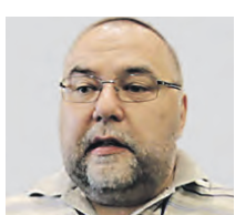
ОЛЕГ НОВОСЕЛОВ ЭТОЛОГ, ПИСАТЕЛЬ

Аудиопродукция — полезная вещь. Это скажет любой, кто пользуется подобными сервисами, и я в том числе. Я сам часто слушаю аудиокниги, потому что это сильно экономит время и дает возможность заниматься своими делами, а не сидеть перед экраном или печатным текстом. Что касается увеличения числа пользователей, то, на мой взгляд, люди просто привыкли к этому феномену. То есть до этого не привыкли отдавать деньги за подписки на подобные сервисы россияне относились к ним с недоверием и пользовались бесплатными. Сегодня же к аудиокнигам мы привыкли, а потому готовы пользоваться платформами в полном объеме. На повышение спроса повлияло и увеличение ассортимента. Сегодня мы можем послушать книгу, записанную человеком или искусственным интеллектом.