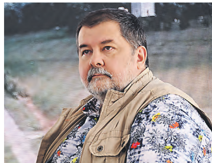
5 июня 2023 года. Писатель Сергей Лукьяненко принимает участие в творческой встрече на IX книжном фестивале «Красная площадь»

Сегодня российский писатель-фантаст Сергей Лукьяненко (на фото) отмечает свой 56-й день рождения. В разговоре с «ВМ» он вспомнил свою первую книгу.