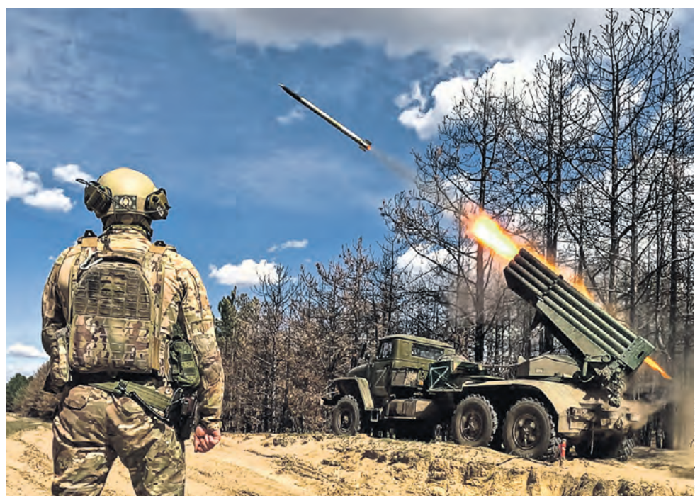
9 апреля. Боевая работа самоходной реактивной системы залпового огня (РСЗО) «Град» реактивного дивизиона «Лотос» группировки войск «Днепр» в зоне проведения специальной военной операции в Херсонской области. Там за минувшие сутки бойцы ВС РФ нанесли удары в районе Работина, Михайловки и Ивановки. Потери противника составили до 65 человек. Также ВСУ лишились орудия и техники, уточнили в Минобороны России.