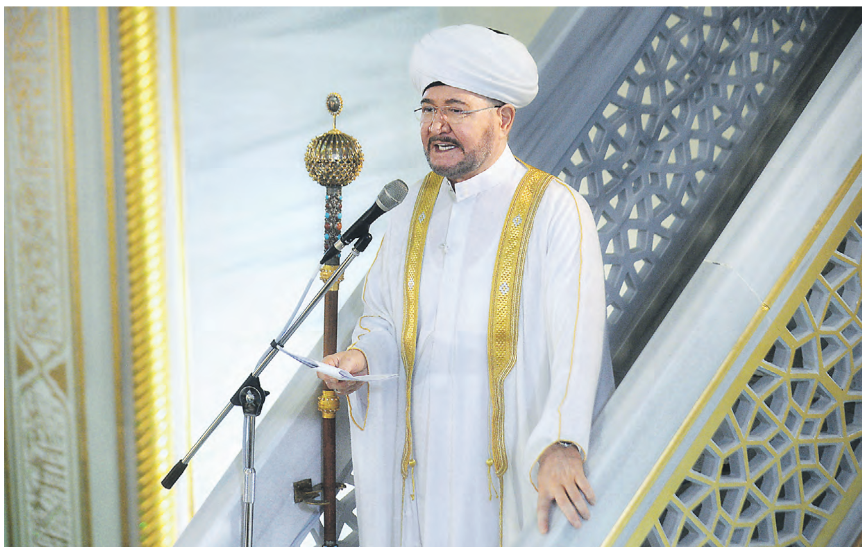
10 апреля. Председатель Духовного управления мусульман РФ и Совета муфтиев России, муфтий шейх Равиль Гайнутдин выступает с праздничной проповедью в честь Ураза-байрама в Московской Соборной мечети.

— Сегодня у нас хорошее настроение. Благополучно завершился для нас месяц Рамадан: мы постились и очистились, — рассказал «ВМ» Джунусалиев.