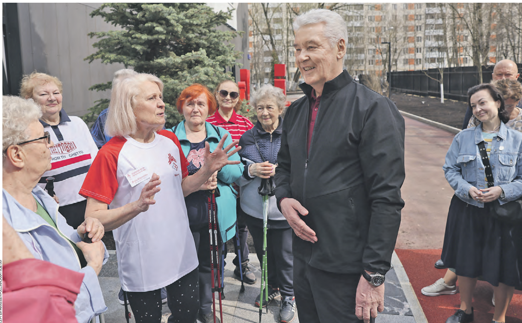
10 апреля. Мэр Москвы Сергей Собянин (в центре) на открытии спортивного комплекса «Скиф» в районе Гольяново общается с местными жителями и участниками проекта «Московское долголетие», которые тоже будут заниматься спортом в новом здании