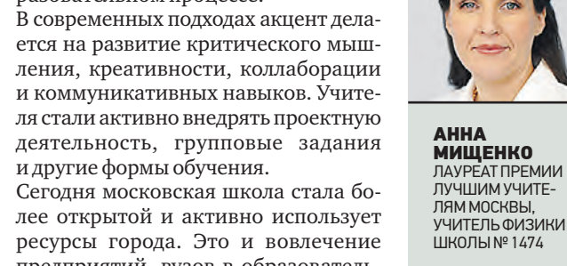
АННА МИЩЕНКО ЛАУРЕАТ ПРЕМИИ ЛУЧШИМ УЧИТЕЛЕМ МОСКВЫ, УЧИТЕЛЬ ФИЗИКИ ШКОЛЫ № 1474