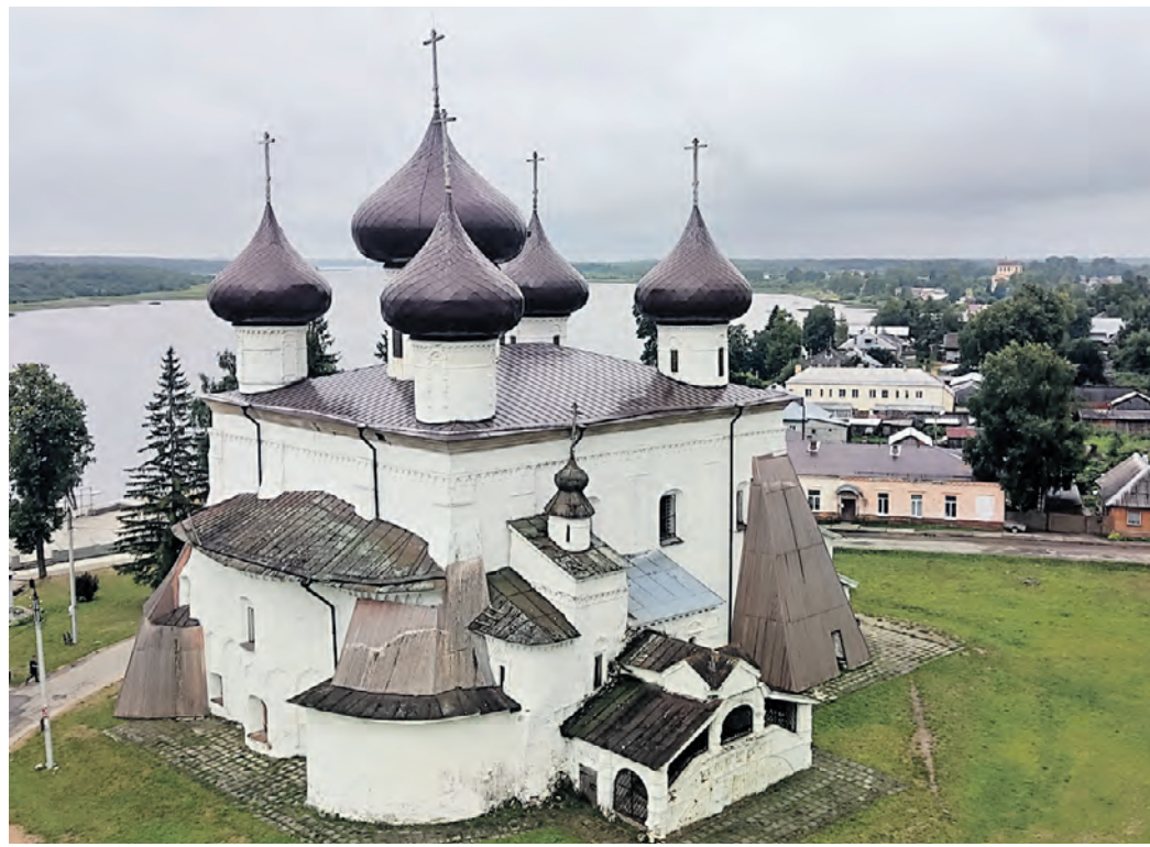
4 августа. Белокаменный собор Рождества Христова в Каргополе.

— Согласно легенде праздника, «Баранье воскресенье» всегда отмечалось в первое воскресенье после Ильина дня, в период между завершением сенокоса и началом уборочной кампании. В прошлом это был единственный летний праздник, когда все жители Каргополя собирались за большим общим столом. Старосты ключевых церковных приходоов собирали средства, на которые приобретали барашков для приготовления великопостного угощения для всех. Разумеется, праздник начинался с церковной службы и освещения скота. В былые времена это торжество проходило с настоящим купеческим размахом. Баран, жарившийся на костре, отражен на гербе Каргополя, созданном в конце XVIII века, — дополнила Парфенова. Множество городов Русского Севера, таких как Няндомы и Каргополь, сегодня остаются незаслуженно забытыми, хотя каждый из них обладает уникальным шармом и богатым историческим наследием. Эти места, укрытые в объятиях лесов и рек, хранят в своих стенах тайны прошлого, которые ждут своего открытия. Няндомы, с ее старинными деревянными домами и атмосферой древности, предлагает путешественникам возможность увидеть, как развивалась жизнь на Севере. Каргополь, с его величественными церквями и монастырями, приглашает к размышлениям о времени и вере.