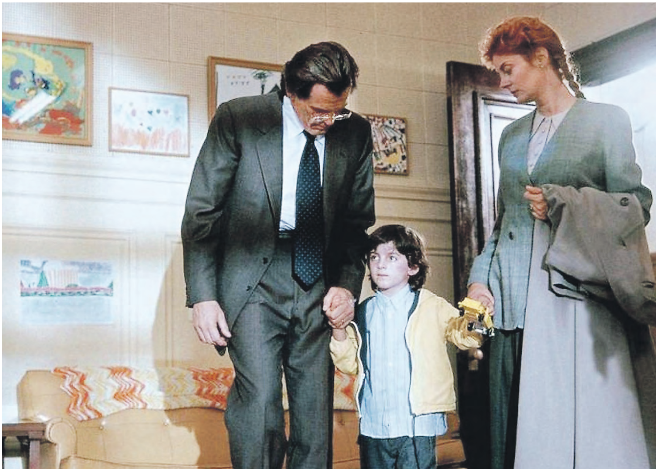
Кадр из фильма «Масло Лоренцо»: родители Аугусто (Ник Нолти) и Микаэла (Сьюзан Сарандон) Одоне изобрели для сына Лоренцо (Зак О'Мэлли Гринберг) лекарство от редкого генетического заболевания

Если мы говорим о развитии таланта, то важно совпадение двух факторов: врожденной склонности и окружающей среды. Когда будущая мать думает о качествах, которые она хотела бы видеть в своем ребенке, то надо оценивать два аспекта. С одной стороны, надо думать о наследственности. Чисто гипотетически предположим, что она хочет, например, чтобы дети были талантливыми музыкантами. Тогда надо найти мужа, у которого в поколениях прослеживаются эти способности. Мы точно знаем, что наследуются абсолютный слух. Но чтобы стать великим композитором, нужно еще иметь музыкальную память, артистизм и так далее. То есть уже совокупность генетических факторов, а не один признак. С другой стороны, если человек с геномом (совокупность генов. — ВМ ) Моцарта ро-