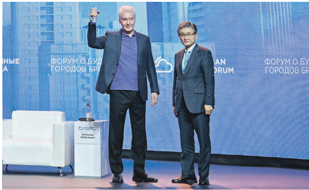
19 сентября. Лауреат Нобелевской премии мира Рае Квон Чунг (справа) вручил мэру Москвы Сергею Собянину Всемирную премию в номинации «Устойчивые города и сообщества»

В этом году в городе приведут в порядок более 2,5 тысячи