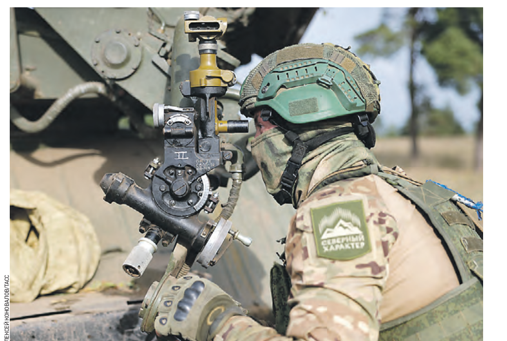
17 сентября. Военнослужащий расчета реактивной системы залпового огня «Град» 80-й отдельной мотострелковой бригады выполняет боевые задачи в Херсонской области, в зоне проведения специальной военной операции. «Грады» работают по скоплениям сил вооруженных украинских формирований. Расчеты ВС РФ успешно уничтожают позиции с живой силой противника, боевую технику и вражеские склады.