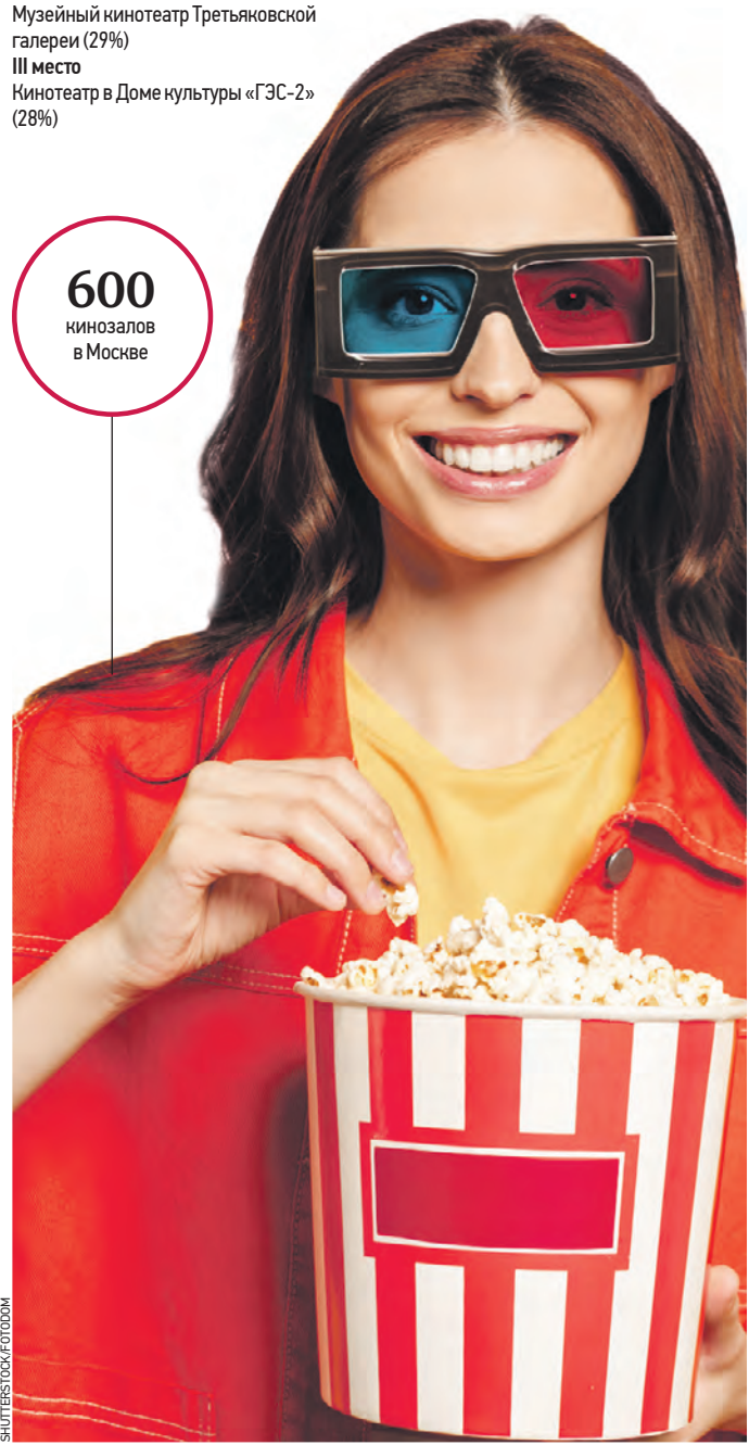
По данным ag.mos.ru

Главная городская газета перешагнула столетний юбилей, и мы продолжаем рассказывать об истории «Вечерней Москвы». Предлагаем цикл публикаций, в которых на основе материалов разных лет пробуем выяснить, как сильно со временем изменились заботы столичного правительства, какие проблемы волновали депутатов несколько десятилетий назад и какие вопросы решают народные избранники сейчас.