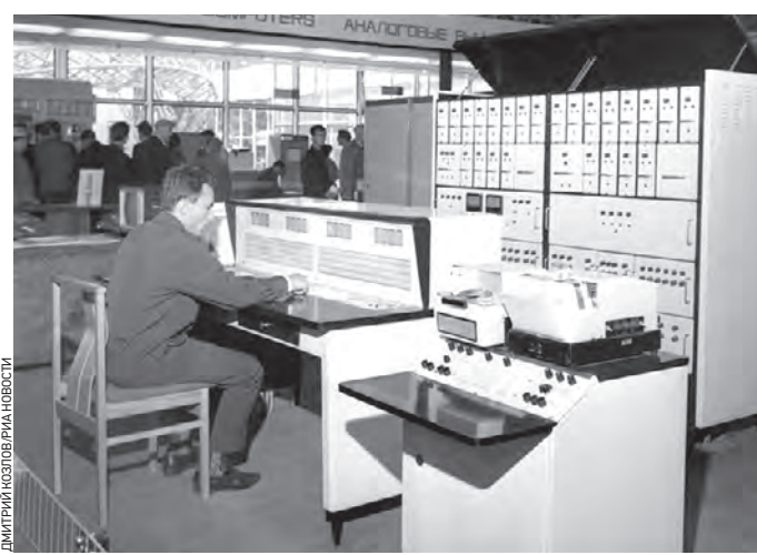
Советский павильон выставки «Интерортехника-66» в выставочном центре «Сокольники». Фото 1966 года

Город готовится к холодам заранее. Например, специалисты Комплекса городского хозяйства уже к началу сентября подготовили все различные учреждения образо-