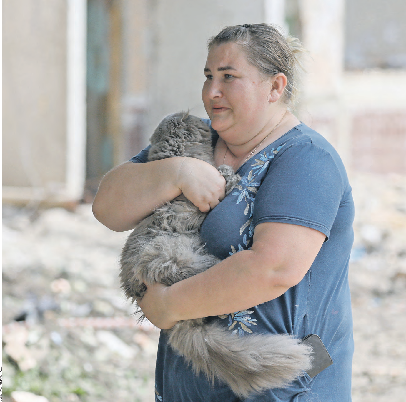
15 июня. Жительница Шебекино с котом возле дома, в котором обрушился подъезд из-за удара со стороны ВСУ

— К сожалению, варварские обстрелы со стороны аморальных негодяев, которые находятся в военно-политическом руководстве Украины, приводят к жертвам среди мирных граждан. Желая скорейшего выздоровления всем пострадавшим и выражая глубокое сожаление семьям погибших, — проком-