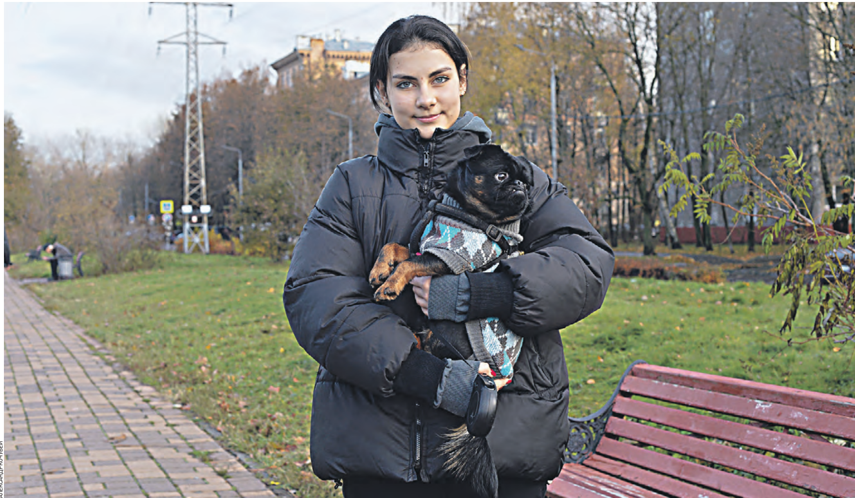
31 октября. Жительница района Южное Тушино со своим питомцем Арахисом во время прогулки по обновленному променаду. Девушке особенно понравилось, что теперь здесь можно не только отдыхать с друзьями и гулять с собакой, но и заниматься с Арахисом на новой площадке для выгула