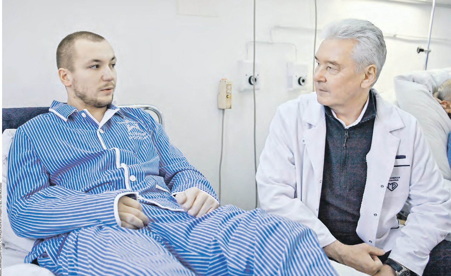
31 октября. Мэр Москвы Сергей Собянин (справа) общается с участником специальной военной операции, который проходит лечение в Центре амбулаторной медицинской помощи на базе Госпиталя для ветеранов войн № 3