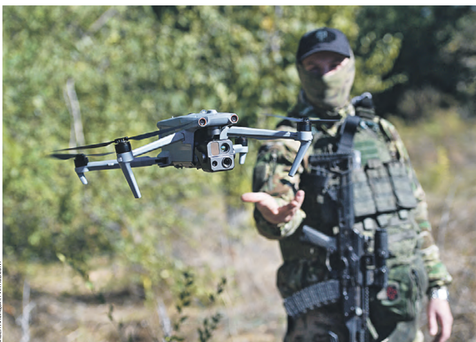
16 октября. Военнослужащий ВС РФ во время корректировки огня танковых подразделений с помощью БПЛА в Запорожской области. В Минобороны РФ сообщили, что за минувшие сутки на запорожском направлении подразделениями российской группировки войск, ударами авиации и огнем артиллерии были отражены атаки врага. Потери противника, по данным МО РФ, составили до 55 военнослужащих, также уничтожены две боевые бронированные машины и два пикапа.