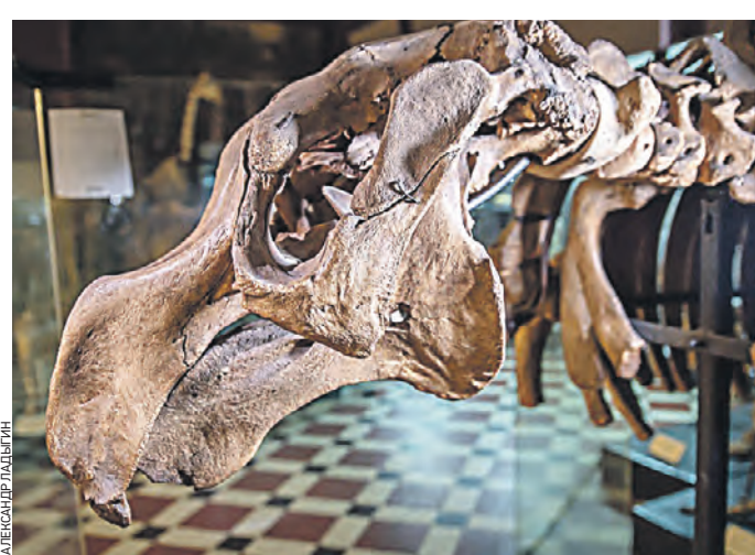
Фрагменты скелета морской коровы в экспозиции Зоологического музея МГУ им. М. В. Ломоносова