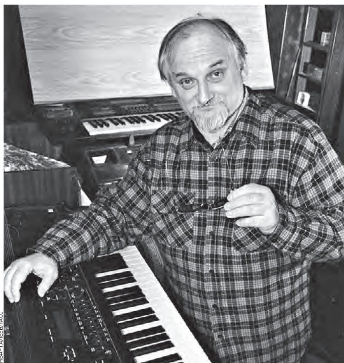
Композитор Геннадий Гладков за работой. Фотография была сделана в 2000 году в Москве