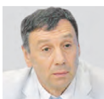
СЕРГЕЙ МАРКОВ ПОЛИТОЛОГ

Сейчас мы находимся в серьезном цивилизационном конфликте, поэтому в целях выживания нам необходимо создавать суверенную экономику, а значит, вводить меры государственного протекционизма. Именно поэтому я могу поддержать эту инициативу. Если западный бизнес финансирует наших противников, но не хочет работать на российском рынке, то пусть хотя бы заплатят за свою недружественную позицию. Хотя я им вообще запретил бы возвращаться. Потому что у нас и без них достаточно возможностей для развития экономики. В любом случае, все западные компании могут заменить организации из тех государств, которые нас поддерживают.