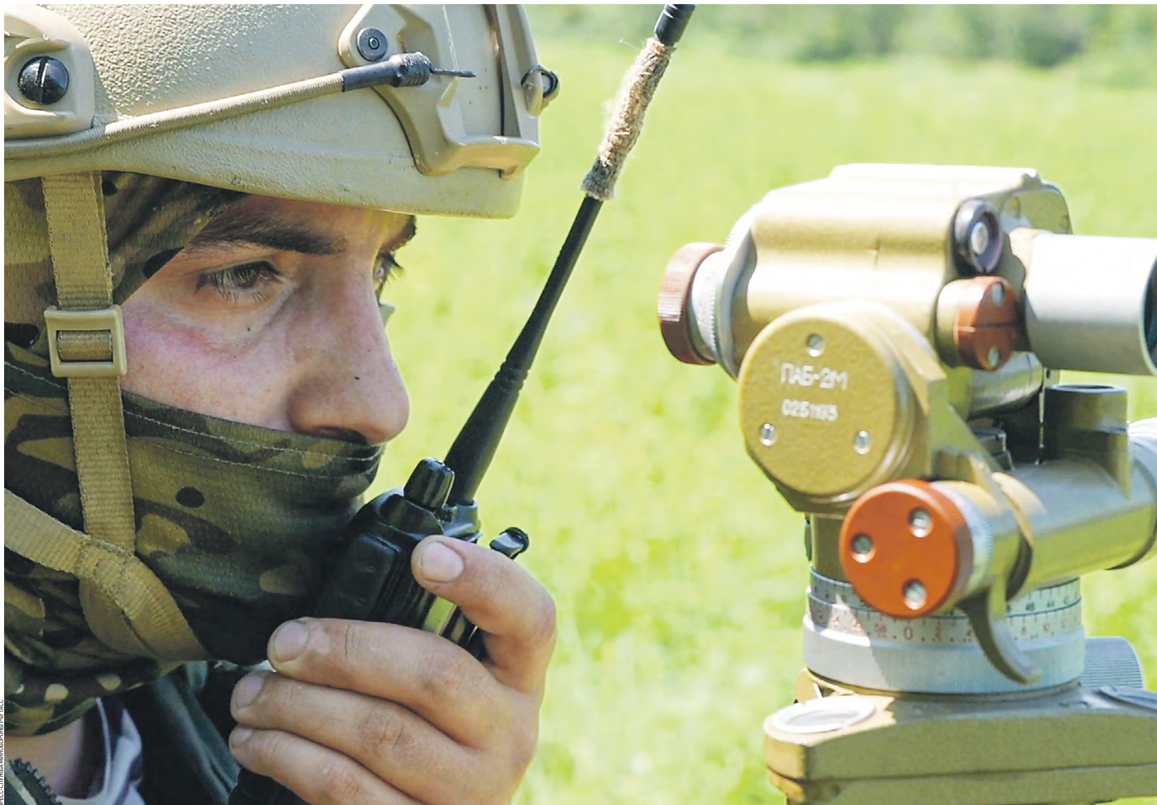
19 августа 2023 года. Военнослужащий расчета реактивной системы залпового огня «Град» во время боевой работы в зоне проведения специальной военной операции на Купянском направлении

Фронт в Харьковской области может «посыпаться» до наступления холодов