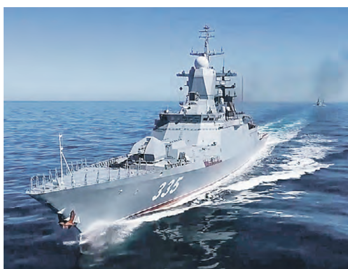
5 июня 2023 года. Корвет «Громкий» Тихоокеанского флота ВМФ РФ на многонациональных учениях «Комодо-2023»

Сегодня военные угрозы России — это не только фронты на Донбассе и востоке Украины. Обращаясь 21 июня в Кремле к выпускникам высших военных учебных заведений, министр обороны России генерал армии Сергей Шойгу сказал, что «самую настоящую войну» развернул против нашей страны коллективный Запад. Поэтому помимо укрепления сухопутных сил России жизненно необходимо наращивать силы и своего военного флота — «длинной руки державы», способной нанести удар по любому противнику в любой точке Мирового океана.