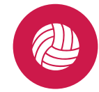
кеды и ботсы

Свои навыки я отрабатываю каждый день, утром и вечером. Нелегко совмещать учебу и спорт, но, к счастью, мне удалось найти баланс. Между тренировками мне нужно