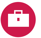
есть такая работа