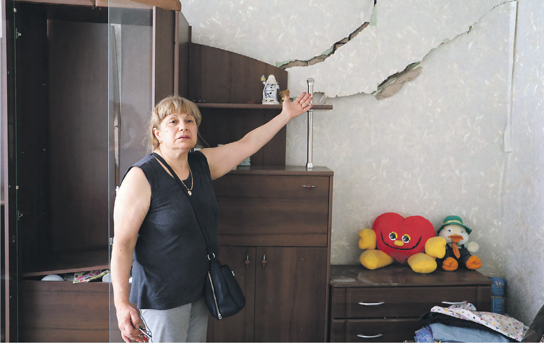
Вчера 12:16 Жительница Макеевки в квартире жилого дома демонстрирует последствия обстрела города со стороны ВСУ

По словам официального представителя Минобороны России генерал-лейтенанта Игоря Конашенкова, за прошедшие сутки враг потерял на Краснолиманском направлении большое количество живой силы и техники. — За сутки потери противника на данном направлении составили свыше 90 украинских военнослужащих, один танк, три боевые бронированные машины, три пикапа, самоходная артиллерийская установка Krag польского производства, самоходная гаубица «Акация» и две гаубицы Д-30, — рассказал Конашенков. — Помимо этого, на Донецком направлении грамотными и мужественными действиями обороняющихся подразделений «Южной» группировки войск за сутки успешно отражены девять атак противника в районах населенных пунктов Белогорка, Первомайское, Северное, Невельское и Красногорка Донецкой Народной Республики. Конашенков также отметил, что российские войска продолжают уничтожать противника и на других участках фронта. — На Херсонском направлении в результате огневого по-