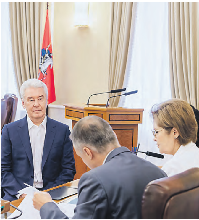
Вчера 11:03 Сергей Собянин представляет подписи депутатов в свою поддержку в Мосгоризбирком