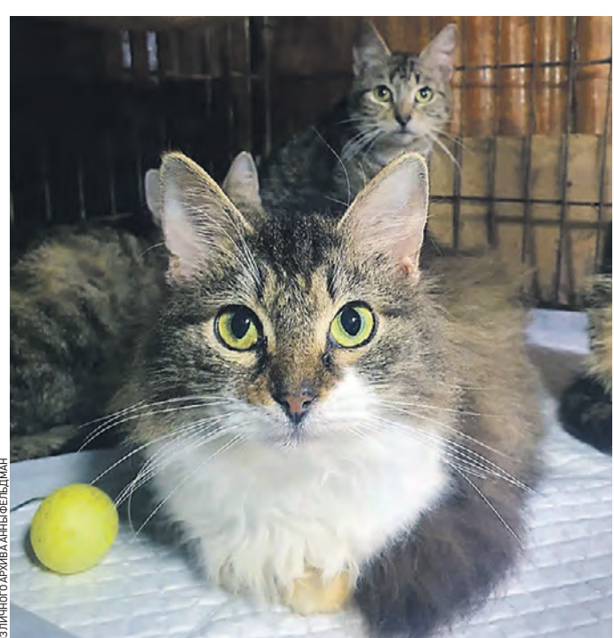
Июнь 2023 года. Кошечка Эсмеральда, спасенная из квартиры на улице Егора Абакумова, с любимой игрушкой