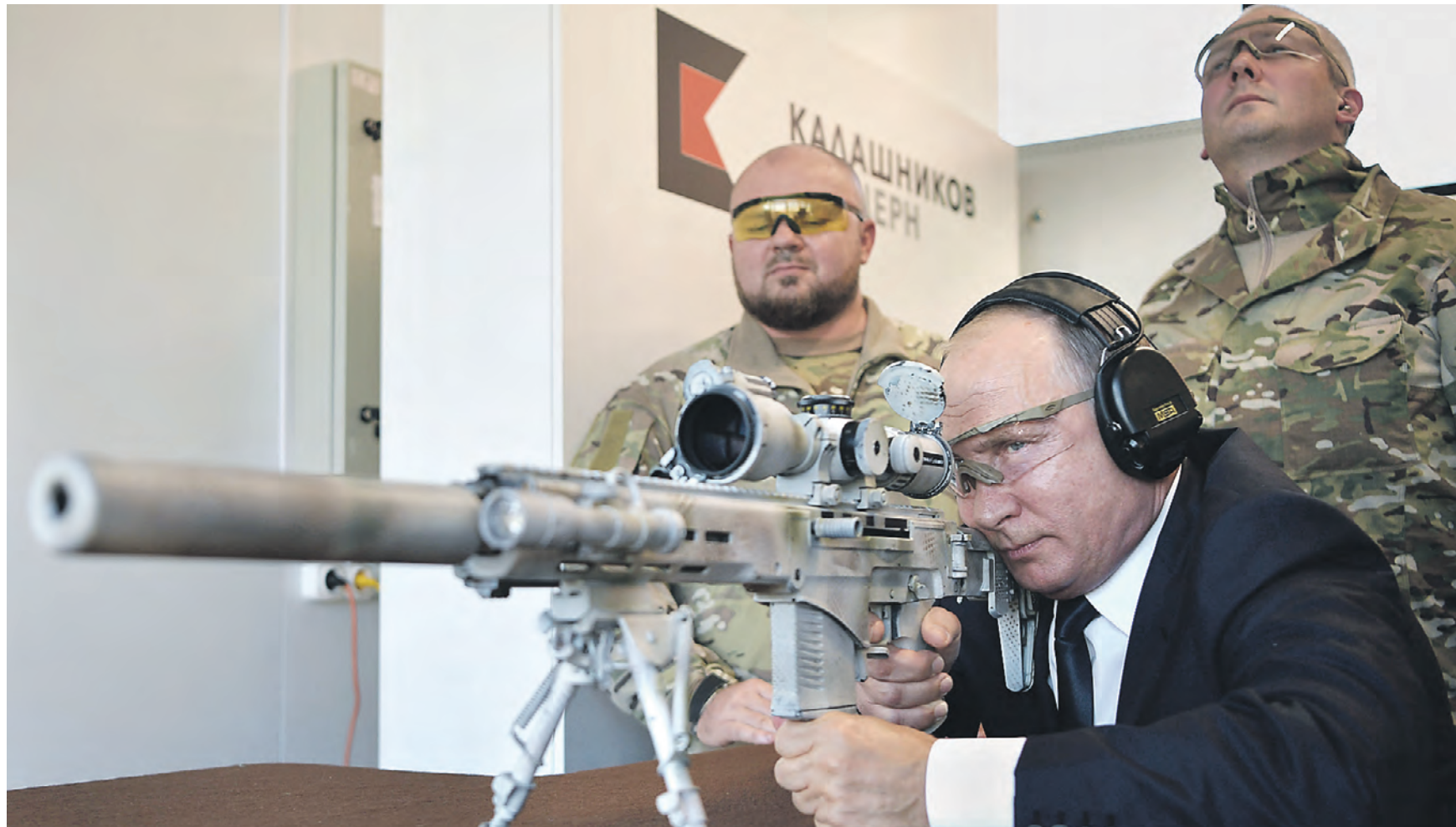
19 сентября 2018 года. Президент РФ Владимир Путин стреляет из снайперской винтовки Чукавина (СВЧ-308) во время посещения стрелкового центра АО «Концерн «Калашников» на территории военно-патриотического парка «Патриот»

Легна на подъем СВЧ спроектирована по «гардинной» схеме. «Гардина» — это длинная полоса толщиной около 10 мм, внутри которой проходит направляющая. Работает эта схема так: основные элементы винтовки крепятся к верхней шине. Поскольку на нее приходится ос-