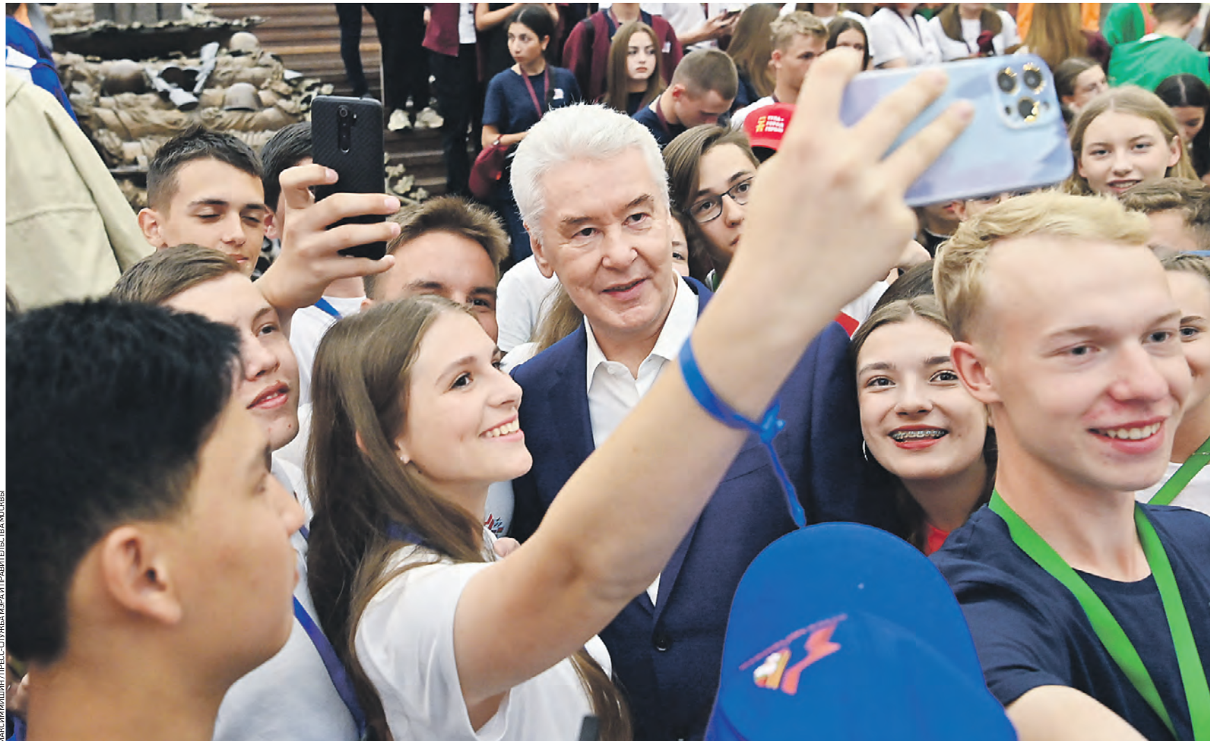
Вчера 10:54 Мэр Москвы Сергей Собянин (в центре) в Музее Победы фотографируется с участниками проекта «Поезд Памяти» — ребята из разных городов России, Белоруссии, Армении и Киргизии путешествуют по местам боевой славы времен Великой Отечественной войны

Москва — конечная точка маршрута. Здесь ребята возложат цветы к Вечному огню в Александровском саду, побывают на экскурсиях и погуляют по столице, — сообщил глава города.