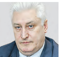
ИГОРЬ КОРОТЧЕНКО ГЛАВНЫЙ РЕДАКТОР ЖУРНАЛА «НАЦИОНАЛЬНАЯ ОБОРОНА»

ломным, как стала, например, Сталинградская битва. После нее, напомню, исход Великой Отечественной войны был, по сути, предрешен. Дело в том, что донецкая группировка ВСУ включает в себя наиболее укомплектованные, боеготовые, идейно мотивированные части украинской армии. И после того, как с ними будет покончено, откроются дальнейшие стратегические возможности для наступления вперед по целому ряду других направлений. После уничтожения донецкой группировки мы будем жить уже в другой реальности. Высвободившиеся Вооруженные силы России, подразделения ДНР и ЛНР можно сосредоточить и сконцентрировать на других приоритетных направлениях: спецоперация перейдет в свою третью фазу.