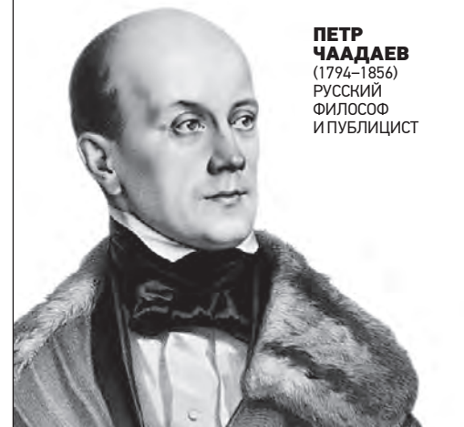
ПЕТР ЧААДАЕВ (1794–1856) РУССКИЙ ФИЛОСОФ И ПУБЛИЦИСТ

На учебное дело в России может быть установлен совершенно особый взгляд, ему возможно дать национальную основу, в корне расходящуюся с той, на которой оно зиждется в остальной Европе, ибо Россия развивалась во всех отношениях иначе, и ей выпало на долю особое предназначение в этом мире.