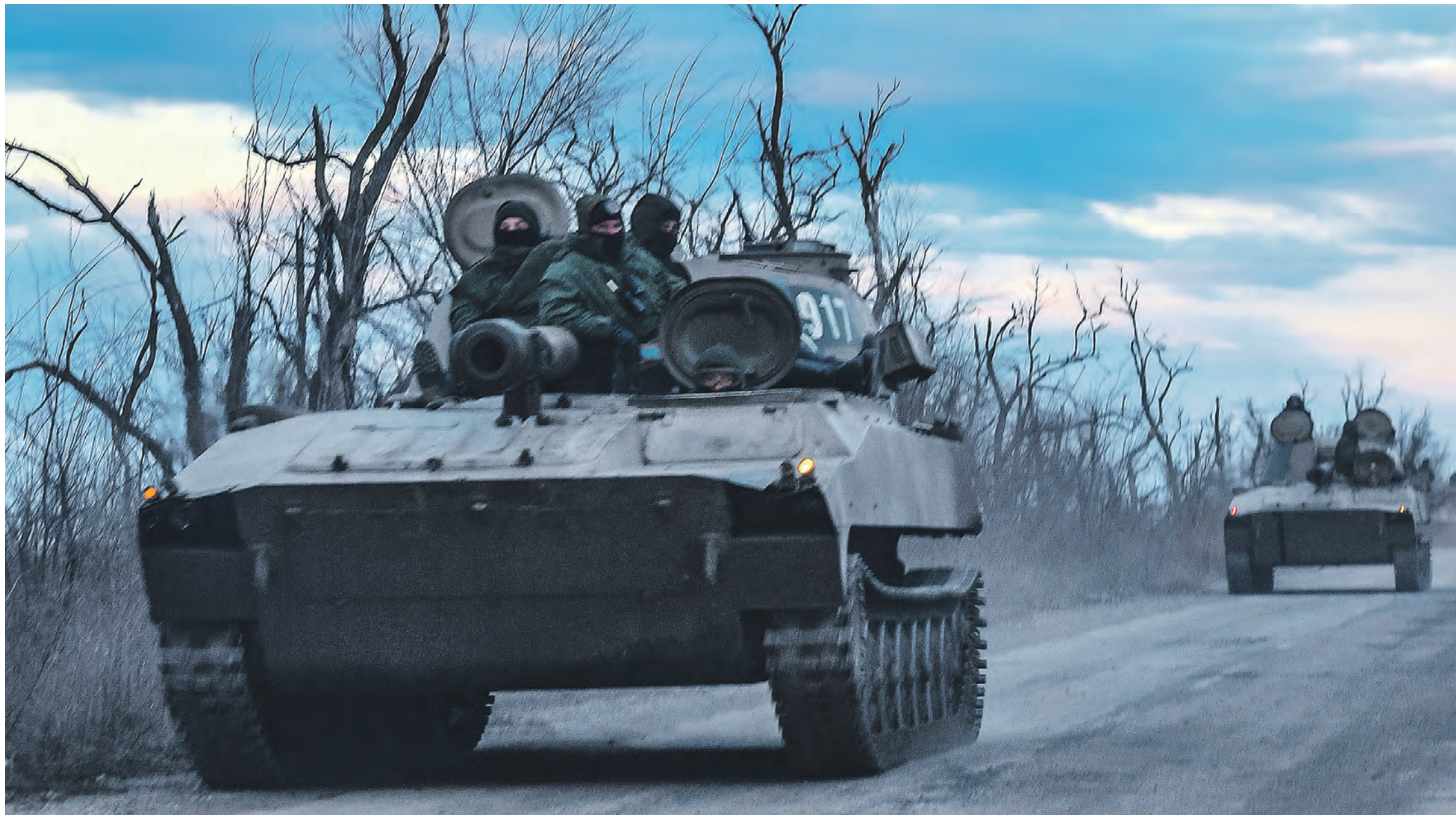
15 марта 2022 года. Колонна Народной милиции ДНР в районе Мариуполя. Количество и качество военной техники в предстоящей битве явно на нашей стороне. Также Россия и ДНР имеют преимущество в живой силе. Но ВСУ обороняются, а мы наступаем — нам сложнее

Перед нашей армией стоит задача уничтожения самой боееспособной группировки врага