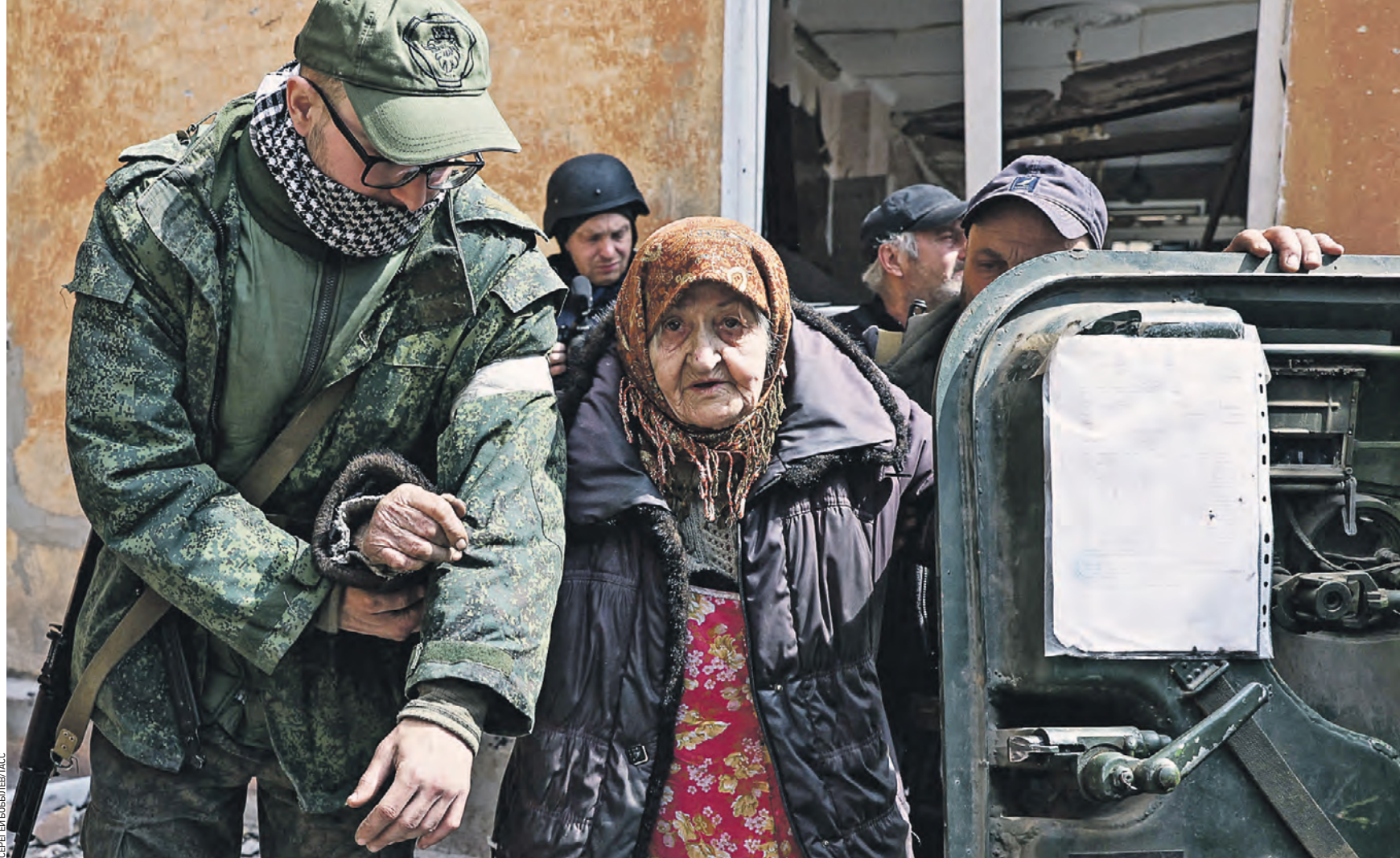
10 апреля 9:40 Российские военные и бойцы Народной милиции ДНР прикрывают эвакуацию жителей Левобережного района Мариуполя. В настоящее время на территорию нашей страны из зоны спецоперации выехали более полутора миллиона мирных граждан, пострадавших от боевых действий. Среди них — 120 тысяч детей

Как рассказал представитель народной милиции ДНР Эдуард Басурин, от украинских националистов очищены уже большую часть территории Мариупольского порта. Порт освобожден примерно на 80 процентов. Кое-где боевики оказывают еще сопротивление. Оставшиеся пытаются уйти в шах завода «Азовсталь». Завод сейчас — как крепость в городе, — рассказал Эдуард Басурин. По его словам, защитники Донбасса освободили 47 морских с трех из шести судов, незаконно захваченных боевиками экстремистского батальона «Азов», запрещенного на территории России.