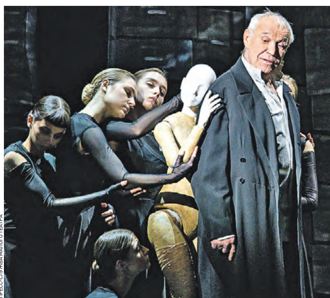
9 февраля 2022 года. Народный артист России Сергей Гармаш в спектакле «Кроткая» исполнил роль Ростовщика

чат мелодии, написанные для этой постановки композитором Кузьмой Бодровым. Исполняет их камерный ансамбль «Солисты Москвы» под руководством народного артиста СССР, лауреата Госпремии Юрия Башмета.