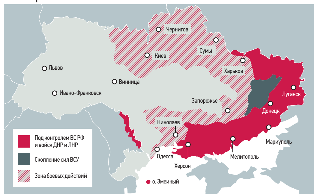
Схема расположения сил

Но, я думаю, они учитывают не только силы ВСУ, но и нацбаты, и территориальную оборону, мобилизованную на охрану городов. Но территориальная оборона — не регулярная армия, она, конечно, значительно слабее. Тем не менее даже сил ВСУ на Донбассе достаточно. Там, например, располагаются подразделения 81-й и 95-й штурмовой бригад, отдельные батальоны Нацгвардии, 57-я моторизованная бригада. — У этих подразделений есть обширный боевой опыт, — уточнил эксперт. А еще у противника есть такие же, как «Азов» (организация, запрещенная в РФ, — «ВМ»), отморозенные нацисты — батальон «Донбасс». Он постоянно пополняется наемниками и добровольцами, в результате чего численность в разы превышает штатную и может превышать 5 тысяч человек. — К тому же с территорий, где снята осада российских войск, в сторону Донбасса выдвинулся резерв, задачей которого станет как раз препятствовать окружению донецкой группировки, — рассказывает Евгений Линин.