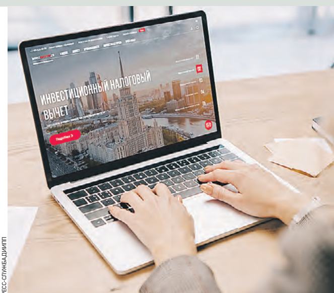
13 февраля 11:20 Сервис «Московский инвестор» помогает предпринимателям ускорить решение деловых вопросов, обращаясь напрямую к профильным ведомствам

Электромусор отправят на переработку Централизованным сбором и утилизацией вышедшего из строя электронного и электрического оборудования в столице займется компания ПО «ЭкоТехПром» по соглашению с правительством Москвы. Это первый