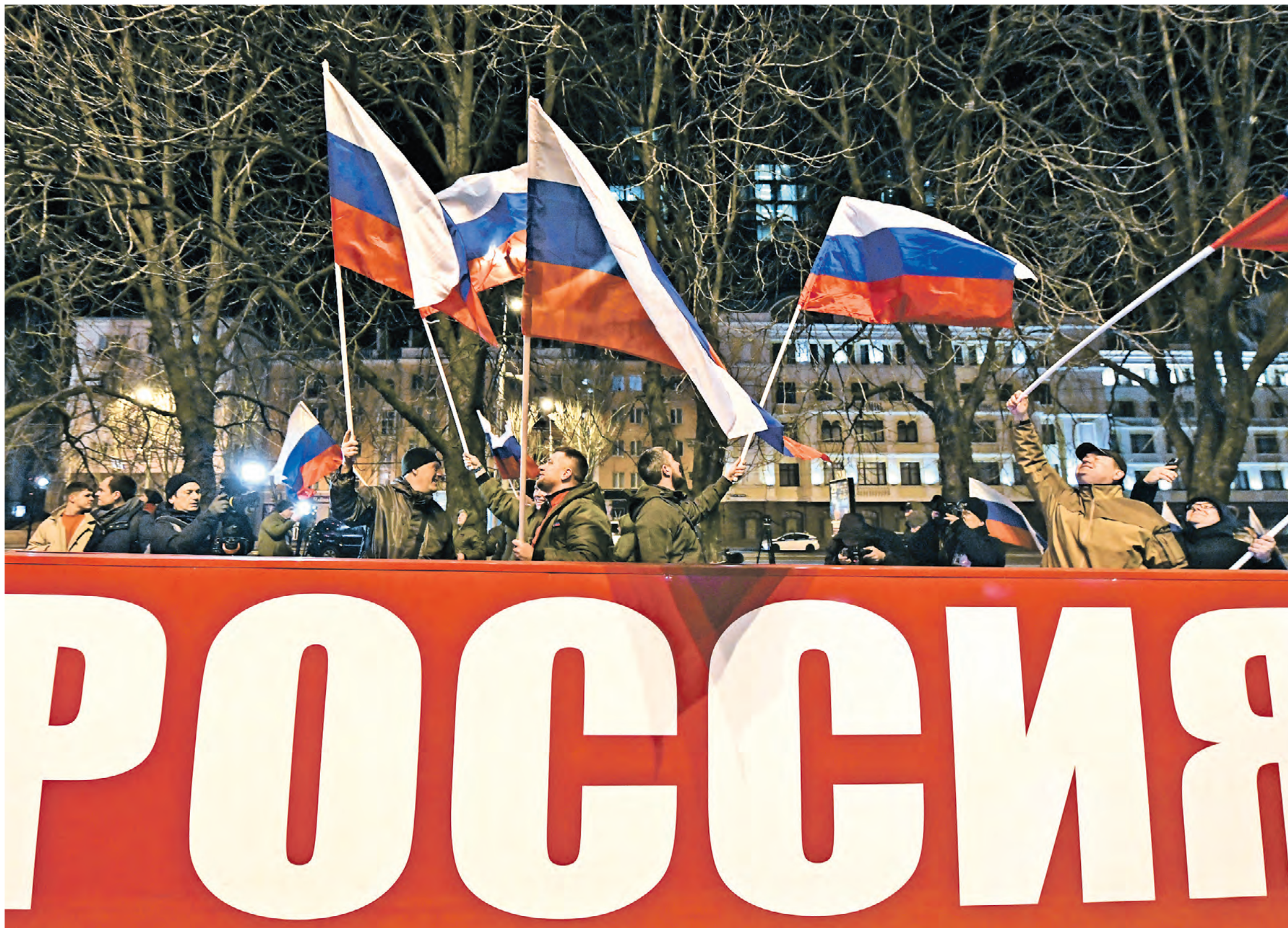
22 февраля 2022 года. Донецк празднует подписание документов о признании Российской Федерацией Донецкой и Луганской Народных Республик

Чего нам ждать от признания независимости Донецкой и Луганской Народных Республик