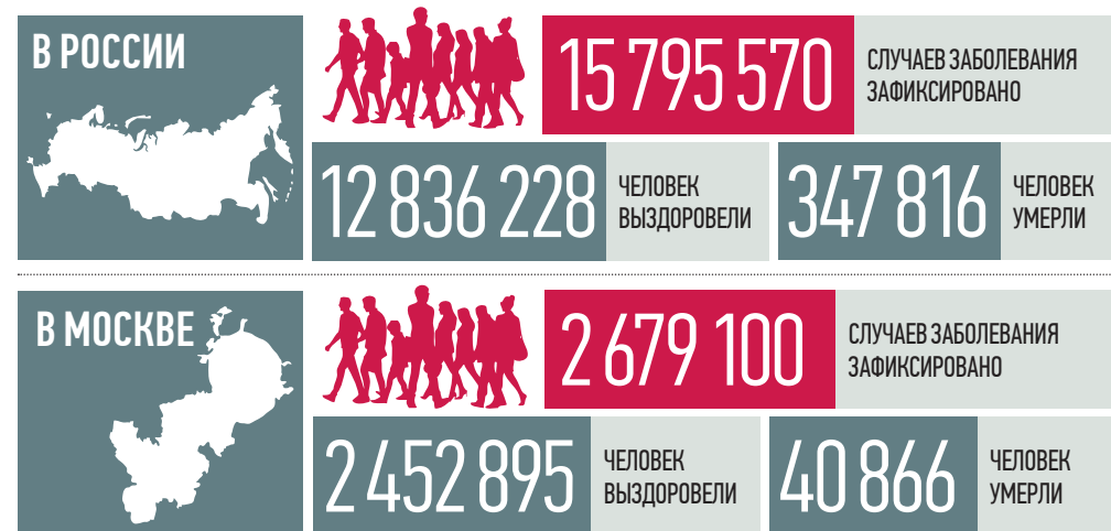
По данным стопкоронавирус.рф и mos.ru на 19:00 23 февраля