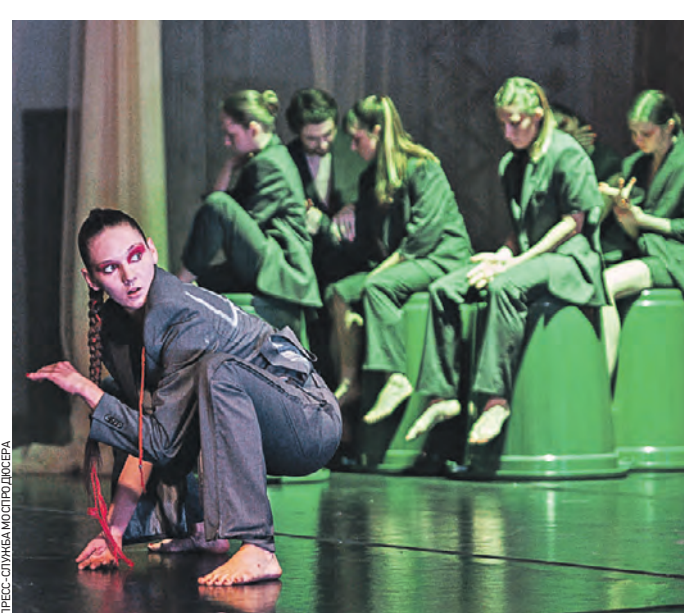
19 февраля 2022 года. Независимый коллектив «tout le corps/всем телом» показал спектакль «Нога конец»

«Арт-платформа» — один из проектов Московского продюсерского центра, организации, которая подчиняется столичному Департаменту культуры. Городу нужна площадка для творческих экспериментов независимых театральных коллективов. — «Арт-платформа» создана для того, чтобы помочь им, — подчеркнули в пресс-службе Моспродюсера. — Если творческий продукт, который нам предлагают к совместной реализации, не противоречит законодательству Российской Федерации, то мы ему рады. Никаких творческих или идейных препон у нас нет и быть не может. Чтобы поддержать независимых деятелей театрального искусства, «Арт-платформа» реализует несколько программ, в том числе «ТеатрONstage»: все желающие могут подать заявку и выиграть шанс выйти с премьерой к зрителям. Программа стартовала в прошлом году. Всего организаторы получили около 150 заявок от участни-