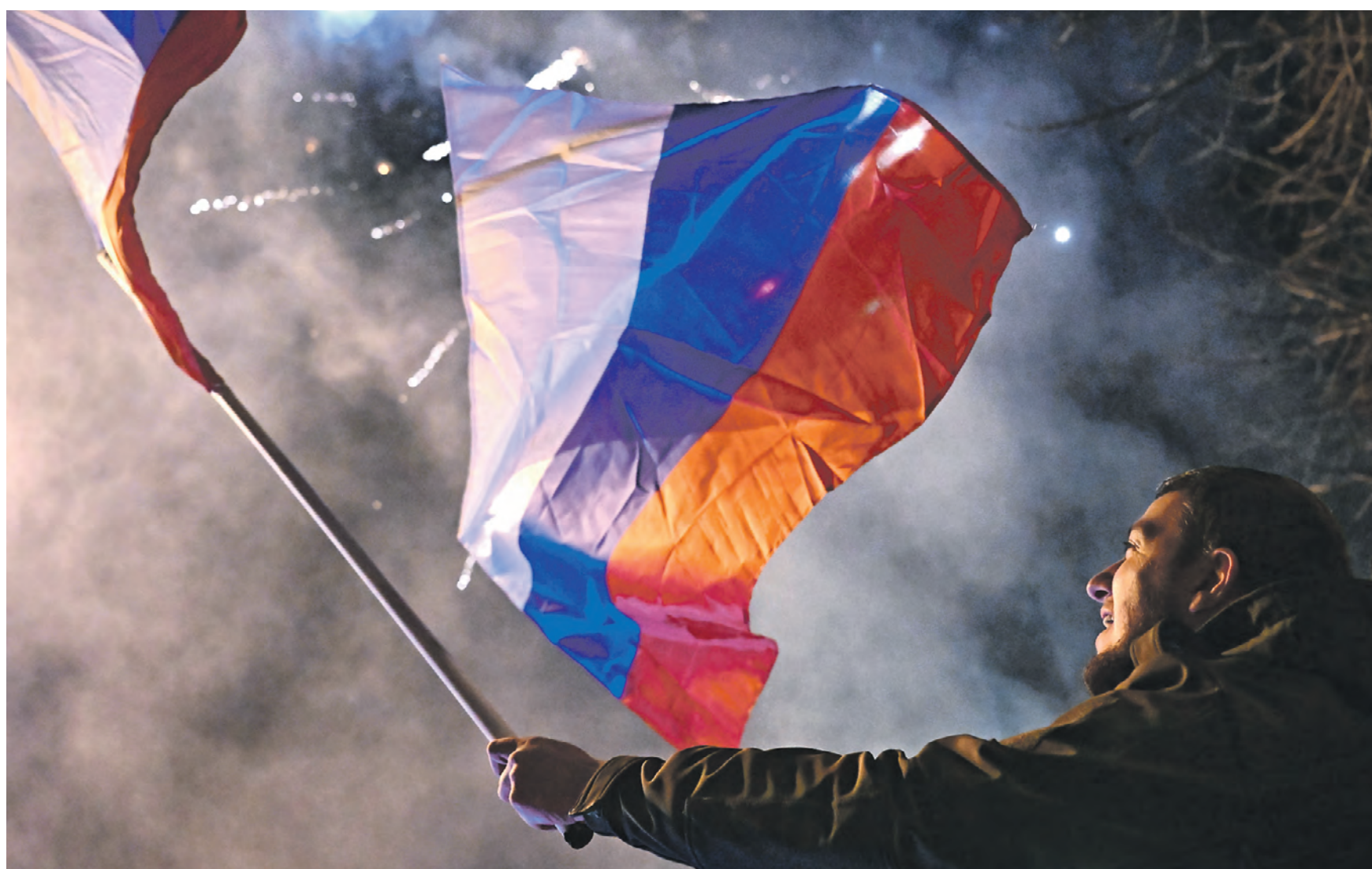
21 февраля 2022 года. Донецк. Люди радуются подписанию документов о признании Россией Луганской Народной Республики и Донецкой Народной Республики

Факт в том, что неуклонное сближение Украины и НАТО — один из главных аргументов в решении Совбеза. Каждый день на Украину прибывает до десятка рейсов с оружием. Открыто несколько миссий, где инструкторы из стран НАТО натаскивают военнослужащих Украины. На Мюнхенской конференции президент Зеленский заявил, что собирается отказаться от статуса безъядерной державы и рассматривает возможность создания атомной бомбы. Сколько бы ни говорили западные политики, что в ближайшее время в НАТО Украину не возьмут, ход событий заставляет усомниться в заверениях. Россия сняла розовые очки и словам не верит, а никаких письменных гарантий США подписывать не желает. Вы задумывались о том, что объединяет людей? Мне кажется, прочнее всего — общее прошлое и общий взгляд на будущее. Это наблюдение справедливо и в отношении народов. Понимание истории у Донбасса и у Украины, которая переметнулась к радикальному на-