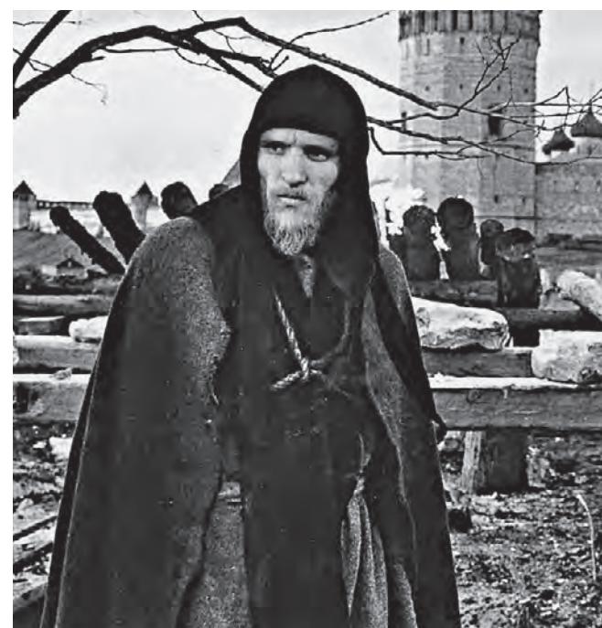
Актер Анатолий Солоницын в фильме «Андрей Рублев» (1966 год), режиссер Андрей Тарковский

«Вечерняя Москва» продолжает вспоминать события, которые происходили в этот день в истории и повлияли на ее дальнейший ход.