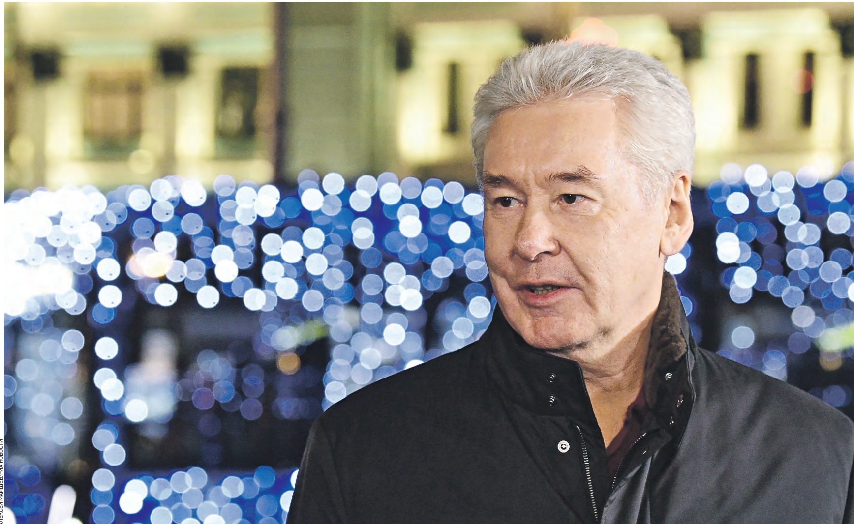
17 декабря 17:00 Мэр Москвы Сергей Собянин на церемонии запуска нового общественного транспорта в столице и 900-го электробуса, который собран на Сокольническом вагоноремонтно-строительном заводе