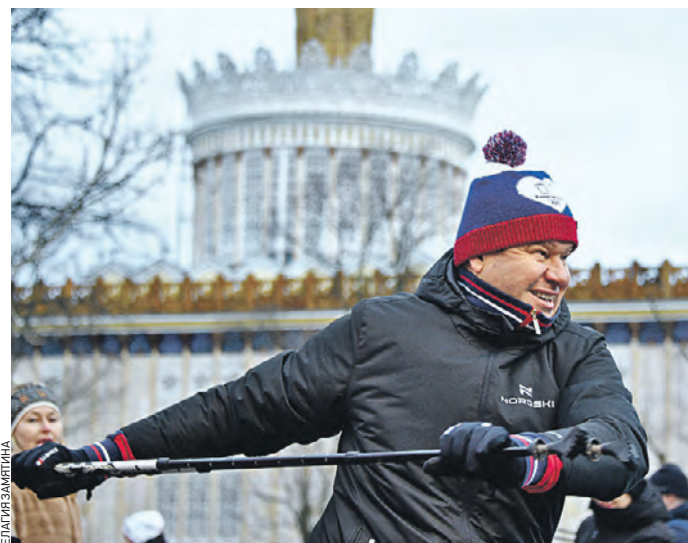
Вчера 15:03 Комментатор Дмитрий Губерниев во время разминки на мастер-классе по скандинавской ходьбе

Вчера в столице прошел мастер-класс по скандинавской ходьбе, в которой принял участие спортивный комментатор Дмитрий Губерниев. «ВМ» присоединилась к этому мероприятию.