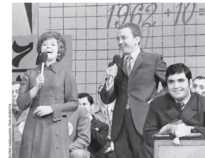
1 января 1971 года. Ведущие КВН Светлана Жильцова и Александр Масляков (в центре) с участниками игры

«Вечерняя Москва» продолжает вспоминать события, которые происходили в этот день и повлияли на ход истории.