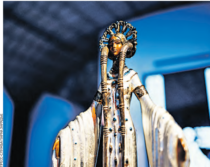
Вчера 13:08 Главный экспонат на выставке «Эрте. Фантазия длиною в век» — изящная скульптура «Византия»

Вчера в парке «Зарядье» открылась выставка «Эрте. Фантазия длиною в век». В Старом Английском дворе показали экспонаты, связанные с творчеством художника-эмигранта Романа Тырова (Эрте) (1892–1990), работавшего в стиле ар-деко.