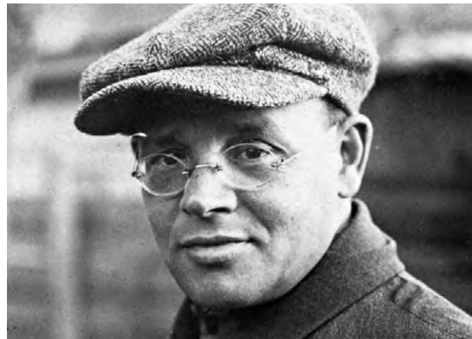
1932 год. Писатель Исаак Бабель. В свое время он был одним из самых почитаемых литераторов в Советском Союзе

По свидетельству современников (того же Валентина Катаева), Бабель был «умнейшим человеком». Он мог эмигрировать из СССР (его надолго отпустили за границу), но почему-то этого не сделал.