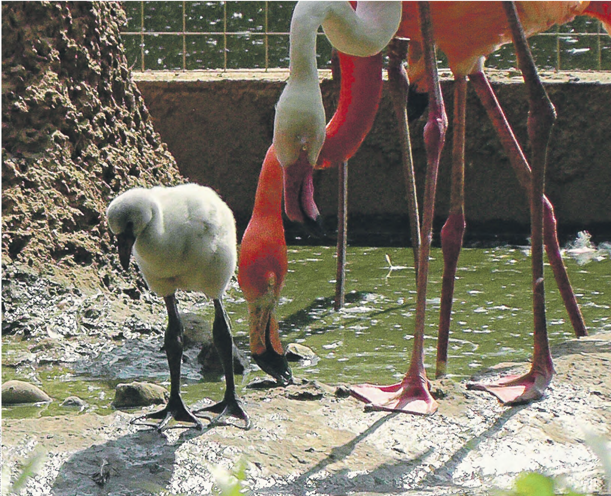
АГЕНСТВО ГОРОДСКАЯ КВАРТИРА, МОСКВА