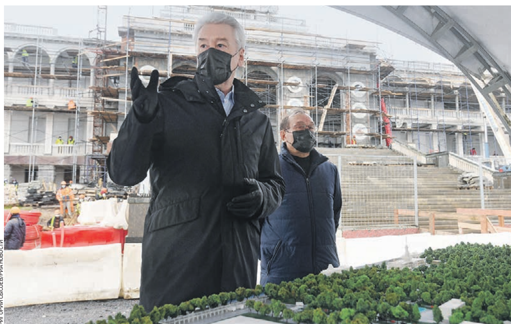
Вчера 12:07 Мэр Москвы Сергей Собянин и его заместитель Петр Бирюков (справа) во время посещения Северного речного вокзала ознакомились с макетом благоустройства его территории

МЭР ПРИЗВАЛ ГОРОЖАН ПРОГОЛОСОВАТЬ ПО ПОПРАВКАМ К КОНСТИТУЦИИ РФ → стр. 2