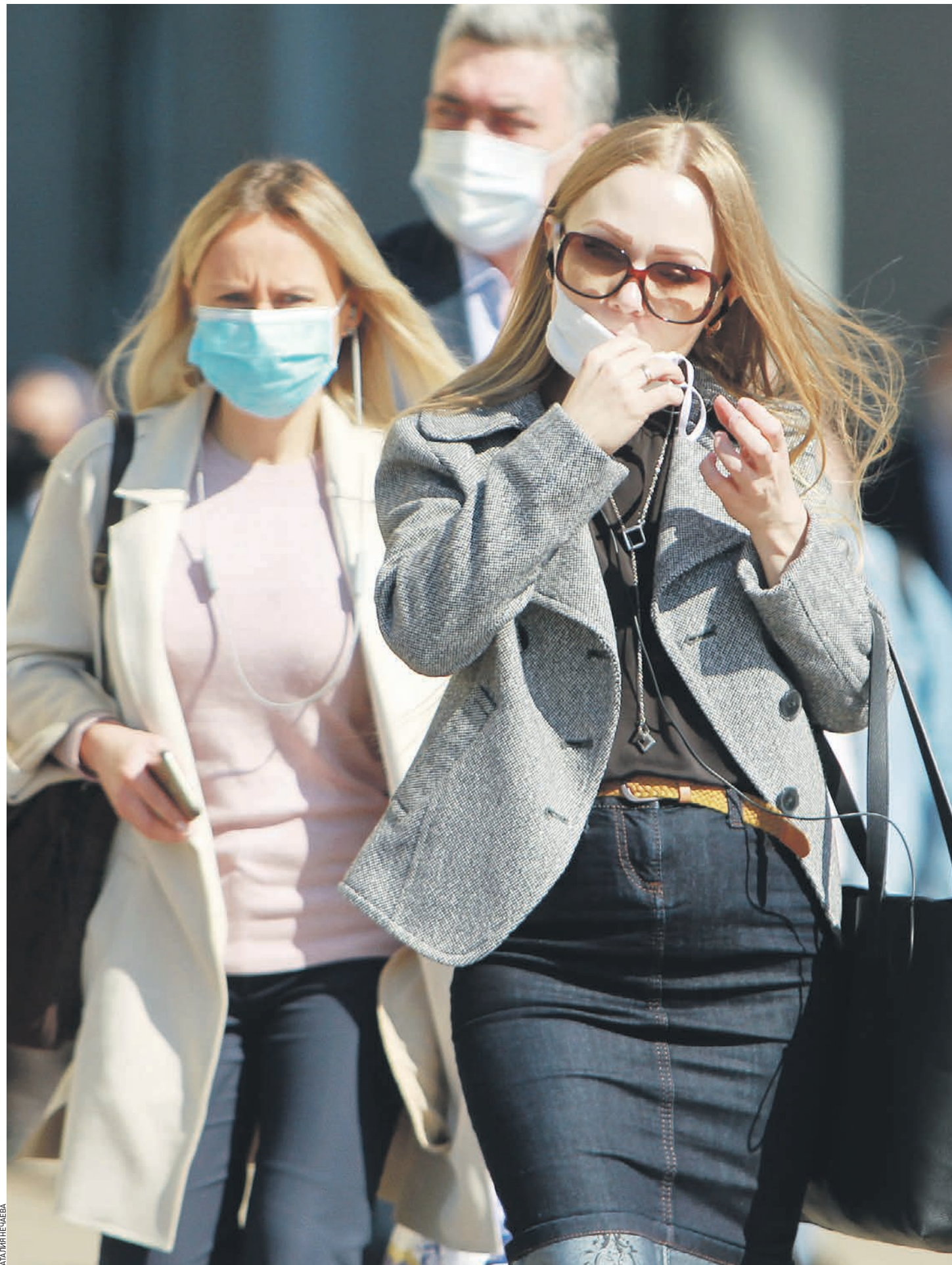
28 мая 2020 года. Режим самоизоляции продлен в Москве до 14 июня включительно, и горожанам по-прежнему нужно соблюдать меры предосторожности

И с этим трудно спорить. Отличить правду от неправды уже крайне сложно, а без упоминания коронавируса нельзя прочесть ни единой заметки — будь она хоть о культуре, хоть о спорте. Контролировать же эмоции человек способен далеко не всегда, напоминает эксперт. И если вы изначально были спокойны и рассудительны, возможно, просто в силу своего «непробиваемого» характера, то человеку с тон-