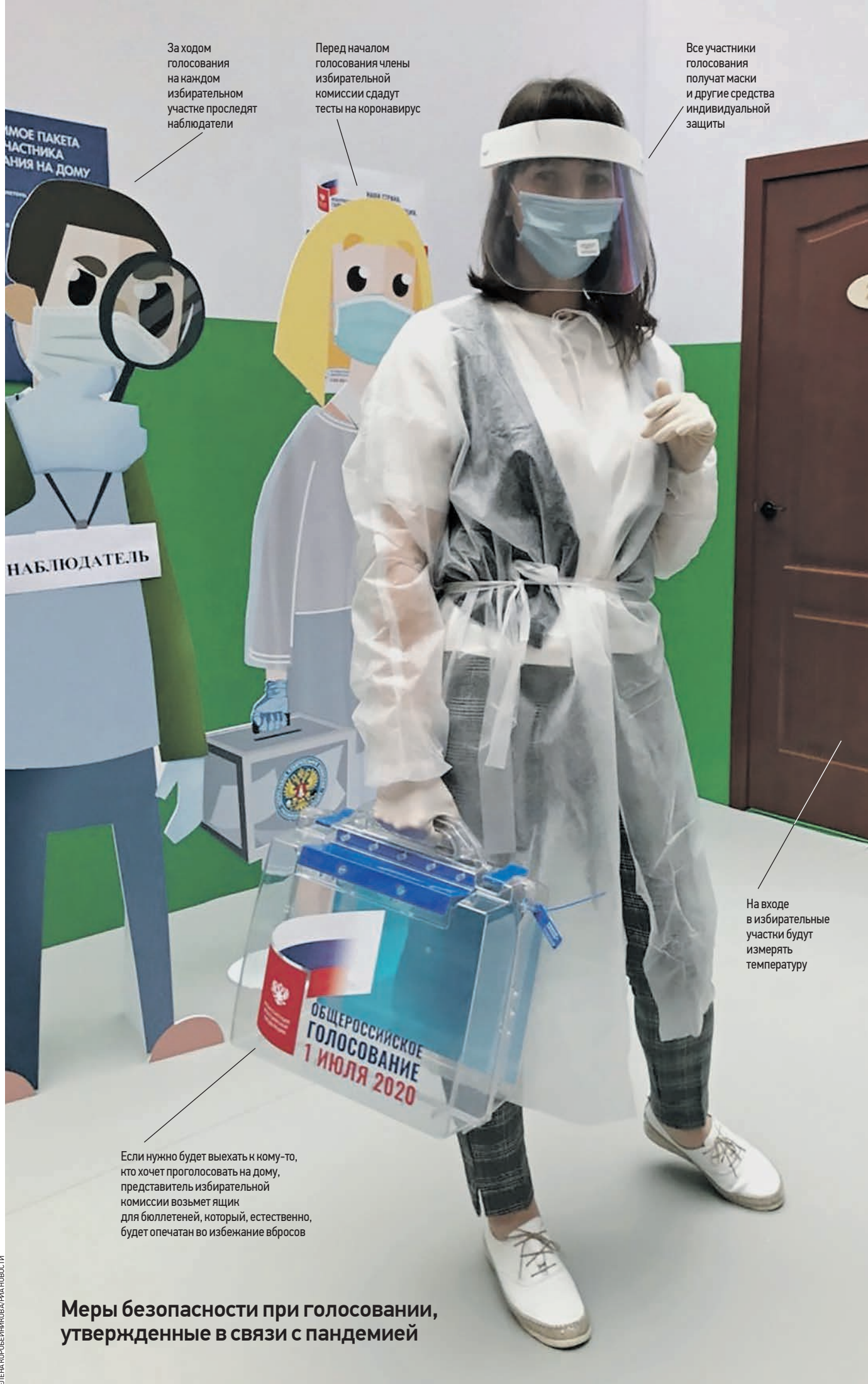
За ходом голосования на каждом избирательном участке проследят наблюдатели

Президент России Владимир Путин подписал указ о проведении 1 июля голосования по внесению изменений в Конституцию Российской Федерации. Эту дату предложили в Центризбиркоме. Участникам голосования нужно будет ответить на вопрос: «Вы одобряете изменения в Конституцию Российской Федерации?»