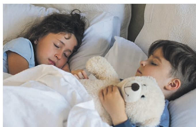
Пока у детей тихий час, мамы могут посвятить несколько часов работе

этому никак не поспособствует. Как минимум два часа после ужина вы читаете книжки, поете песенки, рассказываете сказки. В общем — работаете мамой. Ну а когда ребенок уснет, если есть силы, пишите отчеты, сводите балансы, проверьте тетрадки... — График может быть другим, главное — сделать так, чтобы не разрываться, — уточняет психолог. — И ни в коем случае не позволяйте внушить себе чувство вины! Мамы маленьких детей очень впечатлительны. Накрутить себя — проще простого. Да еще какие-нибудь «добрые» родственники или соседки начнут причитать: мол, зачем рожала, если тебе все время некогда. Ну правда, услышишь такое и начинаешь себя терзать: «Я вот тут сижу за компьютером, а в это время мое сокровище, может, первые шаги делает...» И стыдно, и тоскливо. Потому что так и правда мо-