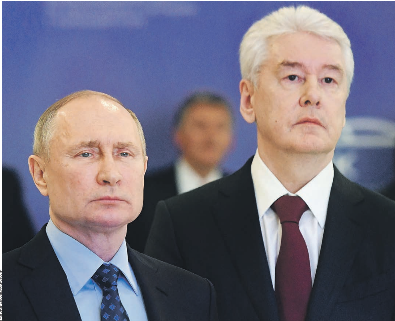
17 марта 2020 года. Президент России Владимир Путин (слева) и мэр Москвы Сергей Собянин во время посещения информационного центра по мониторингу ситуации с коронавирусом Департамента здравоохранения столицы

Как напомнил президент, медикам, которые оказывают помощь больным с коронавирусной инфекцией, с апреля по июнь полагаются специальные доплаты «за работу в особо опасных и сложных условиях». Так, размер федеральной надбавки для врачей составляет 80 тысяч рублей в месяц, среднего медперсонала — 50 тысяч рублей, младшего медперсонала — 25 тысяч рублей. Кроме того, выплаты предусмотрены и для работников скорой помощи: врачи получают по 50 тысяч рублей в месяц, фельдшеры, медсестры и водители — по 25 тысяч рублей. Столичные медики, по решению мэра Москвы Сергея Собянина, помимо федеральных выплат, получают региональные надбавки. Врачам московских больниц, перепрофилированных в коронавирусные стационары, из городского бюджета платят по 70 тысяч рублей, среднему медперсоналу — по 50 тысяч рублей, остальным работникам — по 30 тысяч рублей. Аналогичные надбавки по-