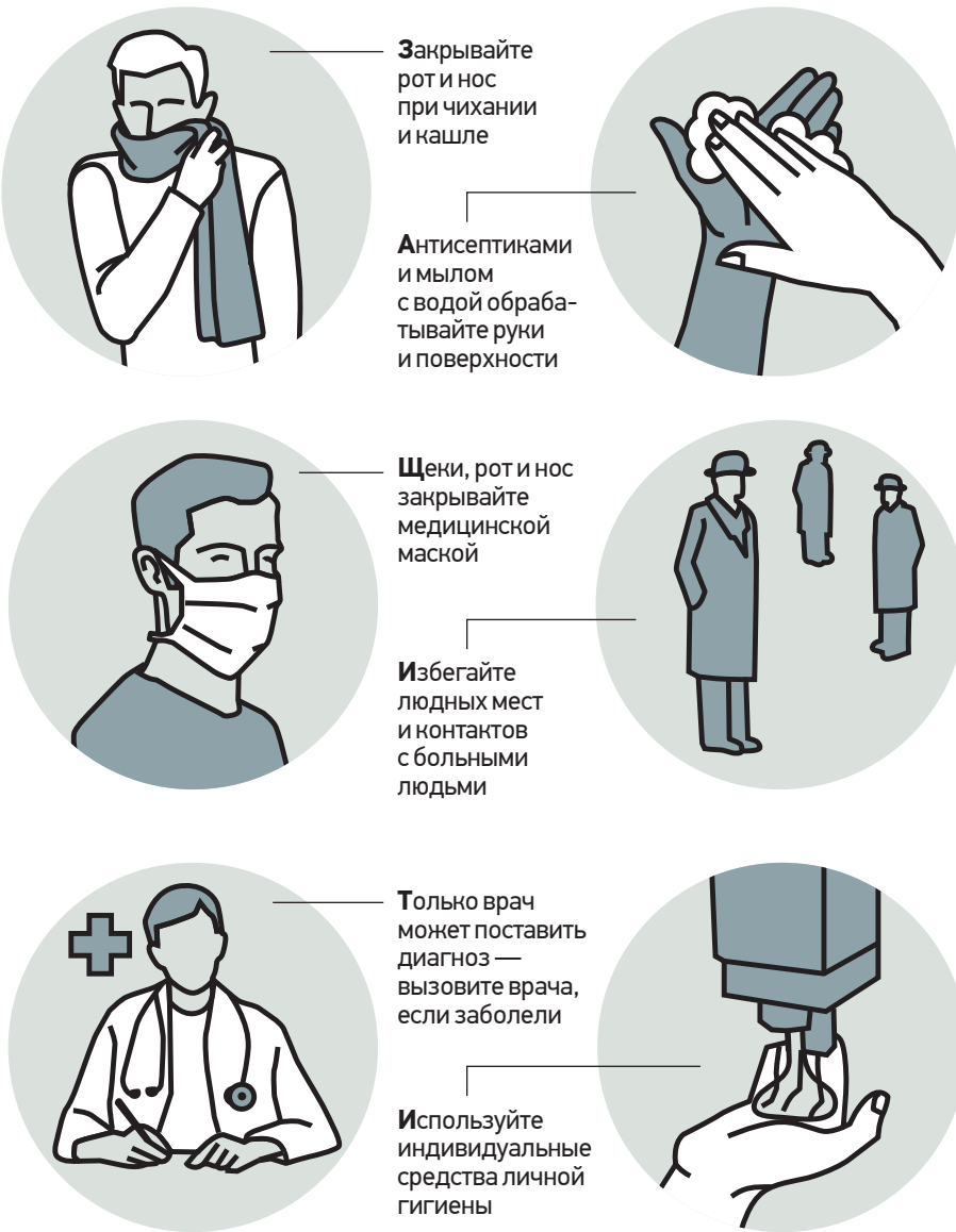
По данным Роспотребнадзора