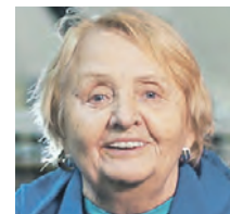
ГАЛИНА ГОРХОВА ТРЕХКРАТНАЯ ОЛИМПИЙСКАЯ ЧЕМПИОНКА ПО ФЕХТОВАНИЮ

Но хныкать — это плохо, надо радоваться жизни, друзьям. Мы — ветераны отечественного спорта — одна олимпийская семья, мы в одном чате находимся, каждый день перезваниваемся, поддерживаем друг друга. Если кого-то давно не слышали, разговариваем — вдруг человеку нужна помощь. Например, с гимнастками Ларисой Латыниной (девятикратная олимпийская чемпионка. — «ВМ») и Лидой Ивановой (двукратная олимпийская чемпионка. — «ВМ») мы дружим с 1960-х годов. Мы уже стали друг другу ближе, чем родственники. К сожалению, у молодых российских спортсменов сейчас какая-то разобщенность. Мы, например, все болели за соотечественников во время соревнований. А нынешние спортсмены — выступили и ушли из зала. Я говорю не только про фехтование. Держаться надо друг друга, поддерживать. Так нас воспитывали тренеры. Должна быть преемственность. Если она есть, то победные традиции не обрываются. Это как стихи «Я помню чудное мгновение». Начинаю читать первую строку, а вы мне: «Передо мной явилась ты». Вот это — преемственность. А если вы в ответ: «Какое еще мгновение?» — то все, цепочка традиций прервалась. Сейчас у олимпийских чемпионов и призеров Олимпиад — достойные пенсии, которые они заслужили, прославляя свою страну. И я в свои 82 на жизнь не жалуюсь. Да, хочется здоровье поправить после операции на коленном суставе. Бегаю между медицинскими центрами и работой. Надо продолжать деятельность Российского союза спортсменов, чтобы еще сильнее объединить нашу олимпийскую семью.