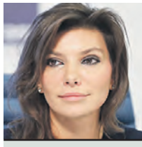
ЕВГЕНИЯ МАРКОВА ГЕНЕРАЛЬНЫЙ ДИРЕКТОР РОСКИНО

Программа, которую мы предлагаем зрителям, состоит из 166 картин, вышедших в российский прокат в последние три года и получивших высокую оценку критиков. Для каждого фильма мы организуем отдельную рекламную кампанию.