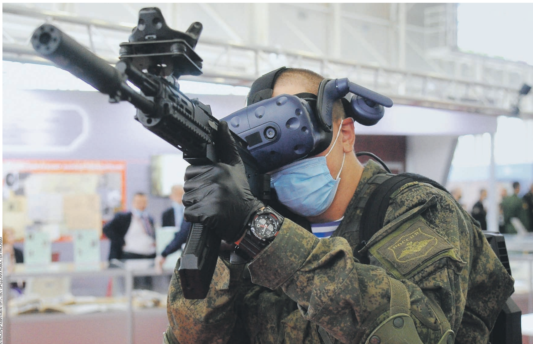
Вчера 14:30 Представитель Вооруженных сил России тестирует инновационный прицельный комплекс для легкого стрелкового оружия. На выставке военной техники и вооружения, открывшейся в рамках форума «Армия-2020», российские компании представили десятки новых образцов

К участникам обратился президент России Владимир Путин. — Хорошо понимаем, как важно вместе искать ответы на возникающие вызовы, — заявил глава государства. Увидеть 28 тысяч образцов вооружения, боевой и специальной техники и зрелищный динамический показ их возможностей на соревнованиях военных профессионалов — такую уникальную возможность предоставляет в этом году москвичам Министерство обороны России. — Свыше 90 делегаций прибыли для того, чтобы посмотреть достижения российских оружейников, все то, что наша оборонная промышленность может сделать, — сказал глава оборонного ведомства страны, генерал армии Сергей Шойгу на открытии оружейного форума в военно-патриотическом парке «Патриот».