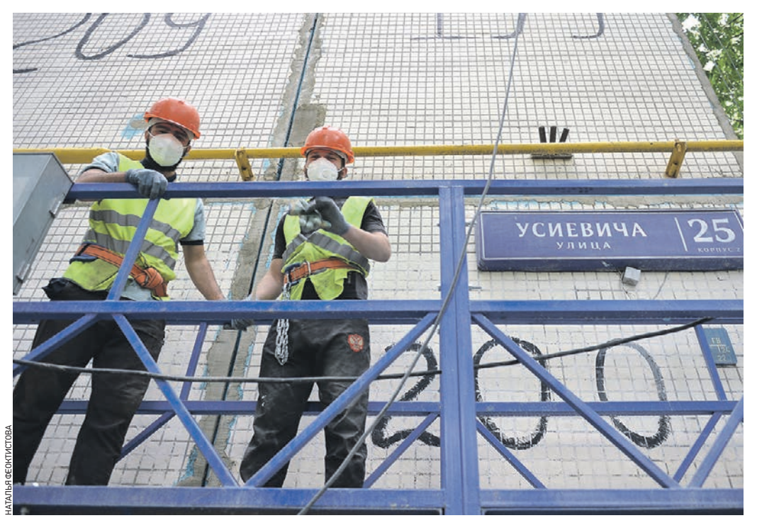
19 августа 13:31 Рабочие готовятся к снятию облицовочной плитки. Предварительно каждую панель на фасаде пронумеровали, чтобы контролировать поэтапное выполнение процессов