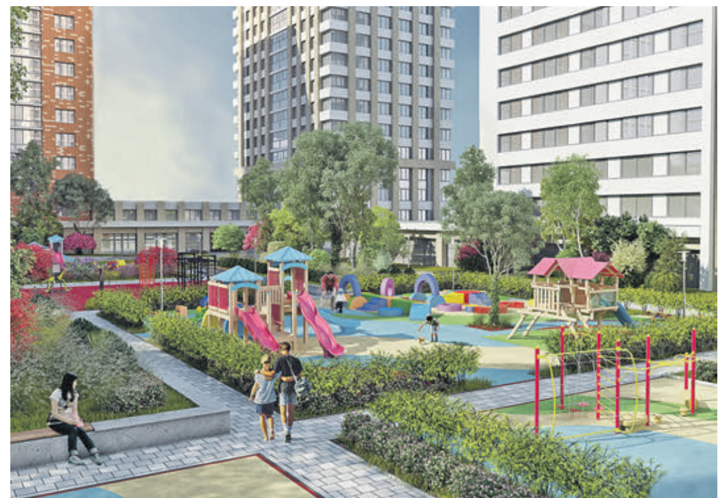
Так согласно проекту планировки территории будет выглядеть обычный дворик в Бабушкинском районе

В ходе публичных слушаний жители высказывают конструктивные предложения: где-то дорогу немного подорожному провести, где-то дообить парковочных мест, где-то — зеленых насаждений. Это нормальный рабочий процесс, диалог с жителями. Никаких недовольств на прошедших 12 публичных слушаниях не было. Это еще раз подтверждает, что программа реновации максимально подержана жителями.