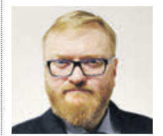
ВИТАЛИЙ МИЛОВ ДЕПУТАТ ГОСДУМЫ РФ

кам. В определенной мере Михаил Пиотровский прав, ведь решать, что останется в истории, будут наши потомки. Существует ведь современное классическое искусство. Например, современная классическая музыка, которая разительно отличается от «драм-н-басса». Главный вопрос в том, что именно через десятилетия или столетия будет характеризовать нашу эпоху.