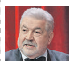
ЮЛИЙ ГУСМАН ЗАСЛУЖЕННЫЙ ДЕЯТЕЛЬ ИСКУССТВ РОССИИ, РЕЖИССЕР ПЕРВОГО ТЕЛЕМОСТА МЕЖДУ СССР И США

К власти можно относиться как угодно плохо, к своей или чужой. Но разговаривать с народами необходимо. Даже при Хрущеве, когда впервые упал «железный занавес» и установился диалог между культурами, например во время Всемирного фестиваля молодежи и студентов, все это было воспринято с огромным энтузиазмом. И сейчас общество тоже устало от этой конфронтации и с большим удовольствием готово включиться в такой разговор.