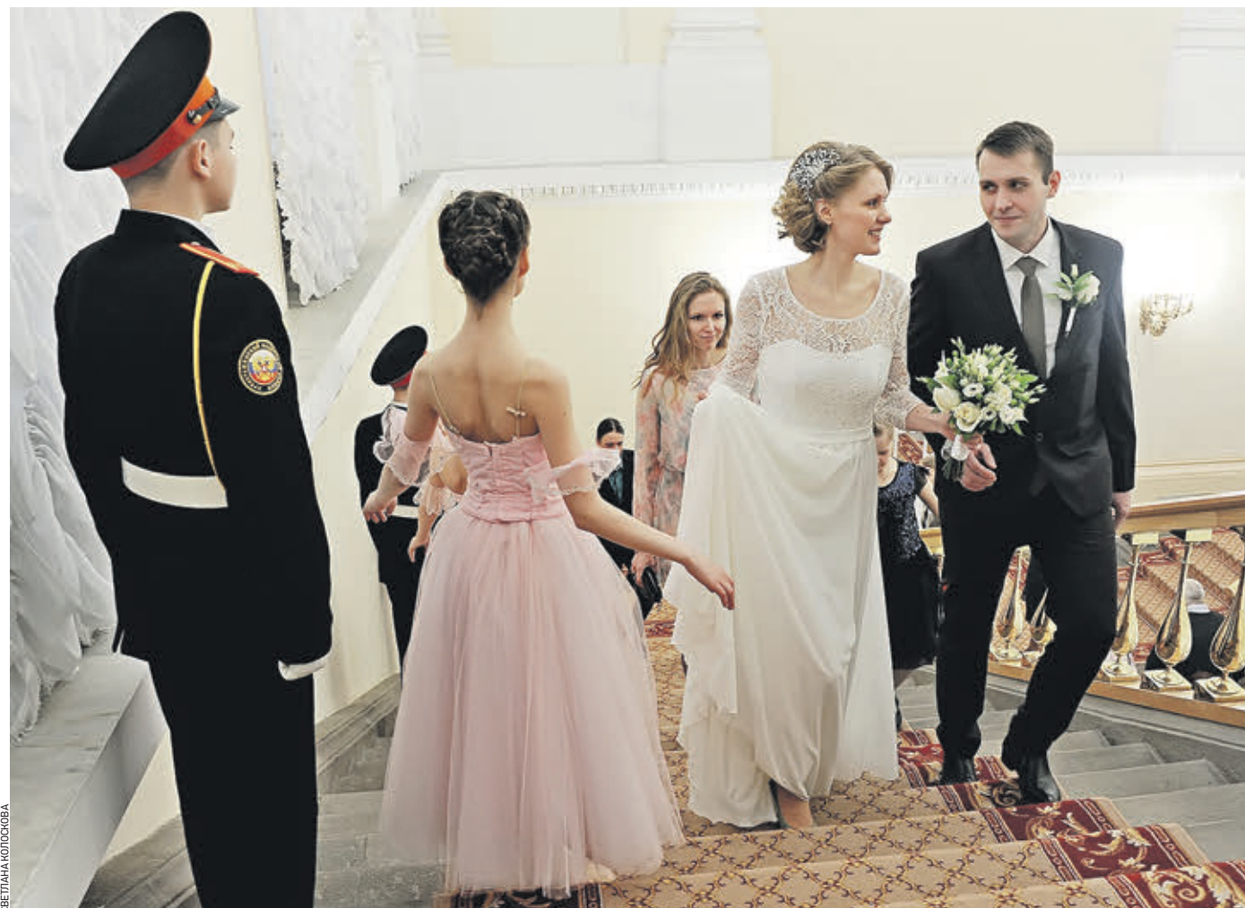
14 апреля 2018 года. Торжественная церемония бракосочетания молодых москвичей на Красную горку в Белом зале столичной мэрии. Молодожены поднимаются в зал по парадной лестнице

Приводим публикацию мэра столицы полностью. Мы планируем сделать роскошный подарок нынешним и будущим молодоженам. Правительство Москвы открывает новые необычные площадки для торжественной регистрации брака в лучших местах столицы. Начиная с 20 локаций, популярных среди москвичей. В дальнейшем их перечень будет меняться с учетом пожеланий молодоженов.