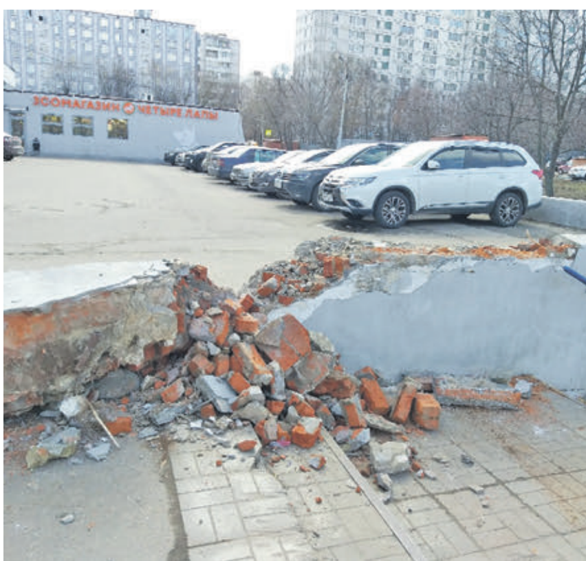
27 марта 2019 года. В редакцию обратились жители Шипиловской улицы. Москвичи пожаловались на то, что возле дома № 50, корпус 1, развалился кирпичное ограждение и фактически представляет собой груду стройматериалов. Мало того, что эта гора портит облик придомовой территории, так еще и представляет собой реальную угрозу — если наступить на валяющиеся повсюду битые кирпичи, то наверняка можно вывихнуть ногу. Тем более что это место довольно людное — оно находится на пути в крупные магазины.