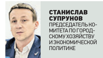
СТАНИСЛАВ СПУРНОВ ПРЕДСЕДАТЕЛЬ КОМИТЕТА ПО ГОРОДСКОМУ ХОЗЯЙСТВУ И ЭКОНОМИЧЕСКОЙ ПОЛИТИКЕ

И эти нормативы, как правило, не предусматривают варианты новых застройок. А значит, нужно вносить поправки в уже существующие правила. Зачастую — это долго, дорого и нерентабельно. Именно поэтому предприниматели понимают, что хотят осуществлять свою деятельность сейчас, а не через какой-то непонятный промежуток времени. В свою очередь стоит отметить, что в последние годы специально самострой никто не создает. Эти сооружения достались нам историческим путем. Например, на месте определенного участка была временная конструкция, затем поставили капитальные стены. И спустя еще время тут появились крыша и второй этаж. На первом этапе предприниматели не думали, что нужно все это оформлять юридически и приводить в «божеский вид». Таким образом и появился самострой. Сейчас предприниматели стараются подходить более ответственно к вопросам строительства. Именно поэтому я считаю, что спустя время проблема самостроев уйдет. Таких построек просто не будет существовать.