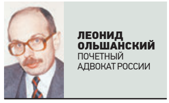
ЛЕОНИД ОЛЬШАНСКИЙ ПОЧЕТНЫЙ АДВОКАТ РОССИИ