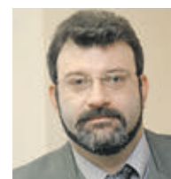
ИГОРЬ БЕРЕЗИН ПРЕЗИДЕНТ ГИЛЬДИИ МАРКЕТОЛОГОВ

В общем, друзья, праздник — это здорово. Но, делая покупки, сначала подумайте, насколько они вам реально нужны и выгодны. Не забывайте на волне Нового года об экономии.