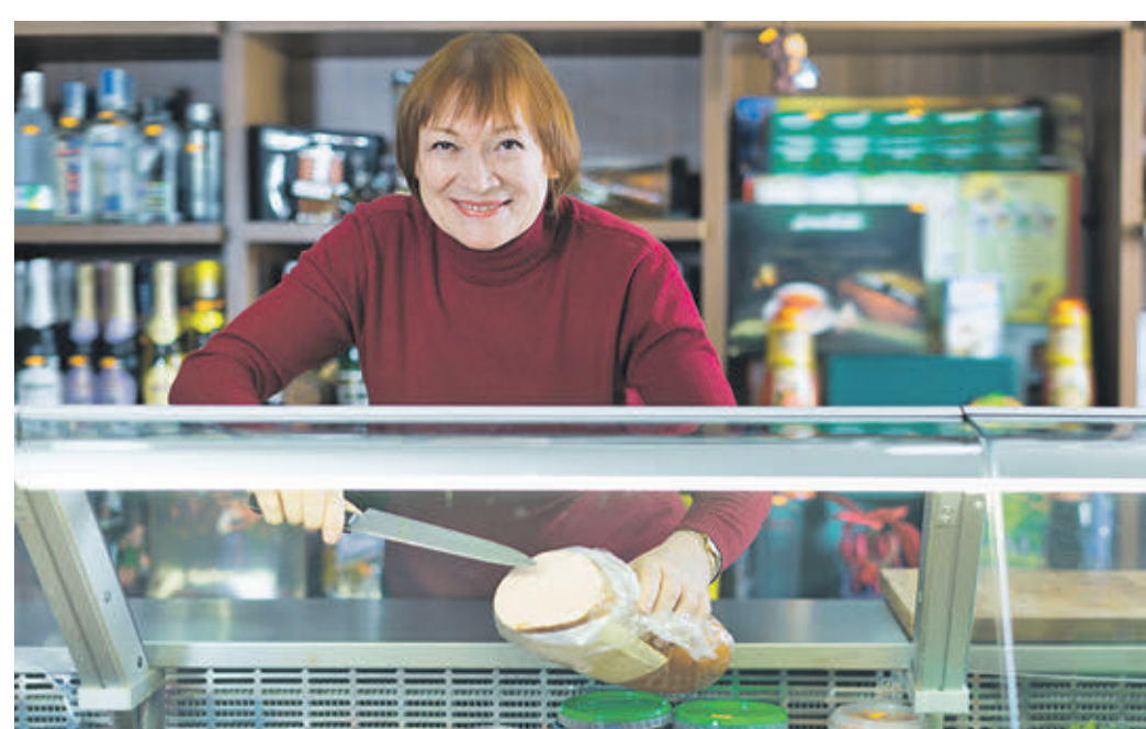
28 ноября 2019 года. Продавец магазина у дома предлагает вареную колбасу. По мнению экспертов, выбирать продукт нужно тщательно — в нем порой бывает много «химии»