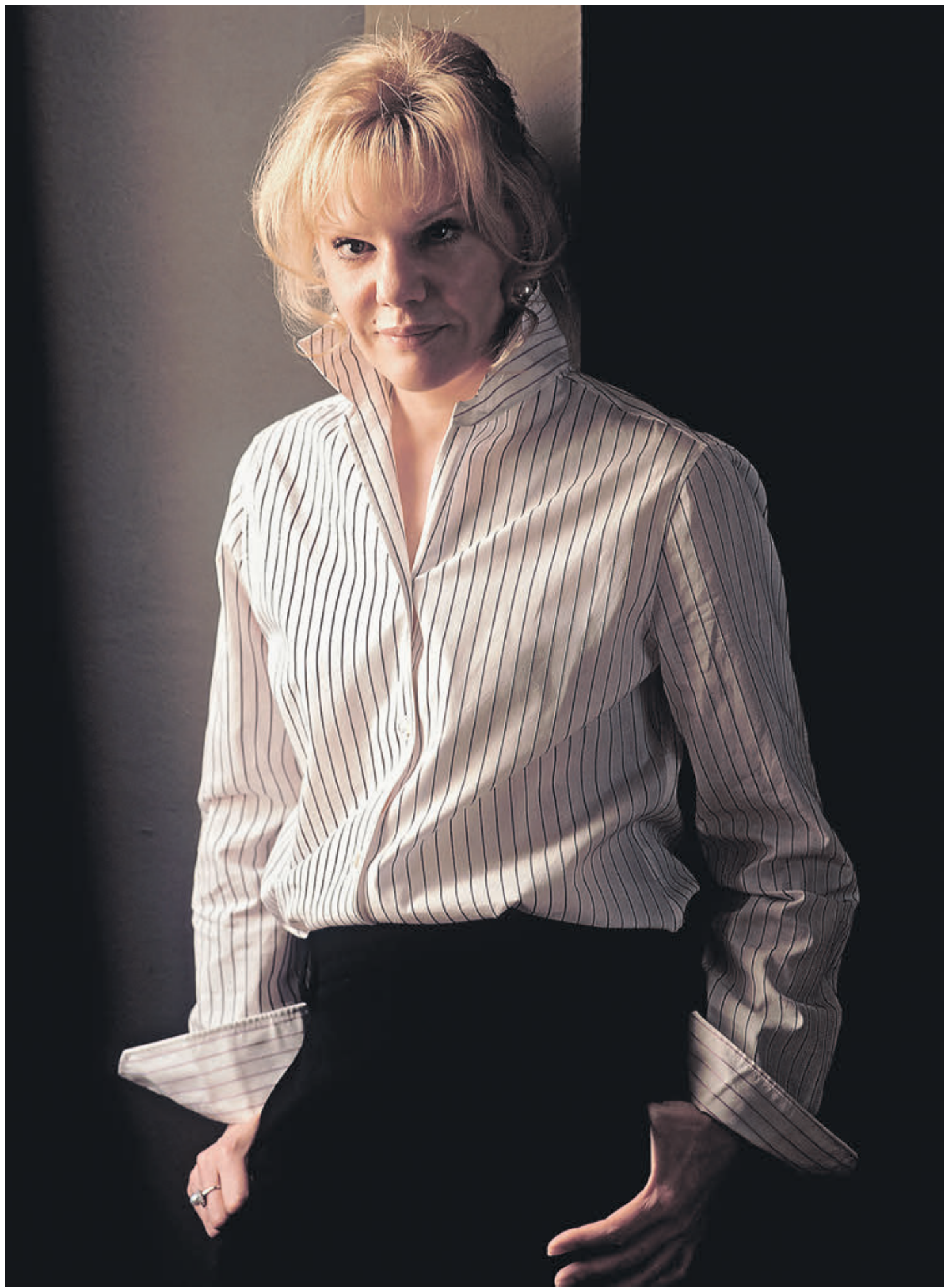
1 февраля 2006 года. Народная артистка России, ведущая актриса театра «Ленком» Александра Захарова

Есть театральные гении — Вахтангов, Товстоногов, Эфрос. Захаров — из этой плеяды. Ощущаете, что родились в семье великого режиссера? Я это понимаю. Язык его спектаклей еще будут изучать в театральных вузах, он войдет в историю российского театра. У Марка Анатольевича есть дар какого-то провидения. Он словно под лучом сидит и пишет эти свои пьесы. И то, что он делает, можно расшифровывать бесконечно. Как и его фильмы, которые не стареют. А какой гений в быту? Он не знает. Правда. Он все время работает. Он постоянно пишет, репетирует, много читает. В быту? Он очень любит жареную картошку. Это вы ему ее сами жарите? Я, честно говоря, ее плохо жарю. Но у нас есть замечательная помощница. Вот она жарит так, что можно ресторан открывать. Ну а у вас — то самой, раз уж зашла речь об этом, какое блюдо любите? Также жареная картошка. И еще я люблю всякую «вредную гадость» — чипсы, шоколадное мороженое — то, что нельзя есть. Но я ем.