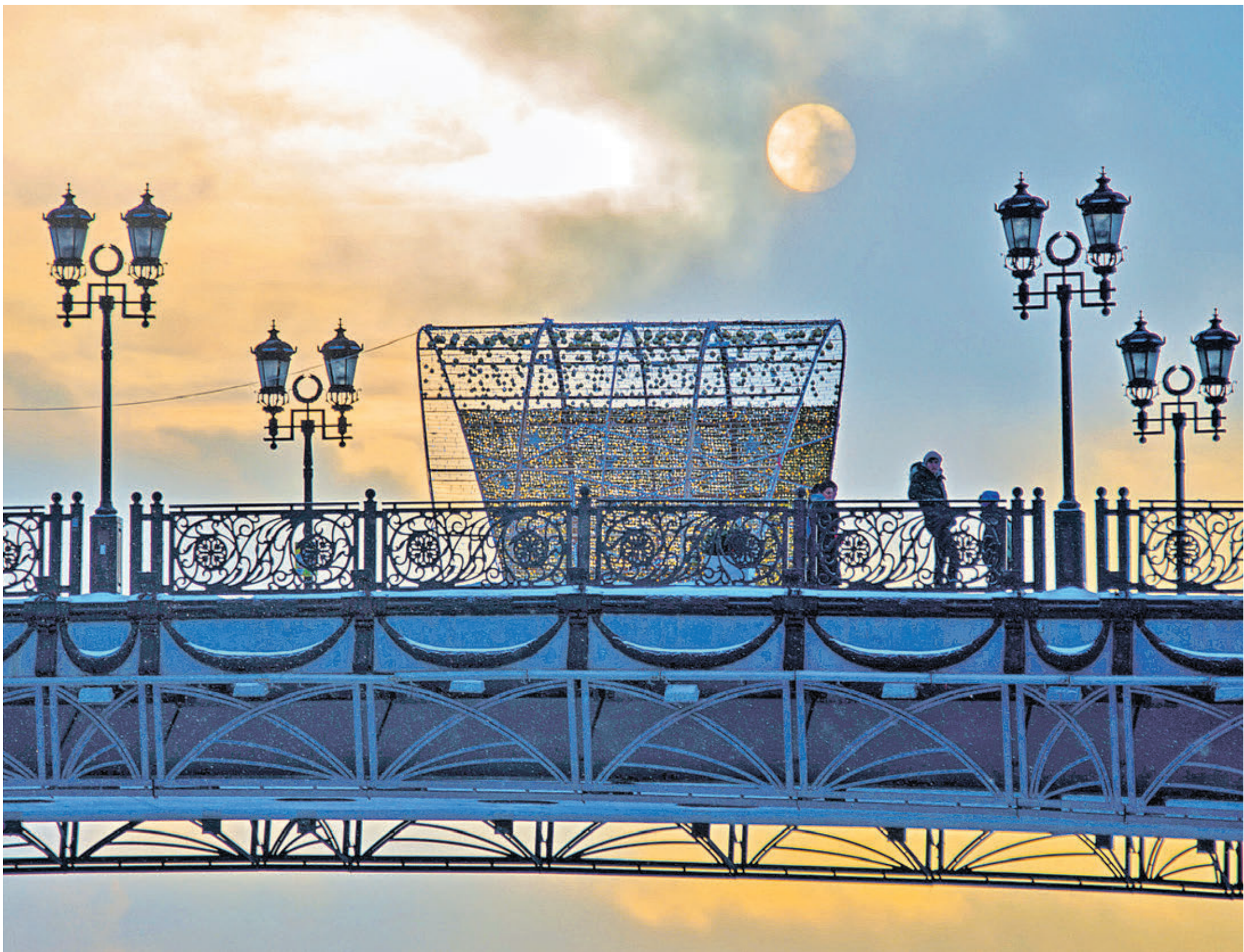
Вчера 16:42 В середине морозного дня Патриарший мост приобрел приятный ультрафиолетовый оттенок, что не скрылось от взгляда фотокорреспондента «ВМ» Натальи Феоктистовой