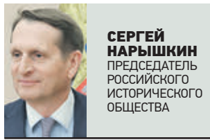
СЕРГЕЙ НАРЫШКИН ПРЕДСЕДТЕЛЬ РОССИЙСКОГО ИСТОРИЧЕСКОГО ОБЩЕСТВА

Полагаю, что популяризация этой темы позволит сохранить историческую память об этих событиях.