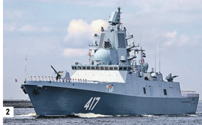
28 июля 2018 года. Церемония включения фрегата «Адмирал флота Советского Союза Горшков» в состав ВМФ России (1) Фрегат на территории завода «Северная верфь» (2)

Эти корабли имеют мощное вооружение, которое скрыто внутри конструкции. На вооружении фрегатов типа «Адмирал Горшков» — 16 противокорабельных ракет «Калибр» или «Оникс». Защиту с воздуха обеспечивает комплекс «Полюс-Редут». Если атака на корабль будет произведена из-под воды, его зай-