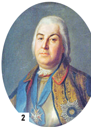
Картина «Сражение при Кунерсдорфе 12 августа 1759 года» А. Кюцебу (1) Петр Семенович Салтыков (автор картины неизвестен) (2)

12 августа 1759 года русская армия совместно с австрийцами нанесла поражение прусскому королю Фридриху Великому при Кунерсдорфе. Этого добился генерал-аншеф Петр Салтыков, в которого не верил никто — ни солдаты, ни офицеры.