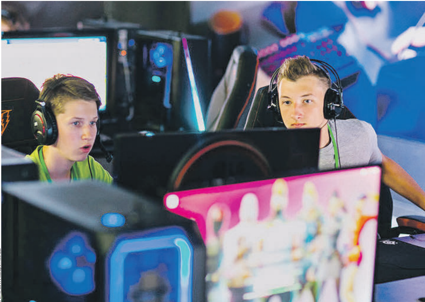
4 августа 2018 года. Юные киберспортсмены сражаются в отборочном матче по дисциплине Fortnite (популярный симулятор по выживанию) на площадке стадиона Gamer Stadium

Ближайшие перспективы На сегодняшний день киберспорт — это уникальная индустрия на стыке спорта, развлечений и медиа. Объем ее рынка в настоящее время составляет 1 миллиард долларов с темпом роста в 20,6 процента в год. Аудитория киберспорта насчитывает 380 миллионов человек. — Цель Москвы — стать лидером по сопровождению всего киберспортивного сегмента. Мегалполис уже приступил