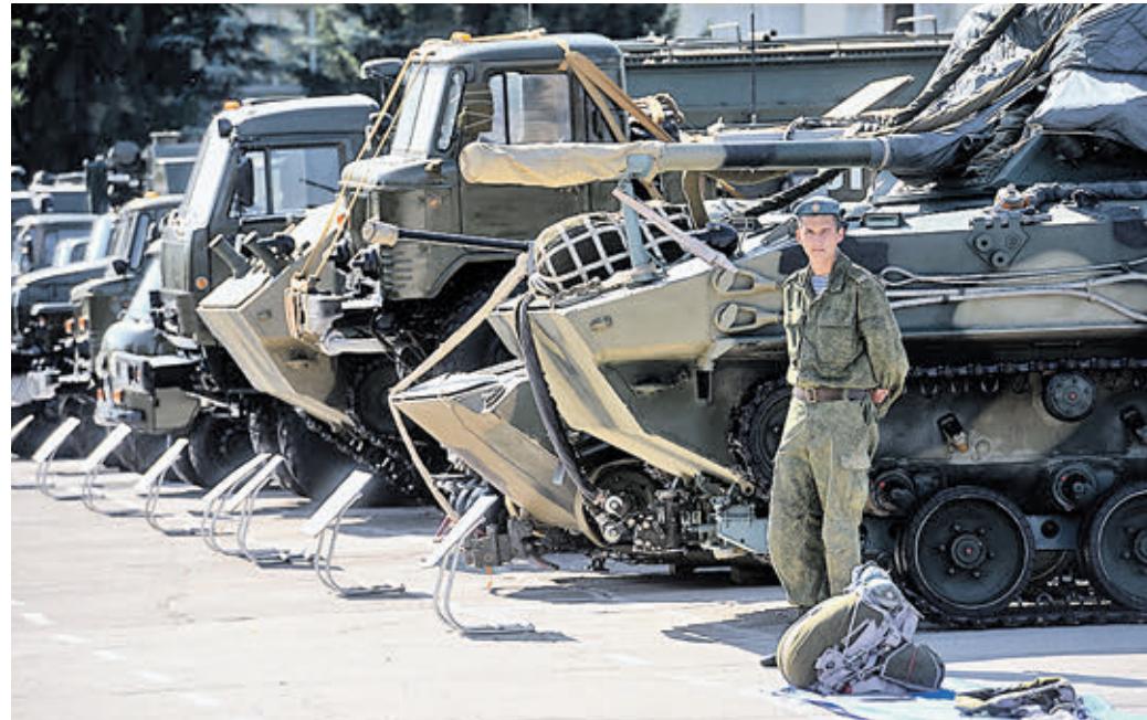
9 сентября 2014 года. Военнослужащий на выставке вооружений на территории 51-го полка Тульской десантной дивизии