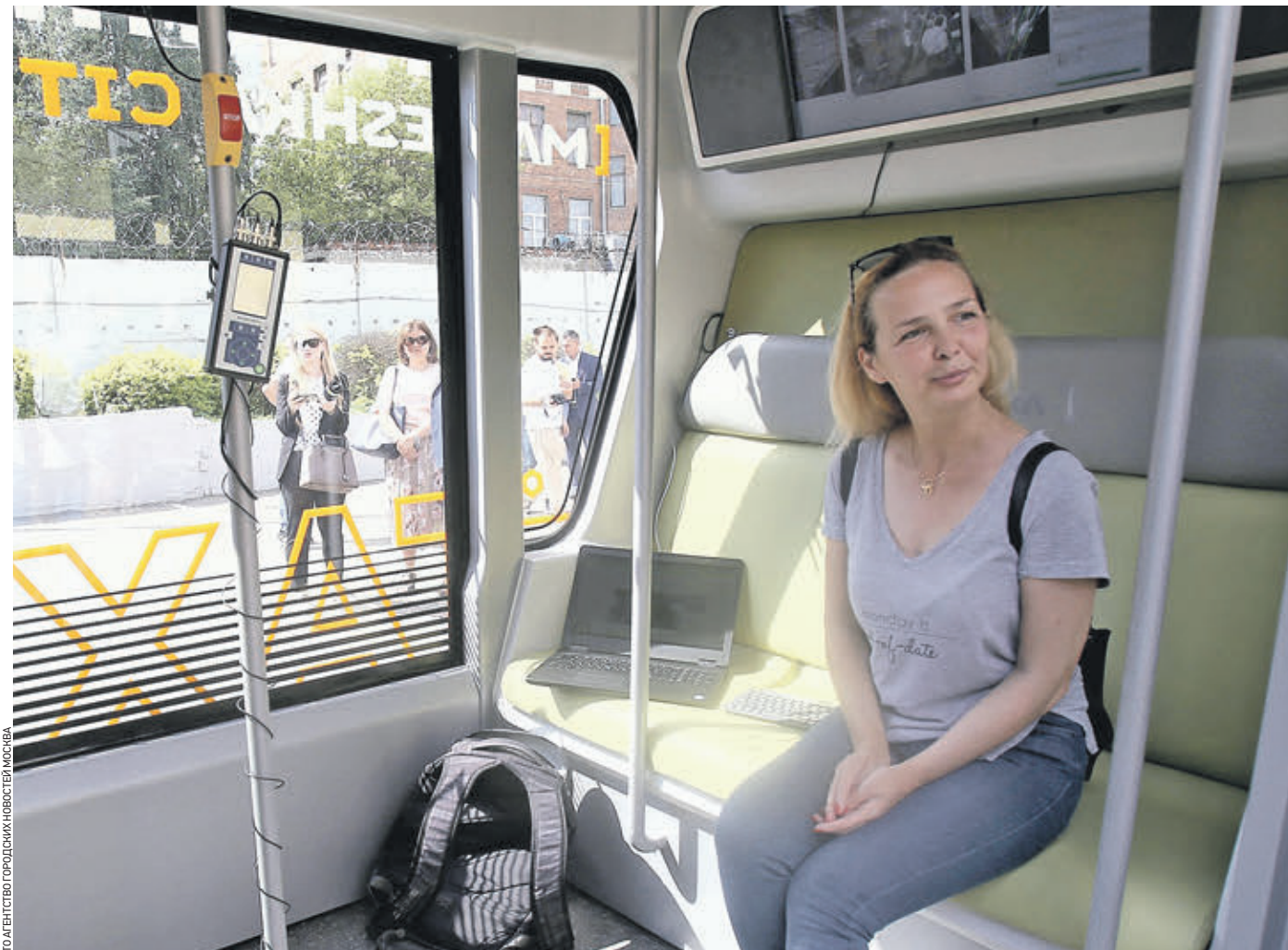
17 августа 2017 года. Москвичка сидит в салоне беспилотного такси во время презентации нового вида транспорта в технопарке «Налибр»