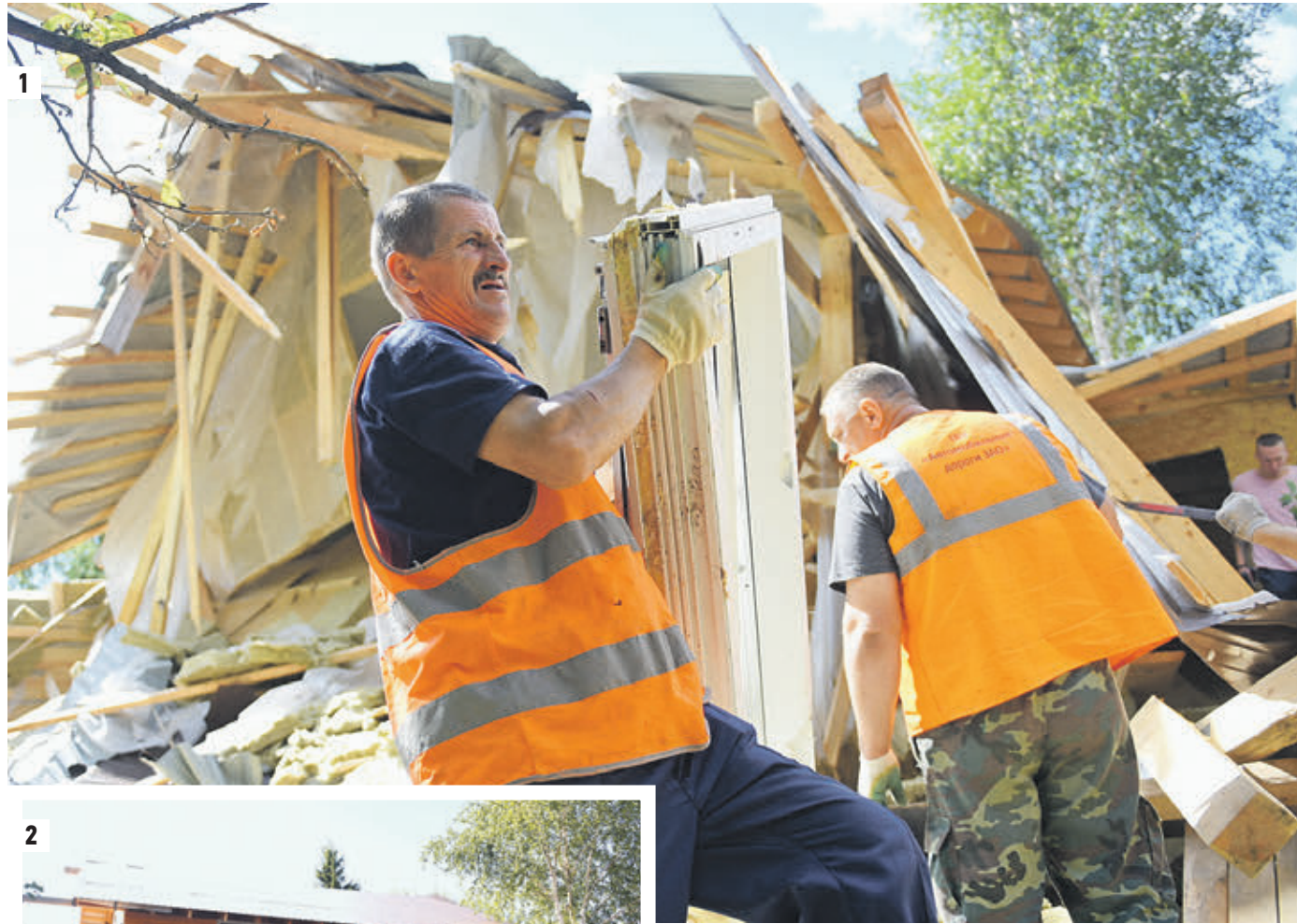
1 Вчера 14:30 Рабочие выносят с территории участка образования мусора (1) Так выглядел самострой на улице Чехова, дом № 2, в Толстопальцево до приезда экскаватора (2)

— Хозяин участка в прошлом году нагнал людей, они живой цепью встали. Их полицией пришлось отгонять. Шуму было, криков. А сейчас