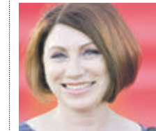
РОЗА СЯБИТОВА СВАХА

Ответственность за старение браков во многом лежит на массовой культуре, рекламе и пропагандируемых ей ценностях. В частности, на это влияет использование страха смерти и секса как стимула к потреблению. Регулярно с экранов телевизоров на нас сыплются сообщения о трагедиях и их жертвах, сменяющиеся показом женских прелестей. На подознание эти явления воздействуют практически одинаково, возбуждая желание жить и потреблять. Естественно, что это желание «брать от жизни» все отрицательно влияет от приталкивает молодежь от принятия серьезных решений.