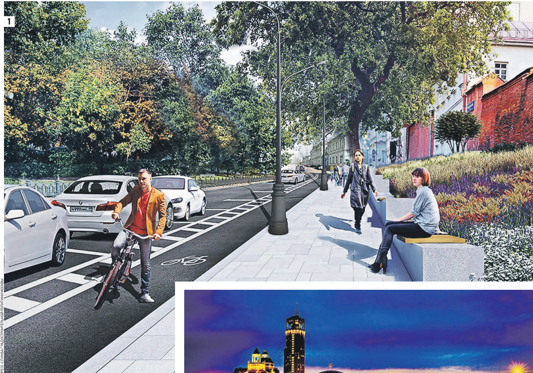
Проект реконструкции Рождественского бульвара сделает излюбленный москвичами маршрут прогулок по Бульварному кольцу светлее и комфортнее (1) Вечерняя подсветка архитектурных комплексов — предмет гордости жителей столицы. Вид на Московский международный дом музыки с Краснохолмской набережной (2)

Можно возразить: краснодарским властям стоило бы позаботиться о подьеме местного бизнеса (как, к слову, в Москве) и росте налоговой базы, а не отпугивать курортников, которых вообще надо встречать цветами. Но наши чиновники — люди из такого теста, что им проще сочинить строгий закон. И все-таки мне кажется, что пока Москве следует жить скромнее, с оглядкой на другие города России. У нас общая страна и общий бюджет. И в единой стране не бывает праздника только на одной улице.