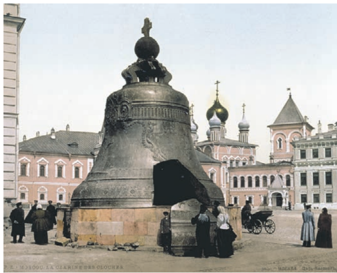
1890 год. Царь-колокол на Ивановской площади. Особый интерес горожан вызывает гигантский осколок изделия

— Указ о его создании по воле императрицы Анны Иоанновны вышел в 1730 году, но на самом деле история эта началась намного раньше, — рассказывает Вардан Багдасарян. — Колокола-тысячники, которые весили по тысяче пудов каждый, начали появляться в России в XVI веке. Первый в 1600 году отлит тот же мастер, что создал и Царь-пушку — Андрей Чохов. Однако этот памятник литейного дела до наших дней, увы, не сохранился — упал и разбился при пожаре. Вторую по-