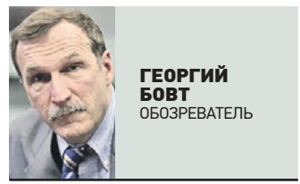
ГЕОРГИЙ БОБТ ОБОЗРЕВАТЕЛЬ