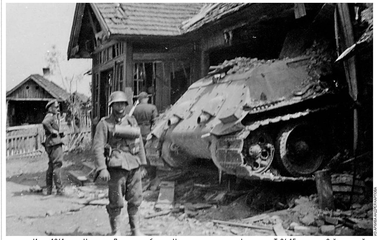
Июнь 1941 года. Немиров, Львовская область. Немецкие солдаты на фоне танка Т-34 15-го полка 8-й танковой дивизии, застрявшего в одном из домов. Судьба экипажа неизвестна

На Руси до XVI века добывали речной жемчуг даже в Москве-реке. Им расширяли одежду, женские головные уборы, сначтерти, церковные покрывала. Обрамляли оклады икон. Русский жемчуг экспортировался в Европу, где он ценился выше даже более крупного морского. Добывали жемчуг артелями. На его добычу требовалось разрешение от властей. Иначе — острог. Добывали его интересным способом. В небольшой плотик вставляли деревянную трубу и через нее осматривали дно, нан в подводный перескоп. Заметив мидии, поднимали их специальными щипцами. За день артель из трех-четырёх работников добывала 4–5 жемчужин, вылавив более тысячи моллюсков. Со временем мода на русский речной жемчуг прошла.