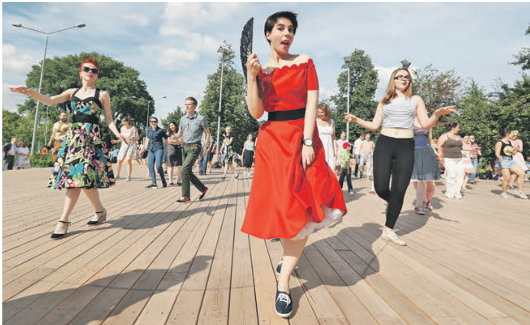
16 июля 2017 года 18:22 Урок танца на центральной аллее в Парке Горького, где москвичи и гости столицы под руководством опытных инструкторов изучают основные элементы акробатического рок-н-ролла и буги-вуги