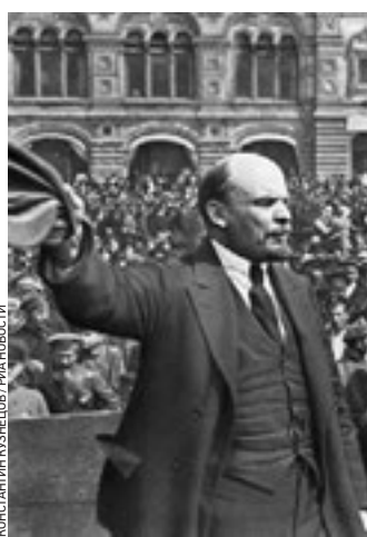
25 мая 1919 года. Во вторую годовщину создания войск Всевобуча Ленин произносит речь на Красной площади