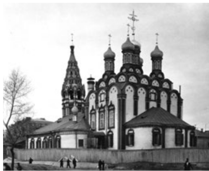
1958 год. Храм Николая Чудотворца в Хамовниках

— Хамовники — район уникальный, здесь сосредоточено огромное количество памятников культурного и исторического наследия, например, Музей изобразительных искусств им. Пушкина, Галерея Церетели, — рассказывает москвовед Геннадий Николаев. — Район получил свое название от слова «хам», в те времена это не было ругательством, так называли льняное полотно. Как можно догадаться, на этих территориях жили ткачи, которых переселили из деревни Константиновки.