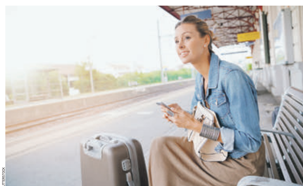
11 июня 2017 года. Туристка из Москвы ожидает поезд на железнодорожной станции. Сегодня путешествия по России сопряжены с большими тратами на мобильную связь