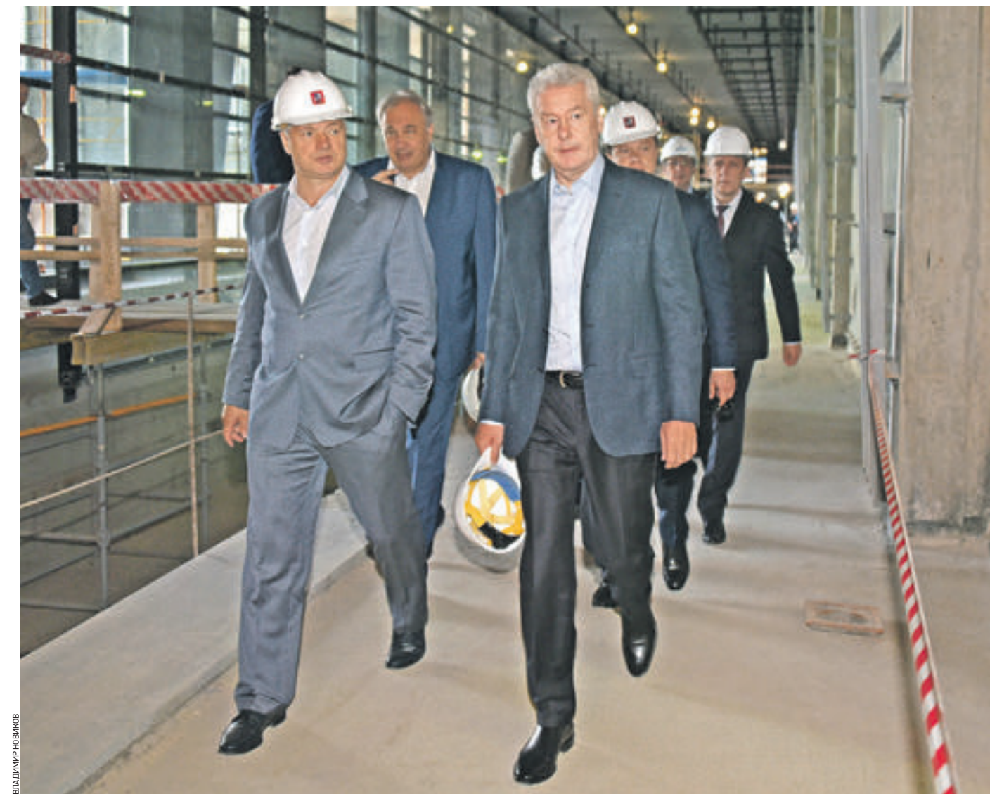
Вчера 11:05 Мэр Москвы Сергей Собянин (справа) и заместитель мэра Москвы по вопросам градостроительной политики и строительства Марат Хуснуллин (слева), а также представители компаний генподрядчика и подрядчика (на втором плане) осмотрели ход работ на первой полуподземной станции московского метро «Мичуринский проспект». Две трети от объема уже выполнено

— Линию ждут сотни тысяч москвичей, в особенности жители Солнцева и Новопеределкина, — продолжил мэр. Изюминкой ветки будет как раз «Мичуринский проспект».