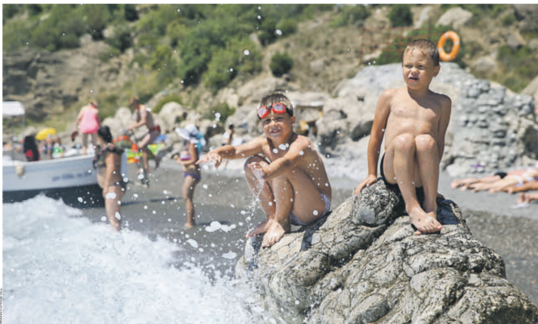
3 июля 2014 года. Крым. Ребята проводят летние каникулы на пляже Черного моря. В том же году территории Крыма и Севастополя присоединили к России. На крымских курортах отмечали небывалый приток туристов, как иностранцев, так и жителей других регионов страны

Когда осенью 2015 года практически за один месяц закрыли для туризма Египет и Турцию, столичные путешественники испытали отчасти вынужденный «прилив патриотизма». Одни из интереса, другие — от отсутствия альтернативы, но тысячи отдыхающих отправились на российские курорты. Экс-министр туризма и олимпийского наследия Краснодарского края Евгений Куделя прошлым летом констатировал, что «черноморские курорты работают на пределах своих возможностей». Поток приезжих в два-три раза превышал возможности принимающей стороны. На фоне этого «подарка» российские туристической сфере эксперты ожидали резкого подъема отрасли и популяризации отечественных туристических зон. Однако с налаживанием международной обстановки Турция вновь открыла свой дружелюбный «ол инклюзив». И российские юга возвращаются такого масштаба просто не выдержали. По данным Российского союза туристической индустрии, падение организованного потока путешественников в Краснодарский край за текущий сезон составляет 25 процентов. И это не считая тех, кто предпочитает отдыхать «дикарем». Турция вернулась на рынок с привлекательными предложениями: 18–20 тысяч рублей в пятизвездочном отеле на двоих. Конкурировать с такими цифрами просто невозможно. Ведь, по подсчетам специалистов, на организованную поездку по России москвичам путешественникам придется потратить от 40 тысяч рублей с человека. — Не только Турция составляет конкуренцию отечественным курортам, — рассказывает коммерческий директор од-