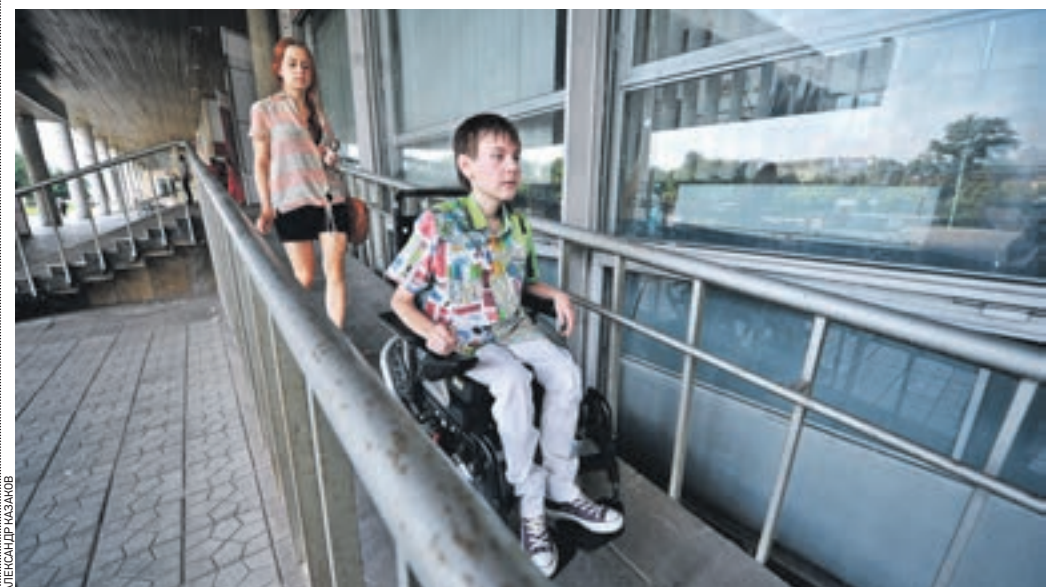
За шесть лет, что проходит смотр-конкурс «Город для всех», количество оборудованных «безбарьерной средой» объектов в Москве значительно увеличилось

В конкурсе — дело добровольное. Сначала организации и учреждения, которые изъявили желание принять в нем участие, подают заявку-презентацию. Рабочая группа выезжает на места, смотрит, все ли сделано, если необходимо — предлагает доработать, например, если где-то не покрашены ступеньки для слабых людей или нет тренирующей кнопки... В этом году в номинации «Дворовые территории» поступило 11 заявок, 9 из них вышли в полуфинал. Одну заявку отклонили по причине того, что установленные скамейки были без поручней, а для людей с опорно-двигательными проблемами это важно. Что касается жилых домов, то здесь проблема, и не только нашего округа, а всего города, в том, что старые дома зачастую просто невозможно приспособить под нужды инвалидов. Тем не менее у нас было шесть заявок в этой номинации, и все они прошли во второй этап. Из объектов здравоохранения участвовала поликлиника № 180, расположенная в Митине, — очень достой-