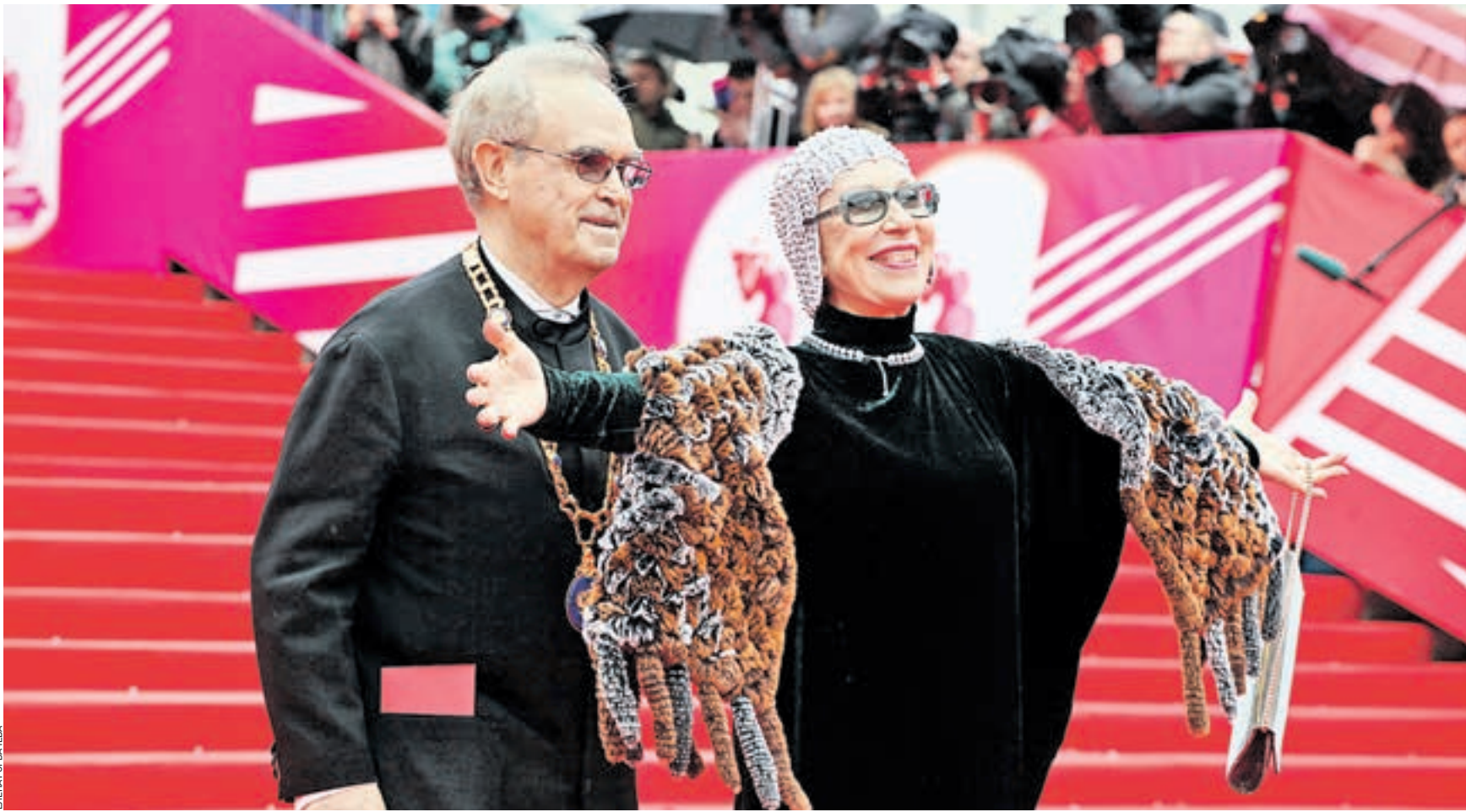
29 июня 2014 года 10:14 Режиссер Глеб Панфилов со своей супругой актрисой Инной Чуриковой на церемонии закрытия 36-го Московского международного кинофестиваля. «Царская» роль в постановке Панфилова для Чуриковой станет не первой — в 2010 году в ленкомовской «Аквитанской львице» она сыграла королеву Алиенору, жену Генриха II.

ТЕАТР Глеб Панфилов приступил в «Ленком» к постановке пьесы Питера Моргана «Аудиенция». В разговоре с «ВМ» он объяснил, почему обратился к материалу о Елизавете Второй.