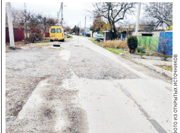
Улицы Победы в Невинномысске.

Народ откликнулся по-разному. В том числе назвали позицию местных властей «закономерным результатом деградации управленческой системы». Градоначальник ответил, что это попытка политизировать техническую проблему. Ну и в завершение, как водится, перевел стрелки: «Хватит уже скулить, какие-то тепличные мы стали. Поедьте в Шебекино, посмотрите, как они там без света живут...»