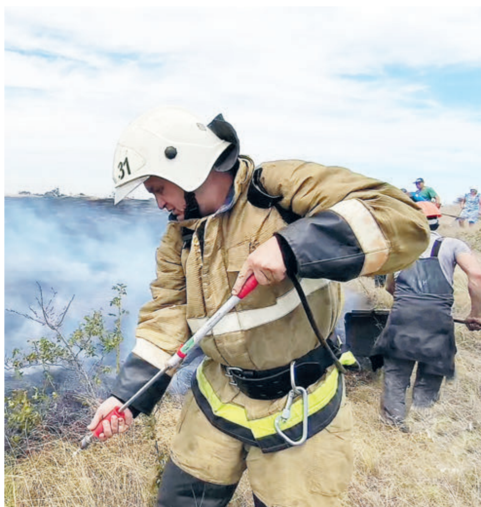
Крымские пожарные без работы не остаются.

Но без самолетов деньги теряются десятками миллиардов. Три года назад пожар между поселками Большой и Малый Утриш в окрестностях Анапы тушили больше двух суток. За это время сгорели 126 гектаров леса, в том числе уникального – можжевелово-фисташкового. Возраст этих реликтовых растений доходил до 900 лет, и ущерб от одного пожара для этой уникальной природной территории оценили тогда в миллиард рублей. Нынешние пожары