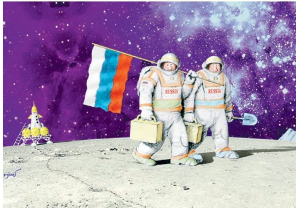
ИЛЛУСТРАЦИЯ АЛЕКСАНДРА СЕФЕЕВА/CARTOONBANK.RU