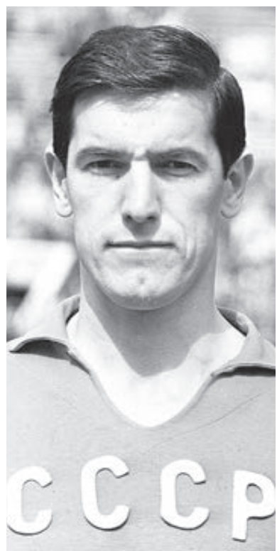
ФОТО ВРНЕСТАВА УН ДА-СИННА

Летом 1967-го Воронину исполнилось всего 28 лет. По нынешним футбольным меркам, пик карьеры. Но... Читаем заметку в «Труде». Знаменитый спортивный журналист Юрий Ванят рассказывает о четвертьфинальном