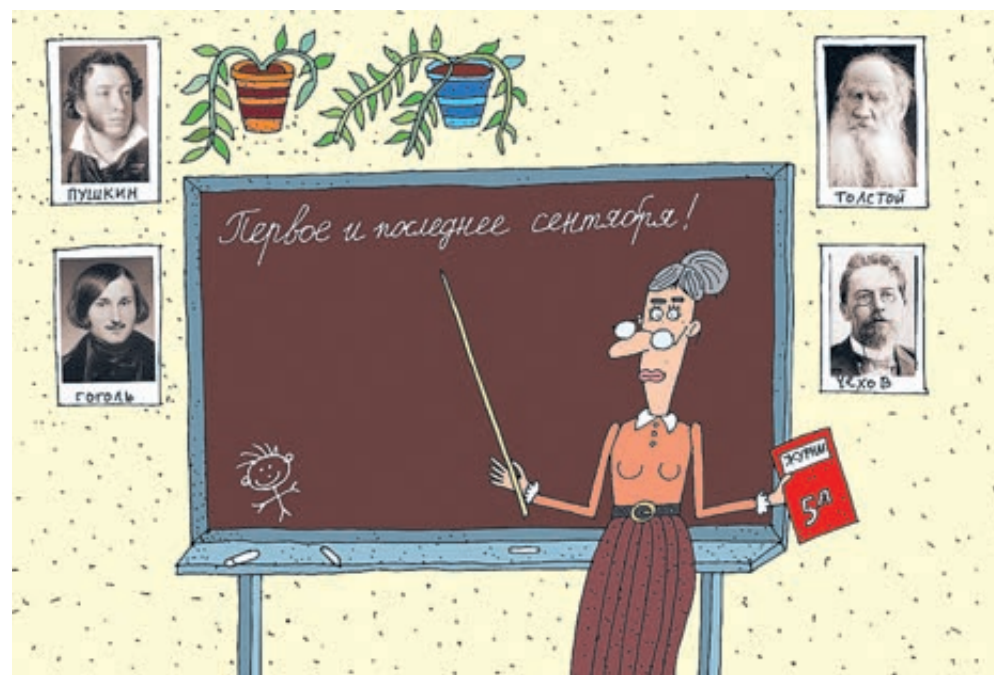
ИЛЛЮСТРАЦИЯ СЕРГЕЯ БЕЛОЗЕРОВА / CARTOONBANK.RU

Сначала Дмитрий Анатольевич доложил семи чиновникам, присутствующим в зале, и 85 участвующим в режиме видеоконференции губернаторам или их замам, что в сентябре за парты сядет 15,5 млн школьников – почти на миллион больше, чем год назад, а первоклассников –