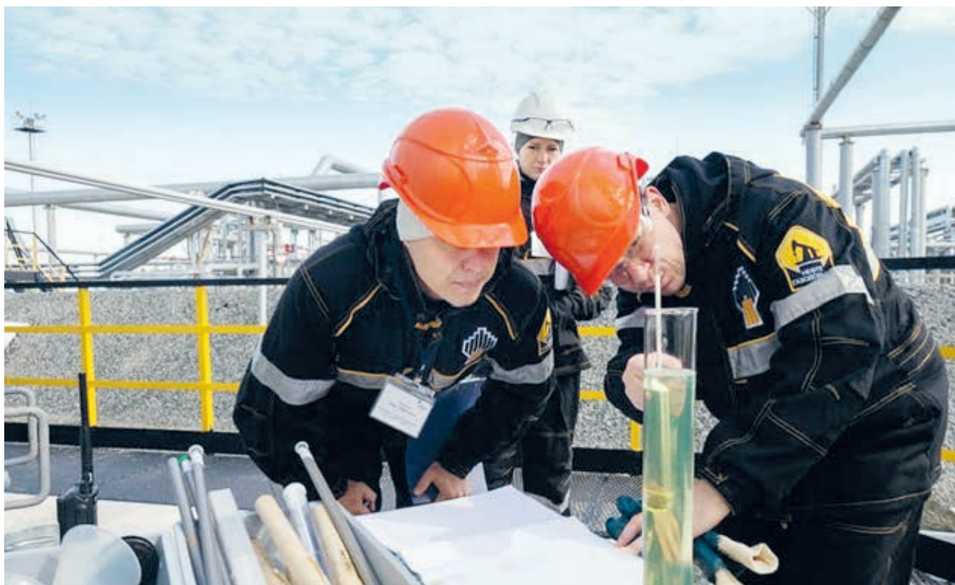
АО «РОСПАН ИНТЕРНЭШНЛ» и ООО «Таас-Юрях Нефтегазодобыча» – одни из самых перспективных активов Роснефти.

В таких же условиях осваивает нефтегазовые кладовые Ямало-Ненецкого округа еще одна «дочка» «Роснефти» – компания «Роспан Интернешнл», ее «сестра» – компания «Сибнефтегаз» и еще одна «сестра» – «Тюменнефтегаз». Природные условия похожи на якутские: в ветреном феврале погоду удобнее мерить термометром, родившимся в Антарктиде: к градусам мороза прибавлять удвоенную скорость ветра – получается жесткость в баллах. Если жесткость переходит 50-балльную отметку, на промысле объявляется «активировка» –