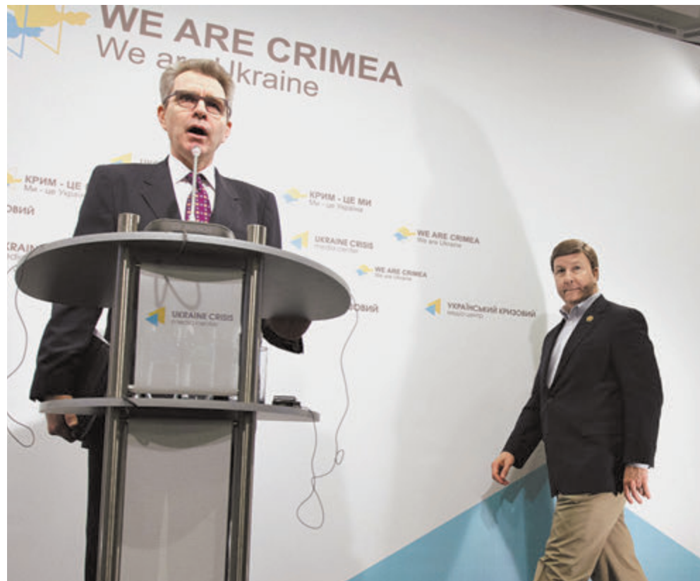
Джеффри Пайетт говорит – Киев выполняет.

Пожоже, обе враждующие стороны решили сполна воспользоваться передышкой, чтобы укрепить ряды, повысить управляемость и подойти к следующей фазе конфликта во всеоружии. Но это лишь то, что лежит на поверхности. А если копнуть, станет ясно и другое: государственное строительство на Украине идет чужими руками и под чужим руководством. То, что простиительно молодых республикам, в украинском случае выглядит просто вызывающе.