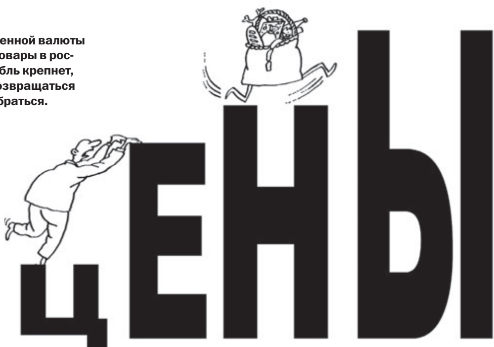
ИЛЛЮСТРАЦИЯ ЛЕОНИДА МЕЛЬНИКА/СЕРГЕЕВАНИК.РУ

Особенно резво дорожает продовольствие, включая, опять же, отечественное. По данным Минсельхоза РФ, оптовые цены на капусту в нынешнем году выросли на 66%, лук подорожал на 40,5%, картофель – на 36,6%, морковь – на 31,9%, яблоки – на 34,5%. Прибавьте сюда розничную наценку – и получите удвоение цен на самое необходимое. Федеральная антимонопольная служба фикси-