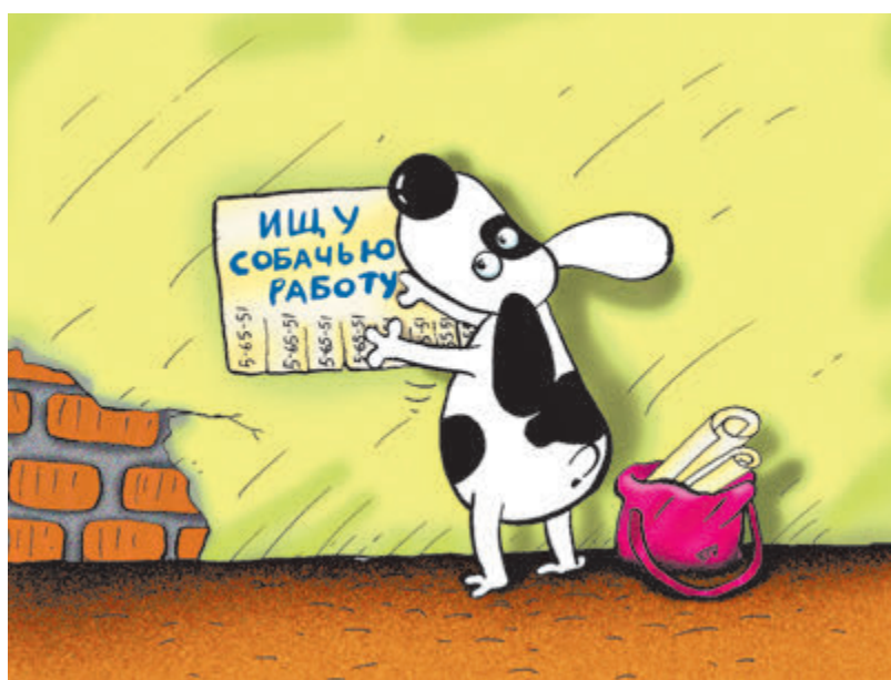
Иллюстрация Сергея Соколов/CARTOONBANK.RU

Однако правительство мониторинг в основном «официальных» безработных. Тут картина не столь тревожная: их число се-