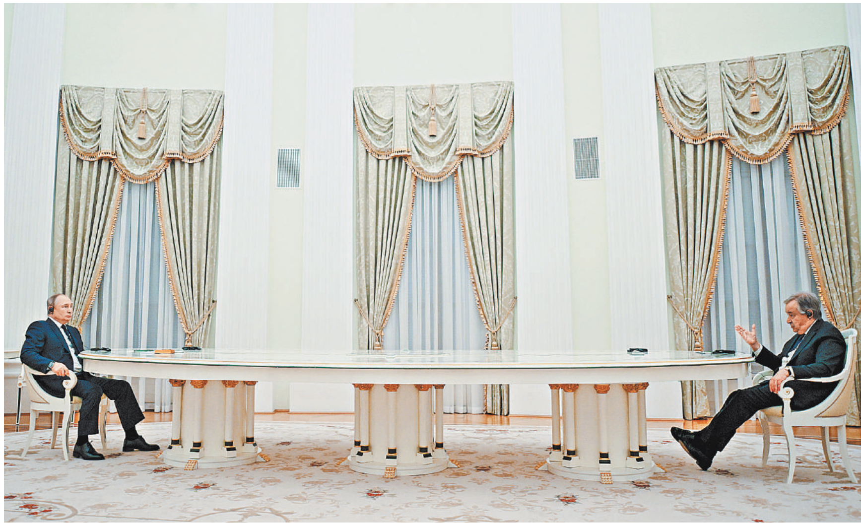
ВЛАДИМИР ПУТИН