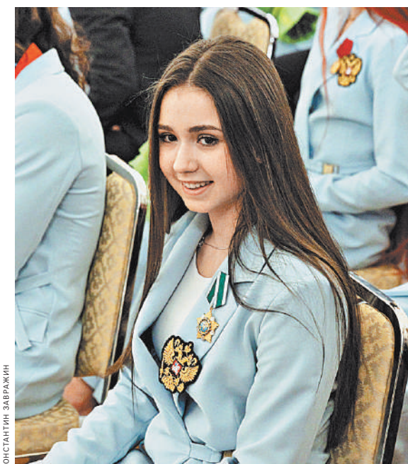
Камилла Валиева орден Дружбы из рук президента получила в день своего 16-летия.

Путин осудил решение отстранить от соревнования двукратного олимпийского чемпиона Евгения Рылова. «Международная федерация плавания на девять месяцев отстранила его от соревнований только лишь за присутствие на концерте, посвященном годовщине воссоединения России и Крыма. Просто довели дело до полного абсурда», — отметил он. Путин при этом подчеркнул, что для России в спорте нет недрожественных стран. «Мы рады принимать всех, кто выступает за спорт без дискриминации и искусственных ограничений, за его идеалы — идеалы справедливости, равенства и честной борьбы», — сказал он. По словам президента, трудности только помогают стать России сильнее. ●