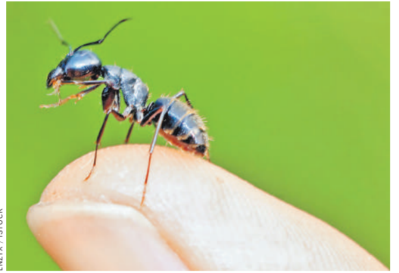
Чтобы научить муравья диагностировать рак, ученым потребовалось всего несколько дней.

Значает ли это, что скоро в лабораториях вместо МРТ, УЗИ, ПЭТ за диагностику возьмутся армии муравьев? Вряд ли. Ученые представили предварительные результаты, но им еще предстоит провести множество дополнительных тестов.