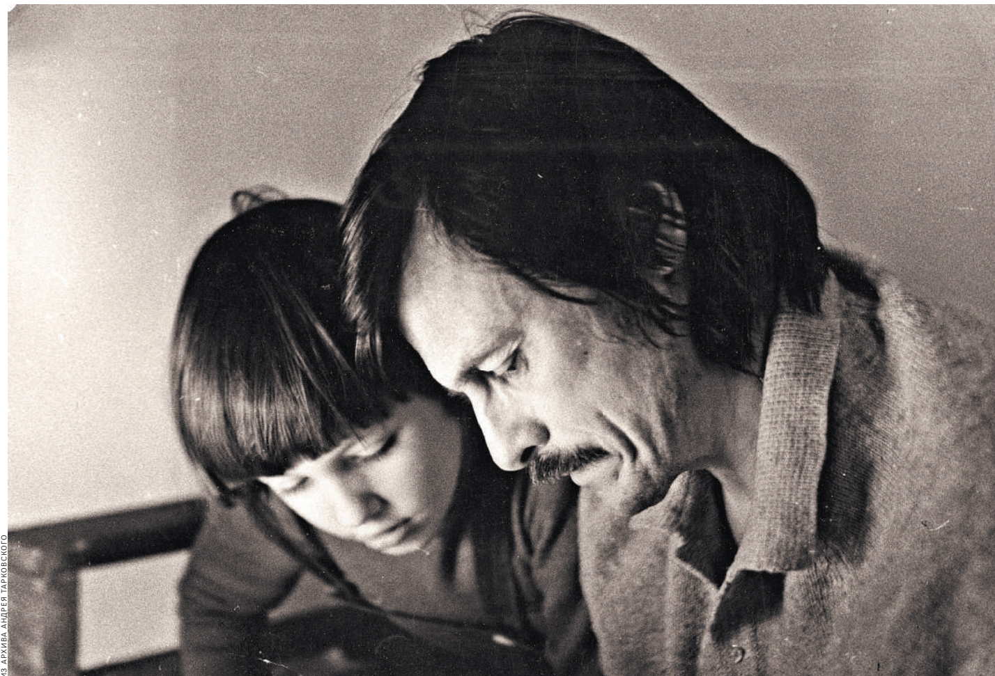
Тот самый снимок.