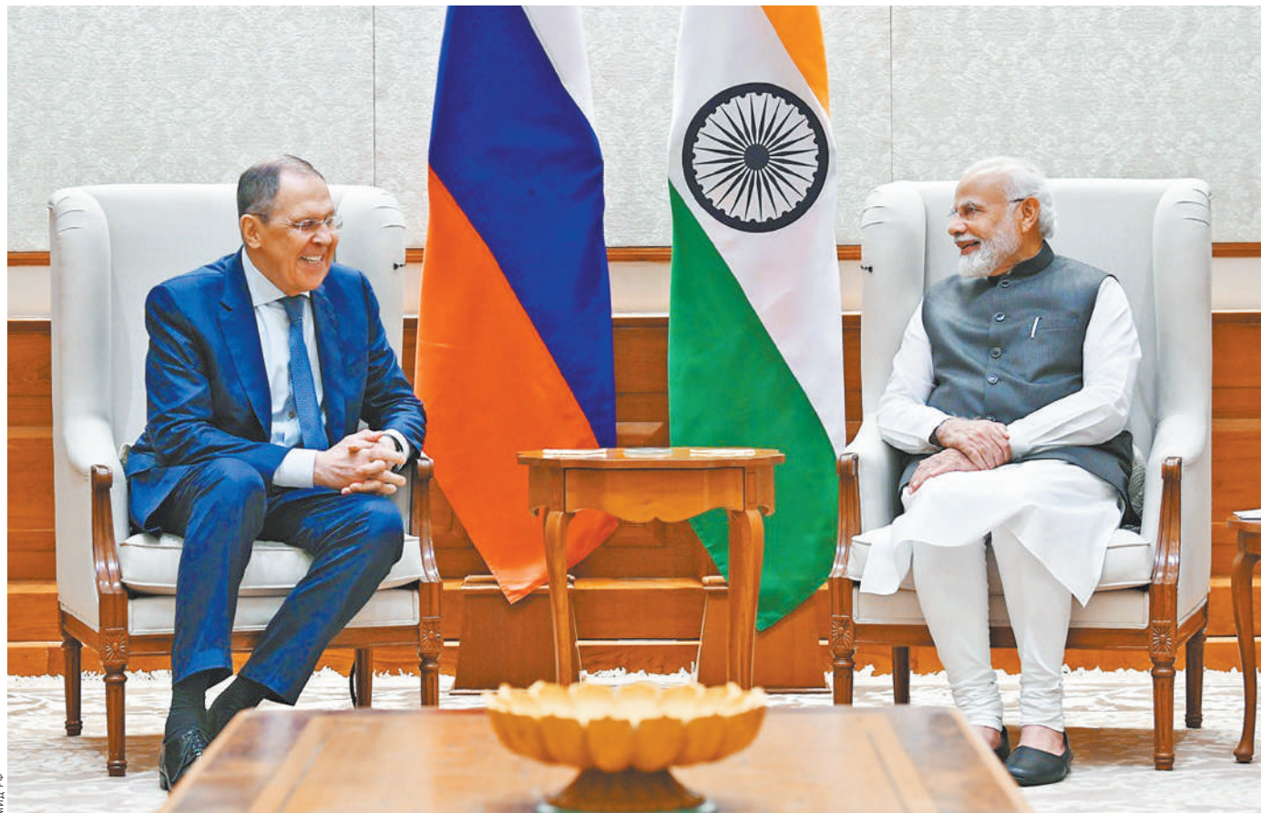
С главой МИД России Сергеем Лавровым в Нью-Дели встретился премьер Индии Нарендра Моди.

Федеральный канцлер предложил украинскому лиде-