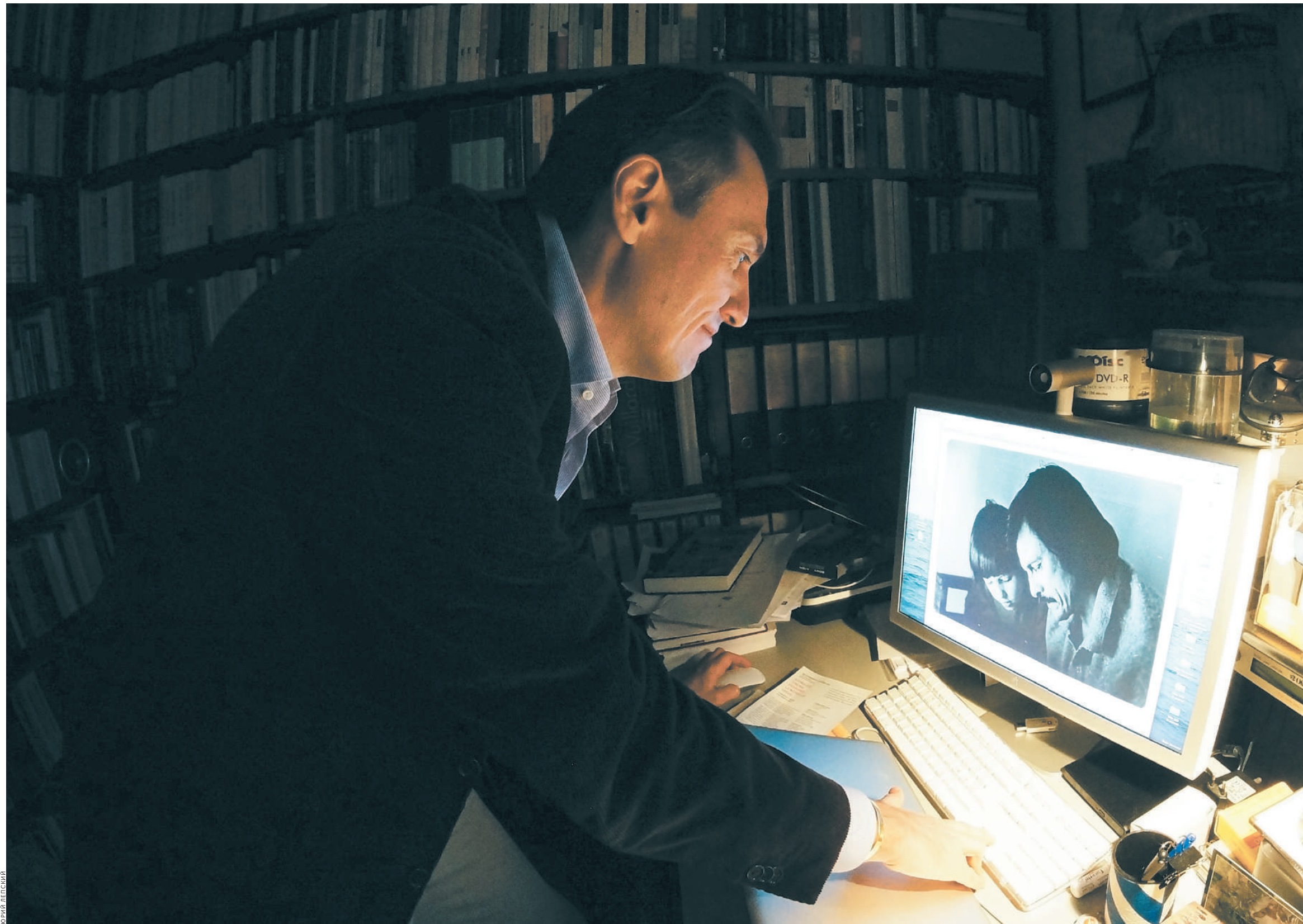
Андрей Андреевич Тарковский: зеркало для сына.