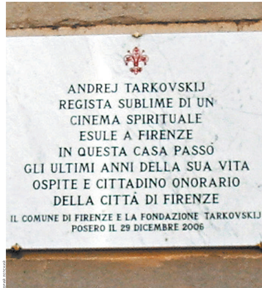
Мемориальная доска на доме Тарковского во Флоренции.