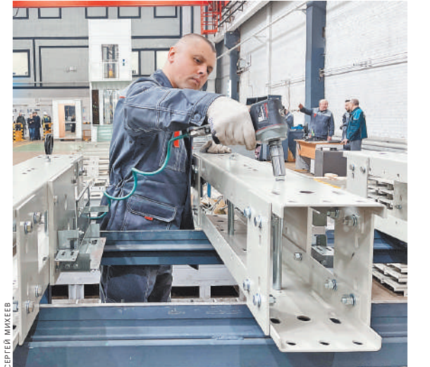
Столичные власти гарантировали поддержку предприятиям в условиях зарубежного санкционного давления.

За счет отказа от лишних данных можно было бы сократить размеры бумажных чеков, сэкономив таким образом десятки другой миллиардов, считает Шелищ. ●