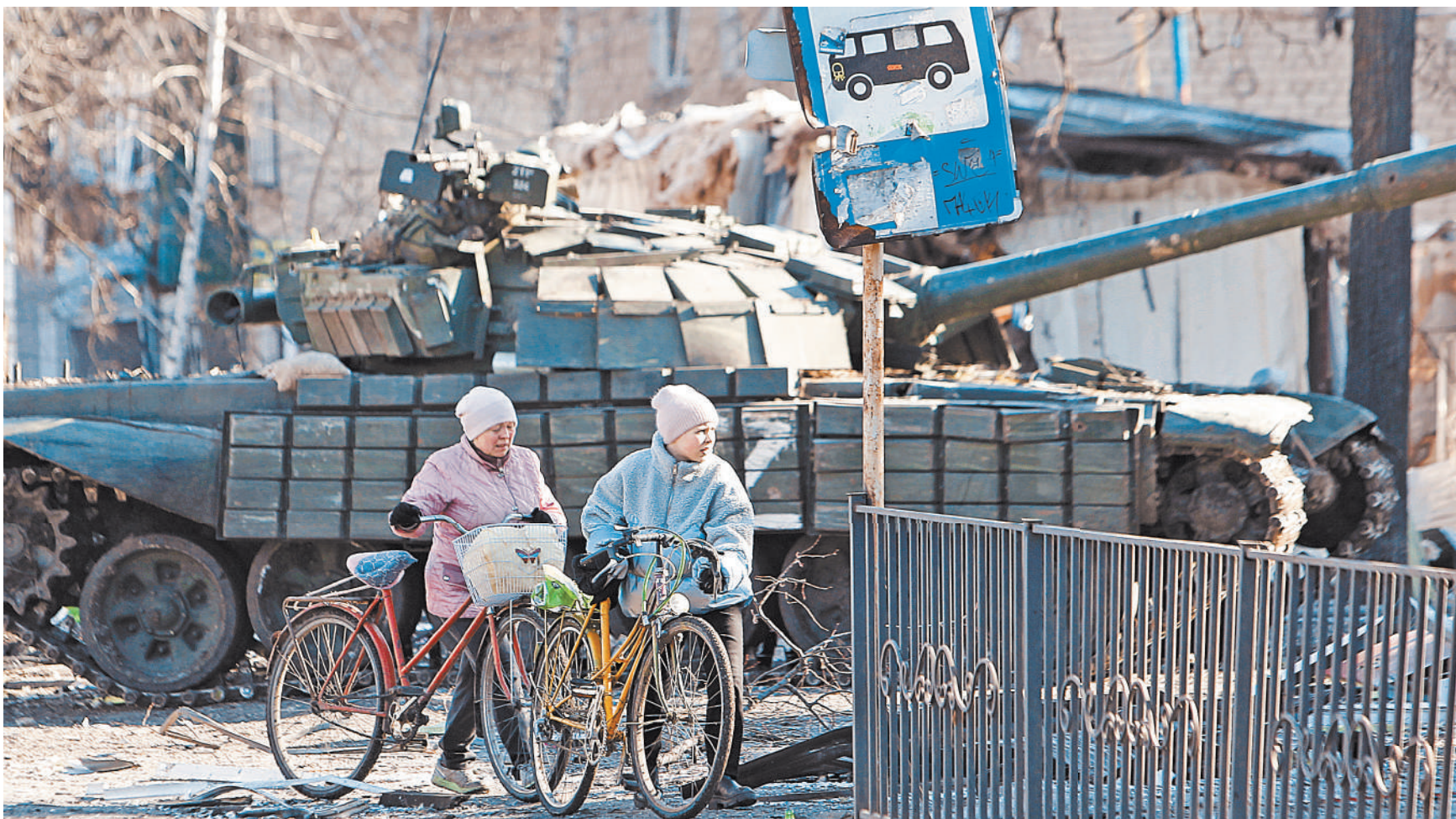
Такое оно, возвращение домой.