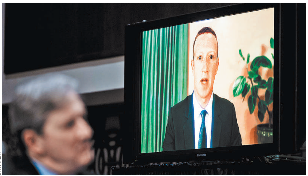
Конгрессмены США в 2020 году вызывали Цукерберга «на ковер» и требовали ограничить в его соцсети призывы к дискриминации и насилию. Но теперь когда Meta разрешила призывать к насилию против русских, конгресс демонстративно безмолвствует.

Соцсеть Facebook в последние годы стала эпицентром скандалов вокруг IT-индустрии. Претензии к ней выдвигались самые разные, но в их основе — растущее беспокойство американской политической элиты тем огромным и продолжающим расти влиянием, которое приобретают крупные IT-компании, владеющие различ-