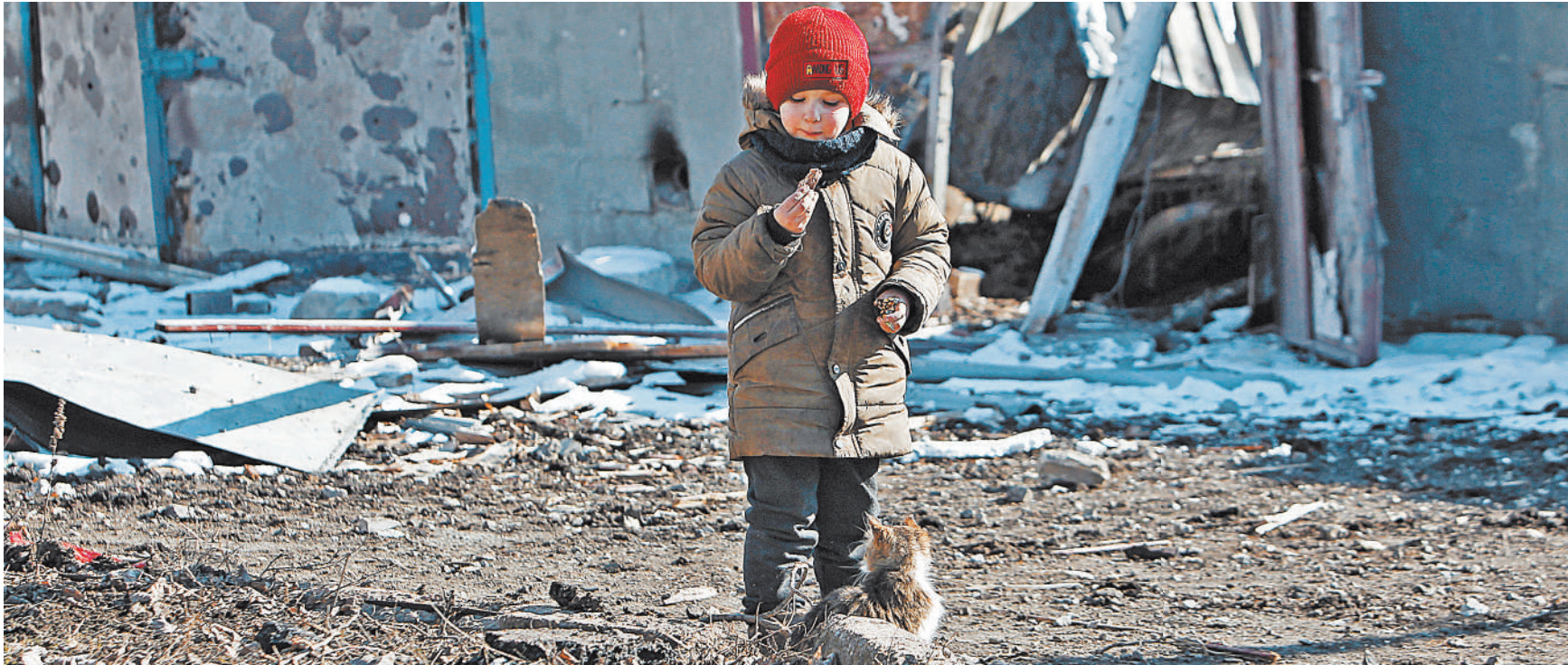
Развалины и смерть — это все, что видел малыш в своей жизни.

Между домами ходят редкие местные жители. Они рискнули покинуть убежища в подвалах, лишь когда город покинули украинские войска и в Волноваху вошли ополченцы. Возле подъездов на костре соседи готовят пищу. Нехитрую похлебку в большой кастрюле варят сразу на несколько семей. До прихода ополченцев жители города кое-как продержались на своих запасах. Теперь им с продуктами помогают бойцы ДНР.