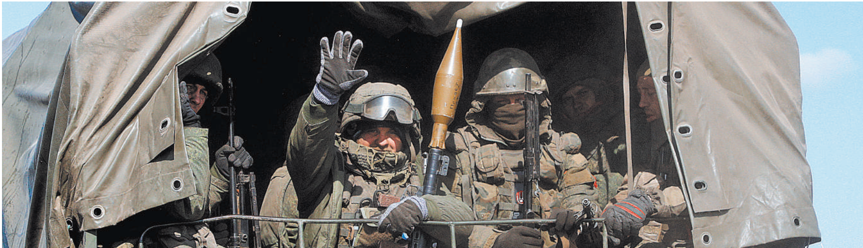
Наконец-то пришли наши.