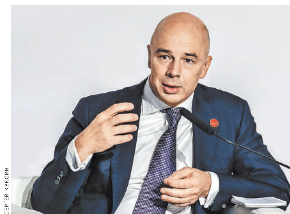
Антон Силуанов: Россия не отказывается от выполнения своих обязательств.

Министр также напомнил, что часть российских золотовалютных резервов находится в юанях. По словам Силуанова, Запад пытается добиться от Китая, чтобы он также ограничил доступ России к своей валюте.