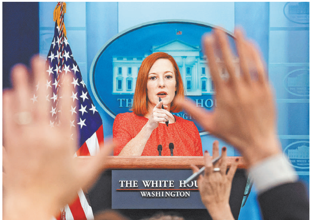
Дженнифер Псаки научилась объяснять самые противоречивые заявления президента США.

Так выглядят «стремление к дипломатии» по-американски. Хотя Россия добивается от Запада разговора о евробезопасности, Вашингтон с самого начала пытался сводить весь разговор к Украине.