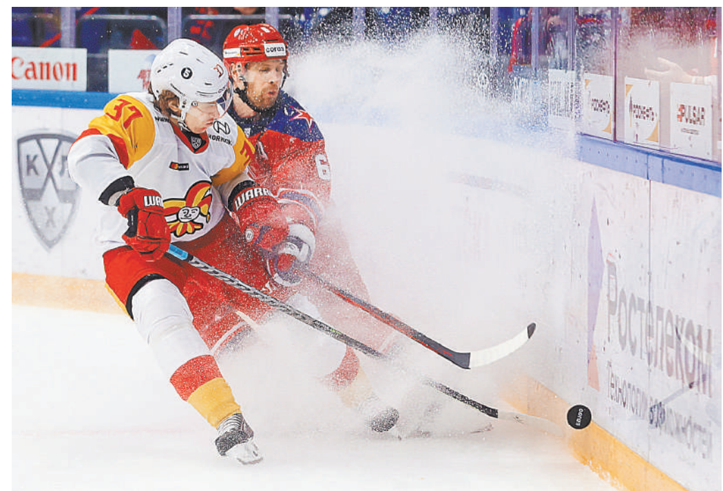
Согласно заявлению «Йокерита», хоккеисты клуба продолжают выступать в КХЛ.

Продолжение игр нанесет неисчислимый ущерб репутации всего клуба, которая, возможно, никогда больше не будет восстановлена.