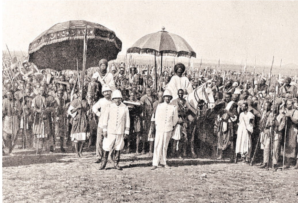
В Камеруне французские колониальные офицеры встречаются с местным руководством (1915 год).

Последовали информационные вбросы через франкофонские и англоязычные СМИ и неправительственные организации о якобы нарушающих права человека российских военных советниках в Африке, звучат обоснованные обвинения с трибун ООН о злоупотре-