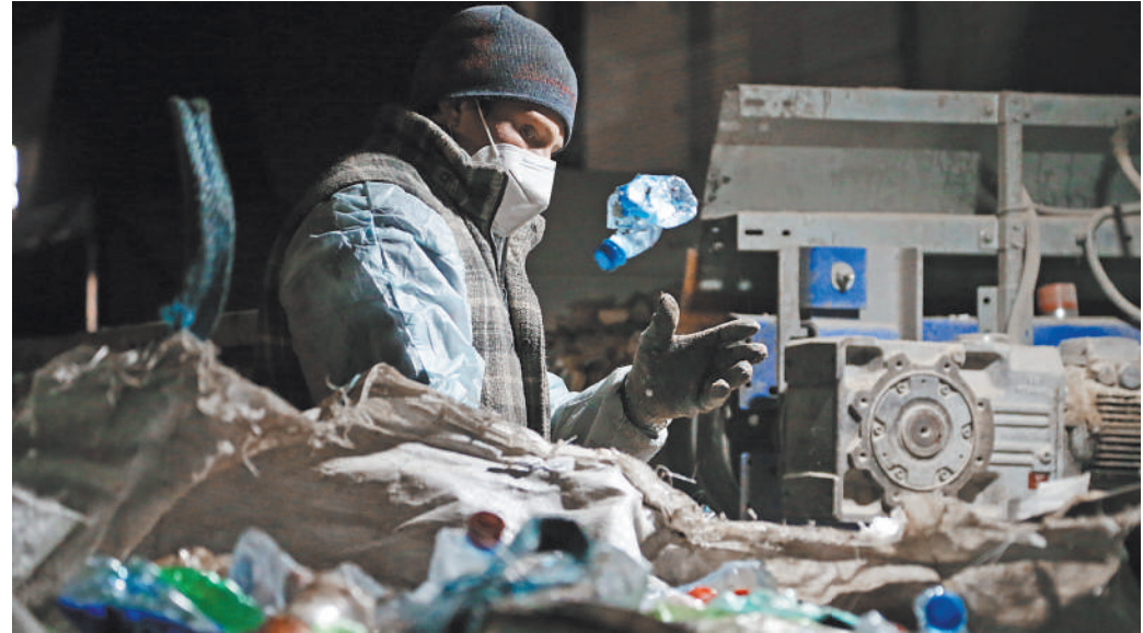
Пункт сортировки отходов компании «ЭкоЛайн» в Москве.