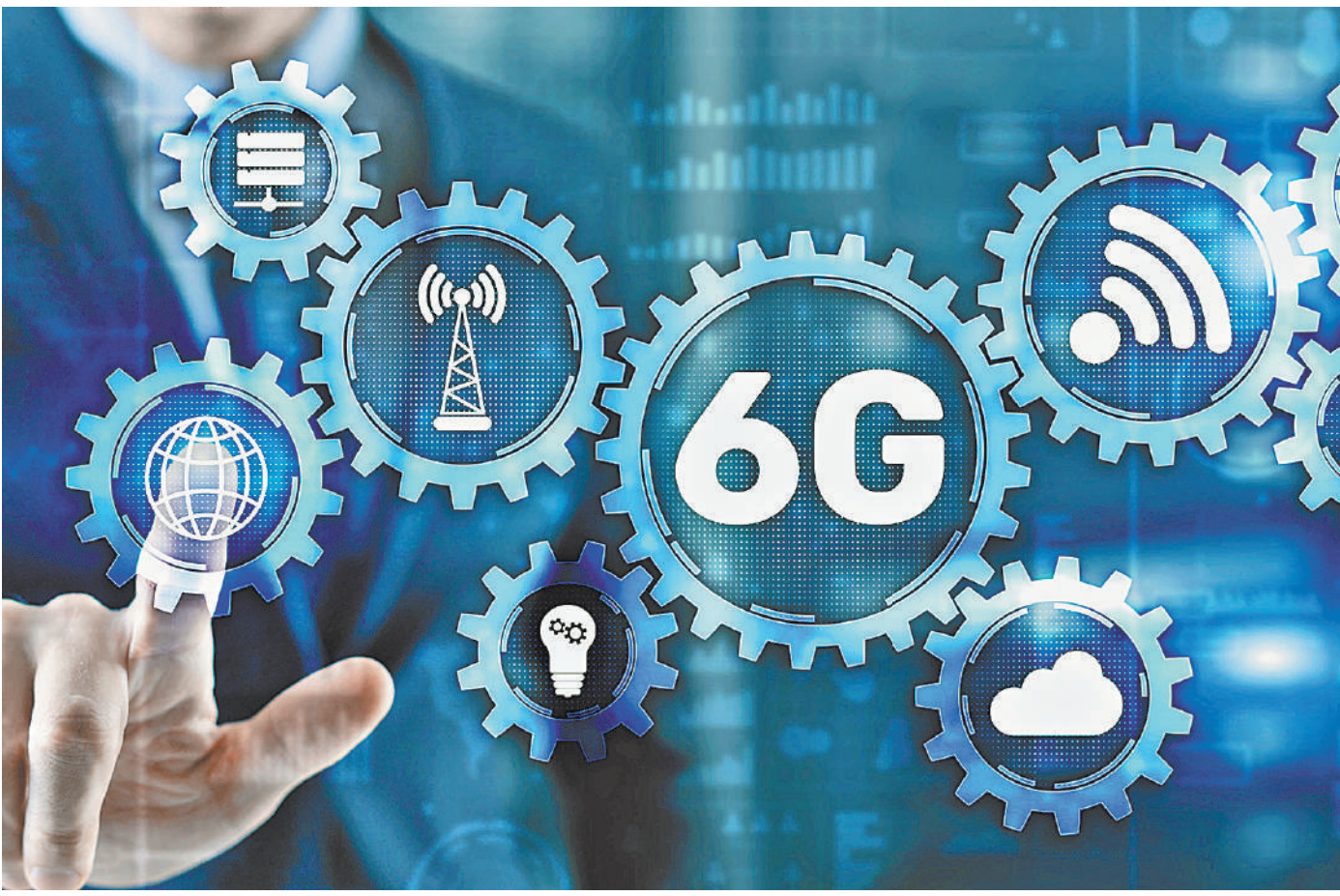
Центр компетенций НТИ при Сколковском институте науки и технологий (Сколтехе) ведет перспективные разработки по технологиям беспроводной связи и «интернета вещей».

Нацпроект «Культура» включает в себя три федеральных проекта—«Культурная среда», «Цифровая культура» и «Творческие люди».