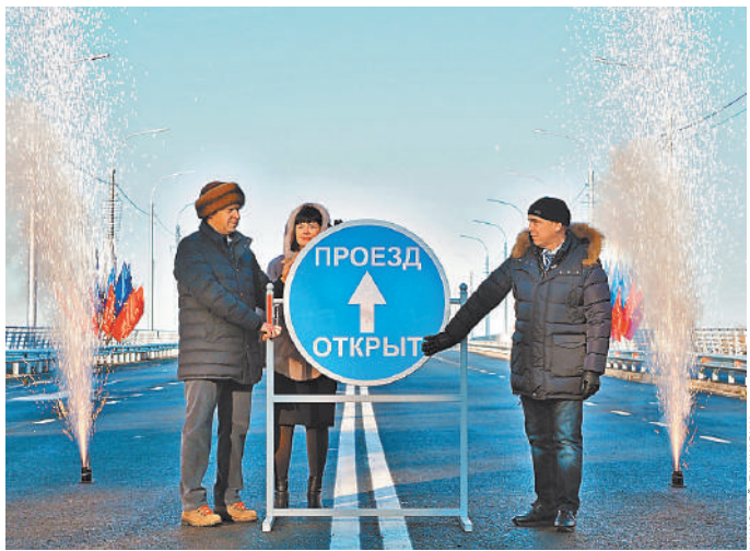
В Кургане открыли мост. Жители города ждали этого события два года.

6 ТЫСЯЧ дорожных объектов приведут к нормативу в 84 регионах в рамках нацпроекта «Безопасные качественные дороги»