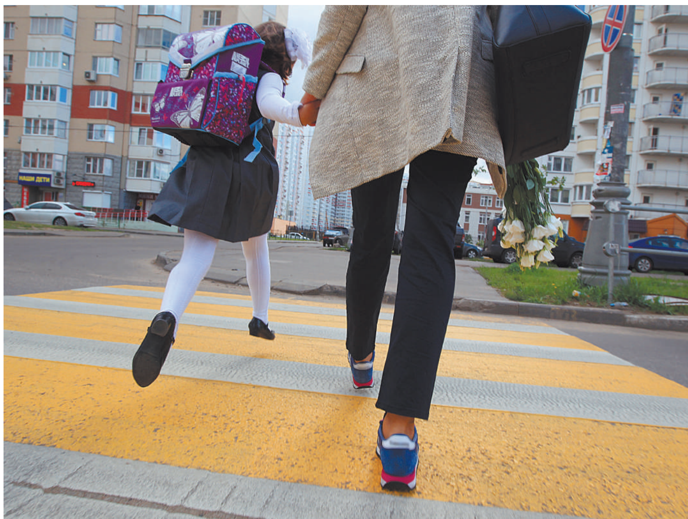
Для ребенка главный авторитет — его родители. Поэтому они должны объяснять, как правильно переходить дорогу.