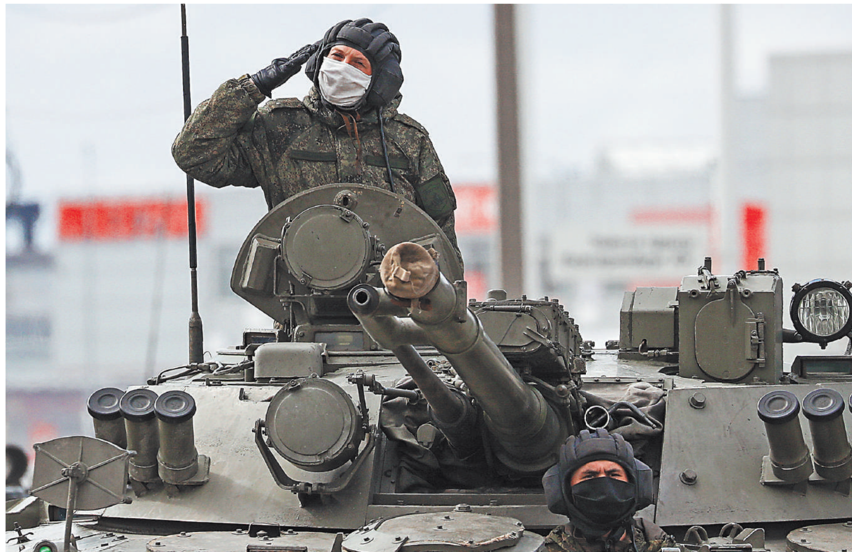
Военная форма в период пандемии коронавируса несколько отличается от повседневной. Расчет БМП-3 на репетиции парада в честь 75-й годовщины Победы в Великой Отечественной войне, прошедшей вчера в Екатеринбурге, наглядно это продемонстрировал. На механике-водителе и на командире машины были маски, никаким уставом не предусмотренные, к тому же эти защитные элементы экипировки были разного цвета. Впрочем, вряд ли бойцов накажут за эту вольность. Здоровье личного состава все-таки важнее уставов.