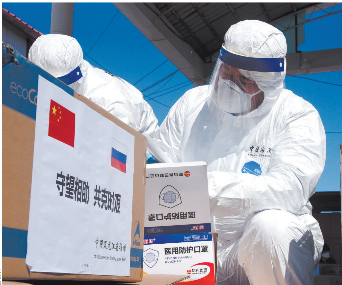
2 апреля на таможне Хэйхэ была быстро оформлена гуманитарная помощь, которую провинция Хэйлунцзян отправила в Россию.