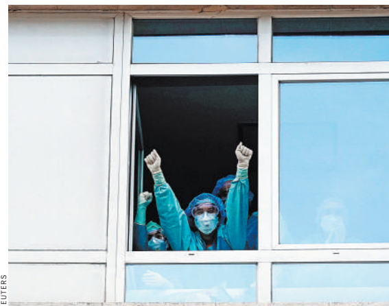
Врачи больницы «Фонд Хименеса Диаса» приветствуют жителей соседних домов, устроивших овацию медикам.

Число медиков, заразившихся COVID-19 в Испании, превысило 26 тысяч человек. Такую статистику привел минздрав страны. При этом большинство из них уже вылечились и вернулись к работе, доля летальных исходов среди врачей и сестер значительно ниже, чем среди их пациентов. В среднем в стране смертность от коронавирусной инфекции составляет около 10% от заболевших. Из числа сотрудников больницы скончались 28 человек.