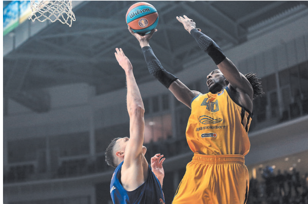
В Единой лиге «Химки» и ЦСКА успели сыграть лишь один раз — 96:80 в пользу подмосковного клуба.

Российская федерация баскетбола, возглавляемая Андреем Кириленко, несколько дней назад анонсировала заседание исполкома, на котором будут подведены итоги чемпионата в трех дивизионах. Решать будут о дивизионах не высшего уровня. В единую Премьер-лигу чемпион определен. Им стал УГМК (Екатеринбург). Относительно мужского чемпионата возникла юридическая дыра. Из нее надо выбирать.