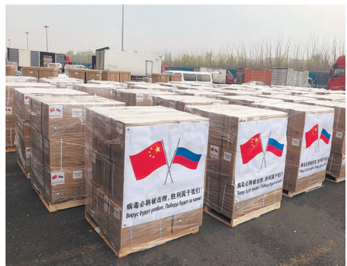
1 апреля Китай отправил в Россию 25,5 тонны противоэпидемических материалов: медицинские маски, защитные костюмы, одноразовые перчатки, бахилы, термометры.

Чиновник напомнил, что в настоящее время во многих странах и регионах мира наблюдается вспышка COVID-19. В связи с этим эффективным международное сотрудничество по совместному предотвращению и контролю за эпидемией стало главным приоритетом стран мира. Только дружное единение всего человечества способно преодолеть любые трудности, лишь совместными усилиями можно победить тяжкий недуг. ●