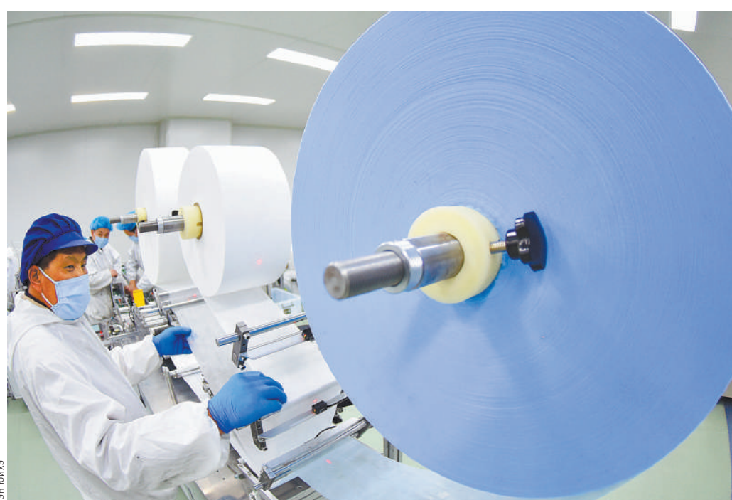
На заводе корпорации «Инью», расположенном в городе Ляньюньган (провинция Цзянсу), произвели очередную партию медицинских масок, предназначенную для экспорта.

Такие факторы, как производительность труда и развитость инфраструктуры, приобретают все большее значение в глобальной системе ценностей. КНР в этом отношении обладает определенными преимуществами. Можно сказать, что эпидемия в краткосрочной перспективе не поколеблет позиции КНР в глобальной цепочке производства и поставок. С другой стороны, ситуация по профилактике и контролю за эпидемией в КНР продолжает улучшаться, производственный и жизненный порядок страны быстро восстанавливается, а ключевые отрасли и ведущие предприятия с участием иностранного капитала возобновляют производство. Это демонстрирует не только устойчивость китайского производ-