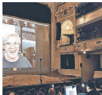
Открыла онлайн-проект БДТdigital Алина Фрейндлих — она представила радиоспектакль «Бабушка к доске»

По словам Могучего, карантин и самоизоляция заставили вспомнить забытый и практически уничтоженный вид театрального искусства — радиотеатр. Кроме того, возникнут и уже репетируются постановки,