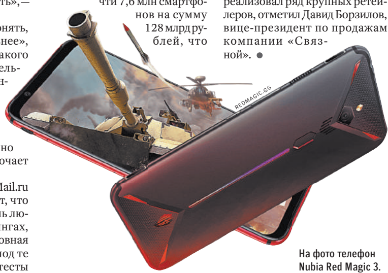
На фото телефон Nubia Red Magic 3.