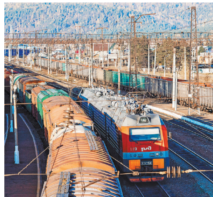
В апреле перевозка социально значимых грузов по железной дороге выросла в 1,5 раза.

Соглашения позволили диверсифицировать перевозку угля из Кемерово по всем направлениям (на запад и на юг), а не только на восток, где есть спрос, но железных дорог уже не хватает на все возрастающие аппетиты угольных компаний. При этом, несмотря на дефицит пропускных способностей, текущие обязательства РЖД уже выполнены: в марте только в восточном направлении было вывезено 4,8 млн тонн угля, в том числе 4,6 млн — на экспорт.