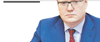
Андрей Исаев первый заместитель руководителя фракции «Единая Россия» в Государственной Думе