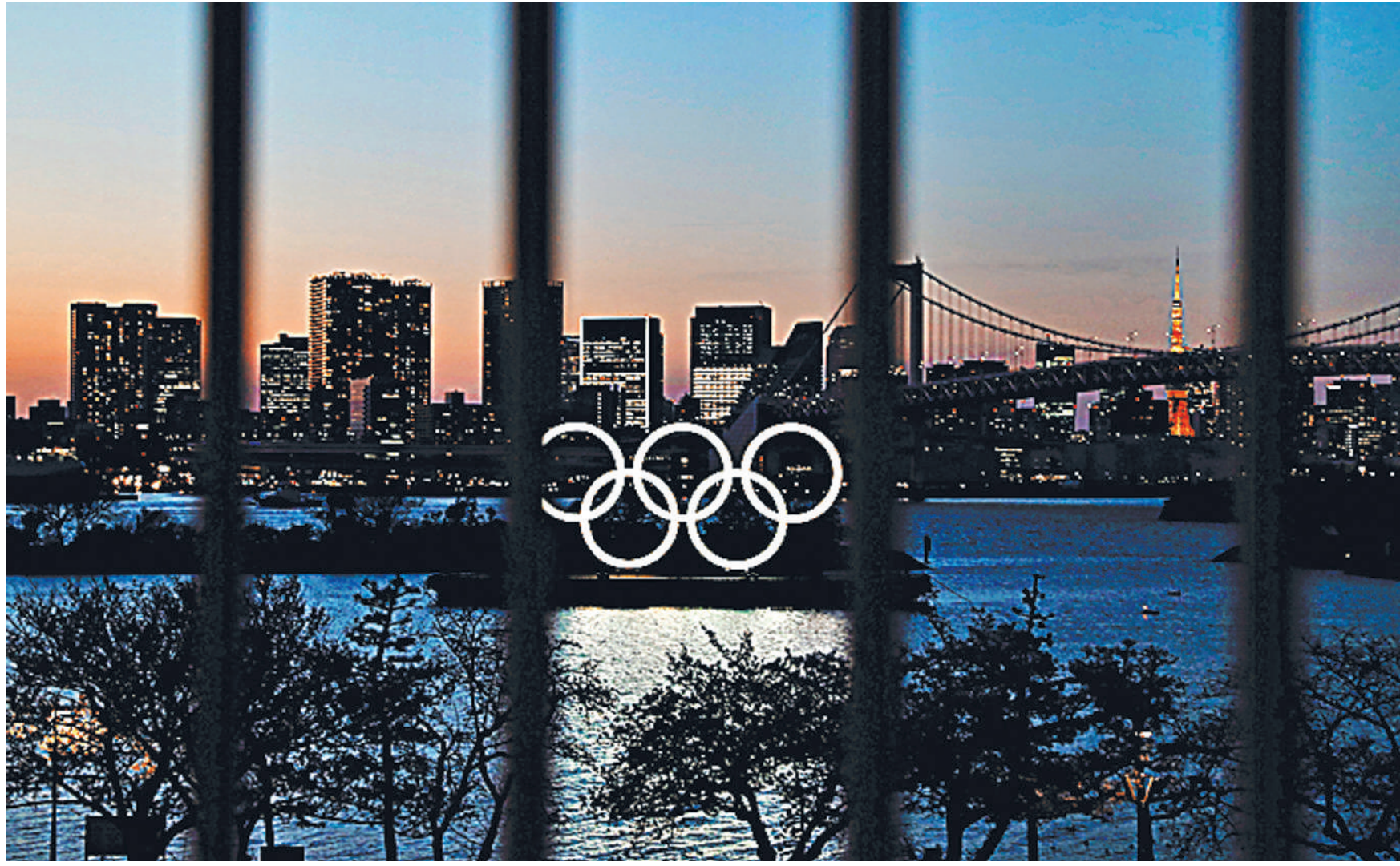
Летние Олимпийские игры-2020 были перенесены на следующий год из-за пандемии коронавируса.