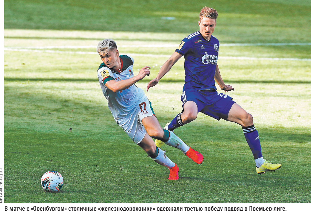
В матче с «Оренбургом» столичные «железнодорожники» одержали третью победу подряд в Премьер-лиге.

90 минут и имел несколько очень хороших моментов для гола, но отличиться россиянин так и не удалось. У мяча дубль оформил Рафинья, по мячу провели Джейсон Мурильо, Яго Аспас, Нолито и Санти Мина.