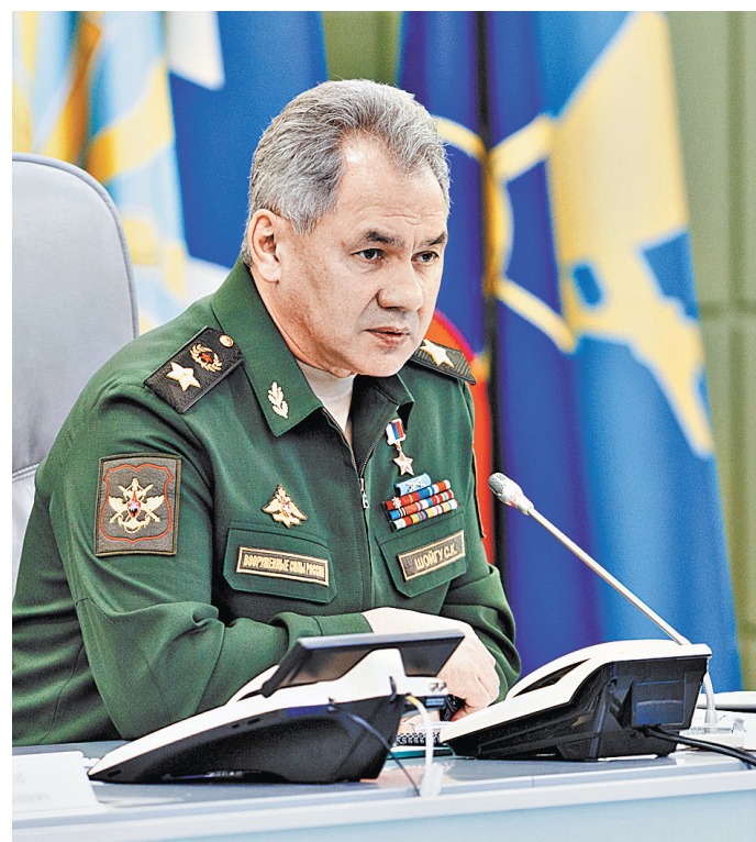
Приоритетом Сергей Шойгу назвал обустройство войск в Арктике и Крыму.