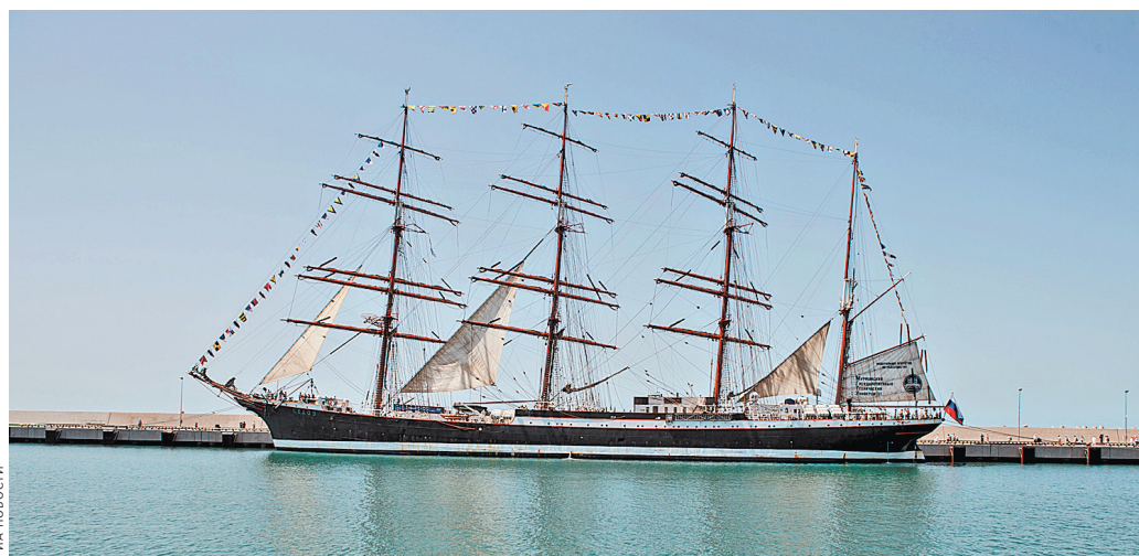
Демарш властей Польши и Эстонии не повлиял на выполнение рейсового задания легендарным парусником. Между тем в Таллине, где «Седова» всегда тепло принимали, искренне огорчены этим решением.

Кстати, данный рейс — юбилейный, курсанты вышли в море на паруснике «Седов» уже в сотый раз. Судно было построено в 1921 году и спущено на