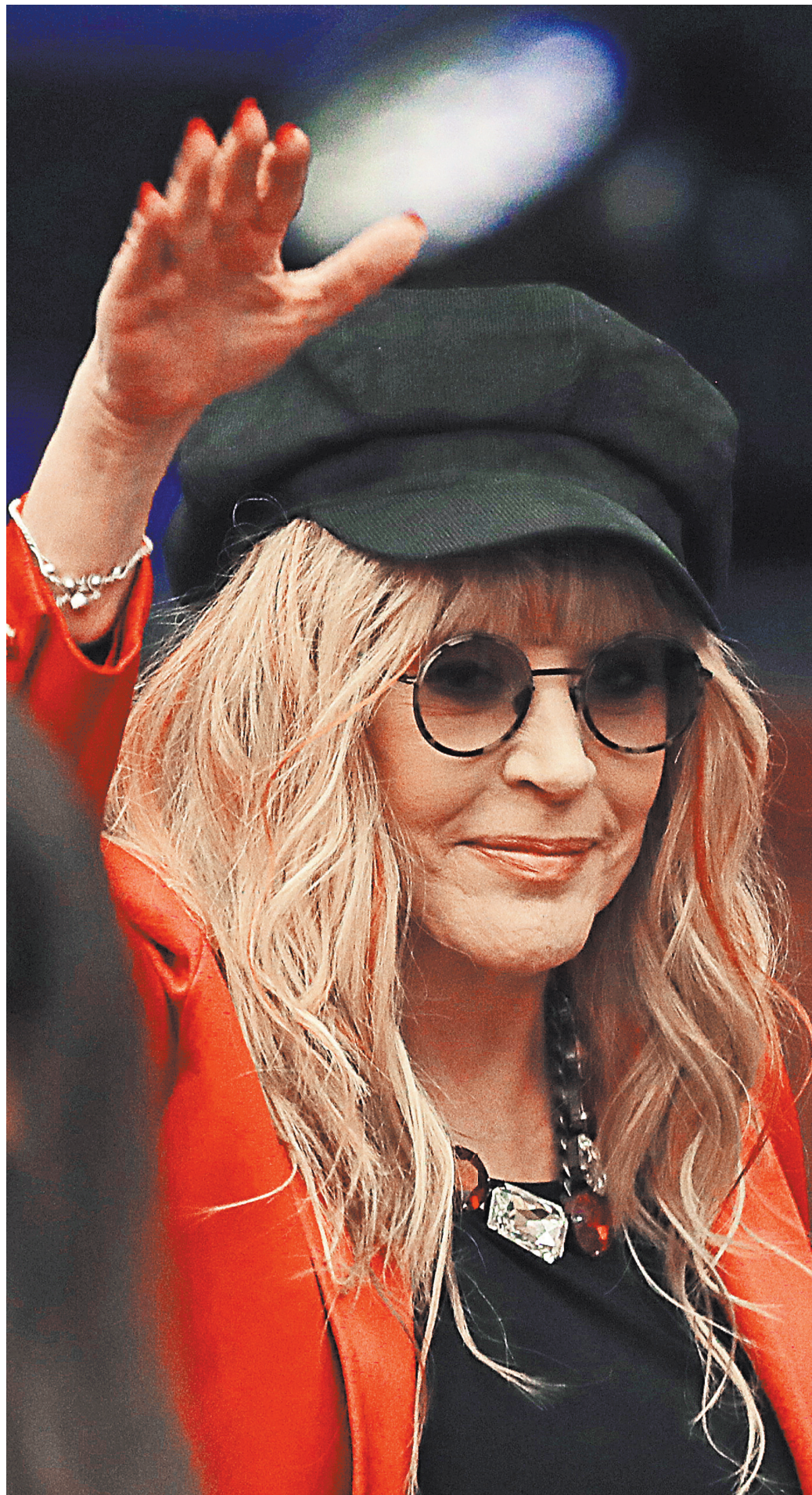
Перед юбилейным концертом Алла Пугачева снова репетировала новые песни. И похоже, прощаться со зрителями передумала?!