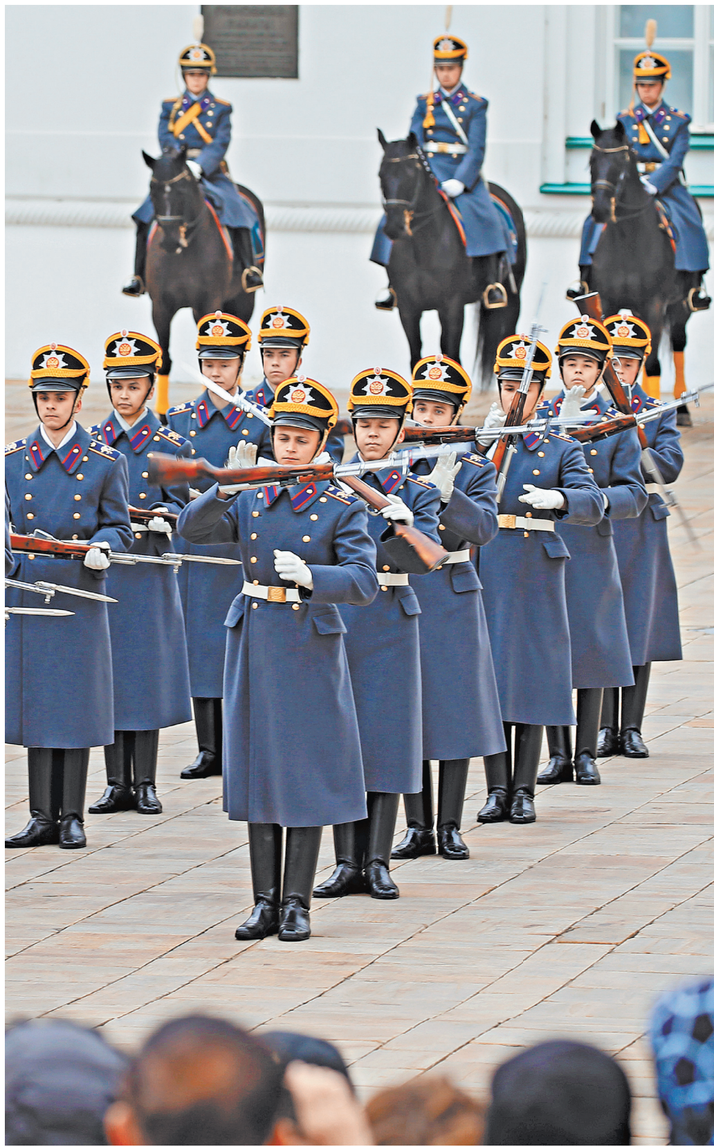
Эти ребята служат в полку с декабря 2018 года. Освоили «кремлевский шаг» и приемы с оружием за три месяца.

— Фоторепортаж смотрите на сайте rg.ru/sujet/1560