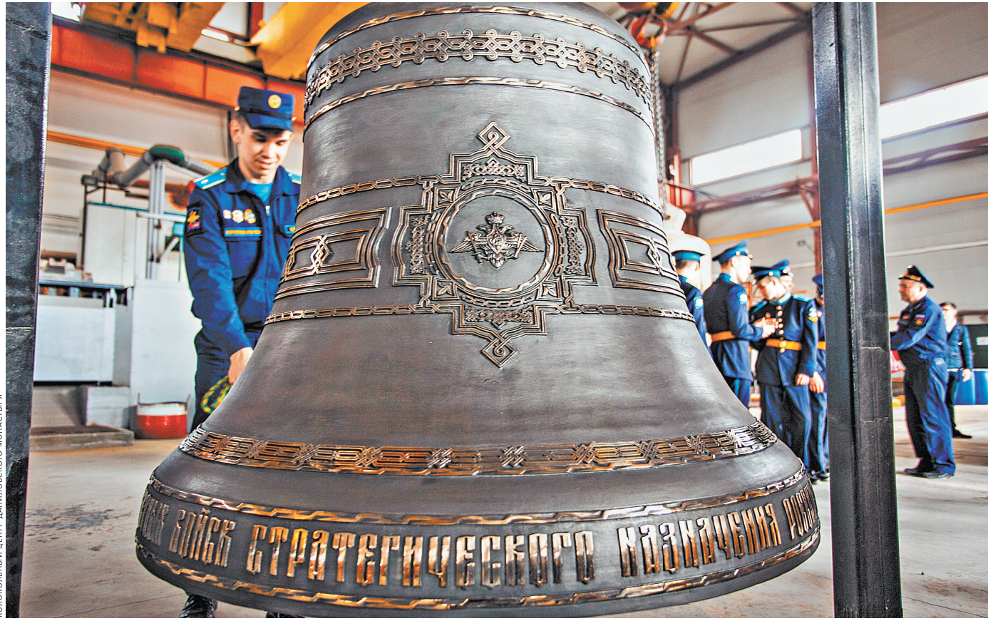
В Воронеже на колоколотейном заводе завершили отливку звонницы для храма Вооруженных сил РФ в парке «Патриот». 18 колоколов весом от 8 килограммов до 10 тонн изготовили за полтора месяца, последним отлили самый главный и тяжелый. На нем четыре иконы и сцены Великой Отечественной войны.

— О главном храме ВС РФ читайте на сайте rg.ru/art/1654886