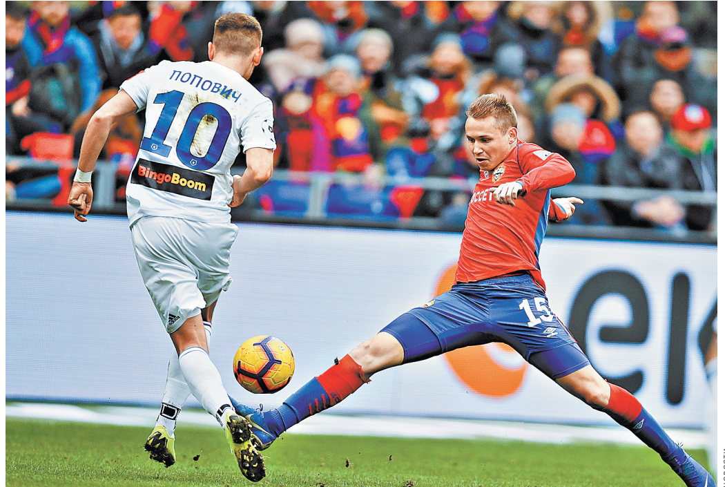
Игроки ЦСКА (справа) сенсационно пропустили дома три мяча от скромного «Оренбурга».

Общественные слушания по объекту государственной экологической экспертизы: проектная документация «Модернизация производства экстракционной фосфорной кислоты до 450 тыс. т. Р2О5 в год», включая материалы оценки воздействия на окружающую среду, состоятся: 17 мая 2019 г., в 15.00 в Администрации Волховского муниципального района по адресу: г. Волхов, Кировский пр., д. 32, каб. 215.