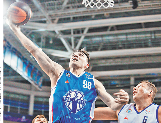
Суперфинал школьной лиги в Тольятти завершился традиционным матчем с участием легенд баскетбола.

Ну а завершили торжественный вечер уже традиционным матчем с участием почетных гостей и легенд отечественного баскетбола. В составах команд «профи» и «любителей» вышли президент Единой лиги Сергей Кущенко, наставник сборной России Сергей Базаревич, Сергей Панов, Василий Карасев, Алексей Саврасенко, Светлана Абросимова, Светлана Антипова, Ирина Сумникова и другие. А тренеровали команды олимпийские чемпионы Иван Едешко и Сергей Тараканов. Символично, что на майках у всех игроков была одна «фамилия» — «свой», что вполне соответствовало главному девизу суперфинала: «Мы одна команда». Впрочем, это не помешало матчу пройти в бескомпромиссной борьбе, что неудивительно, когда на паркете такие дуэли, как Карасев — Базаревич. В итоге «профи» оказались чуть сильнее — 65:63.