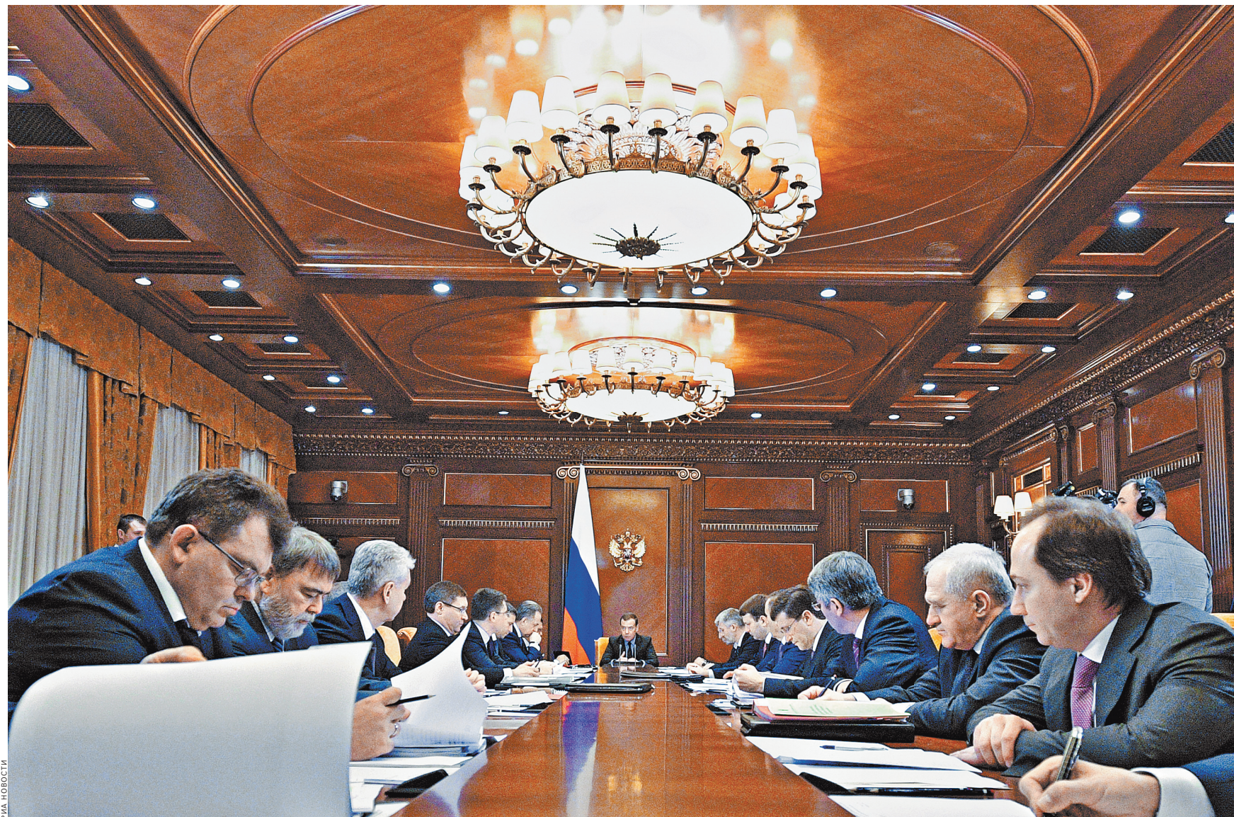
Дмитрий Медведев призвал строго контролировать цены на стройматериалы при реализации национальных проектов. Об этом премьер-министр говорил на специальном совещании «О ценообразовании на материалы и оборудование, используемые в строительном комплексе». По словам премьера, профильные министерства должны постоянно мониторить рынок и при возникновении рисков необоснованного роста цен принимать меры.

Мировой суд Таганского районного суда рассмотрел административный иск Роскомнадзора к Facebook и назначил американской компании штраф в 3 тысячи рублей. Она оштрафована за то, что ее отчет не содержал конкретной информации о локализации баз данных российских пользователей на территории РФ или о том, в какие сроки такая локализация баз данных произойдет.