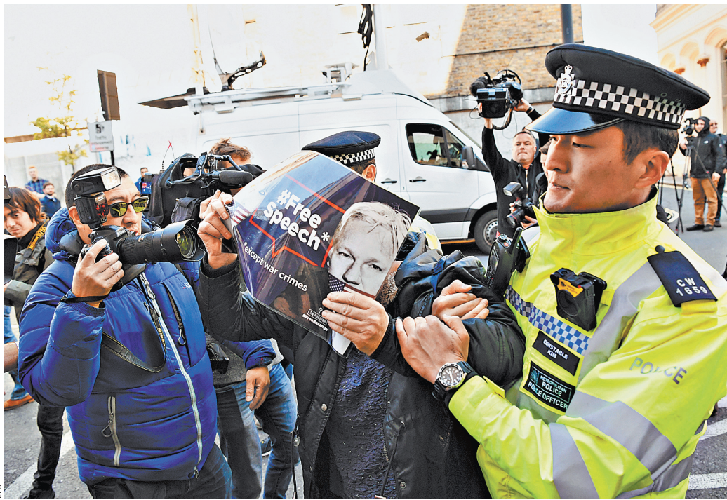
Полиция задерживает сторонников Ассанжа, пикетирующего здание Вестминстерского суда в Лондоне.

Каким бы порошком ни отбледали эквадорские политики состоявшегося выдачу Ассанжа британцам, отмыть себя им не удастся. После того как бывший президент этой латиноамериканской страны Рафаэль Корреа назвал позором действия официального Кито, разрешившего агентам Скотленд-Ярда войти в дипмиссию в Лондоне, чтобы записать Ассанжа, ему... заблокировали страницу в «Фейсбуке». Полтора миллиона подписчиков Корреа лишились возможности узнавать мнение бывшего главы государства только потому, что тот напомнил нынешнему президенту о коррупционном скандале, связанном с его ближайшими родственниками, который обнару-