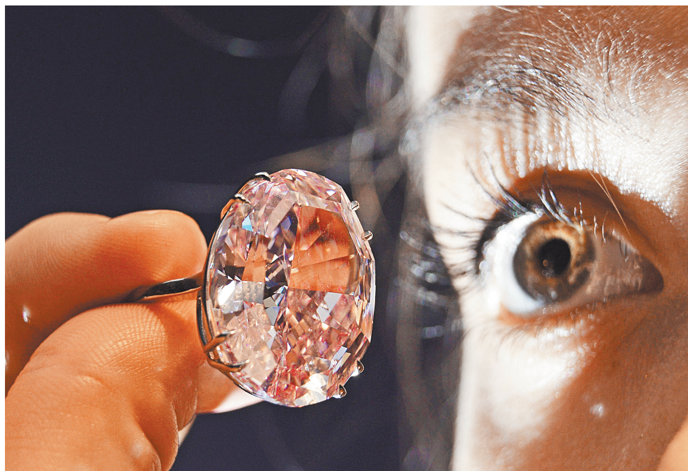
Определить из глаз, натуральный камень или синтетический, не может даже специалист.

1 Синтетика так же, как и натуральные камни, может быть желтая, голубая и совсем бесцветная. Различаются искусственные алмазы также по чистоте и качеству огранки, то есть на бирке указаны те же характеристики, как и для натуральных камней. Кстати, по ГОСТу называются бриллиантами только натуральные ограненный алмаз, рассказывает Столяревич.