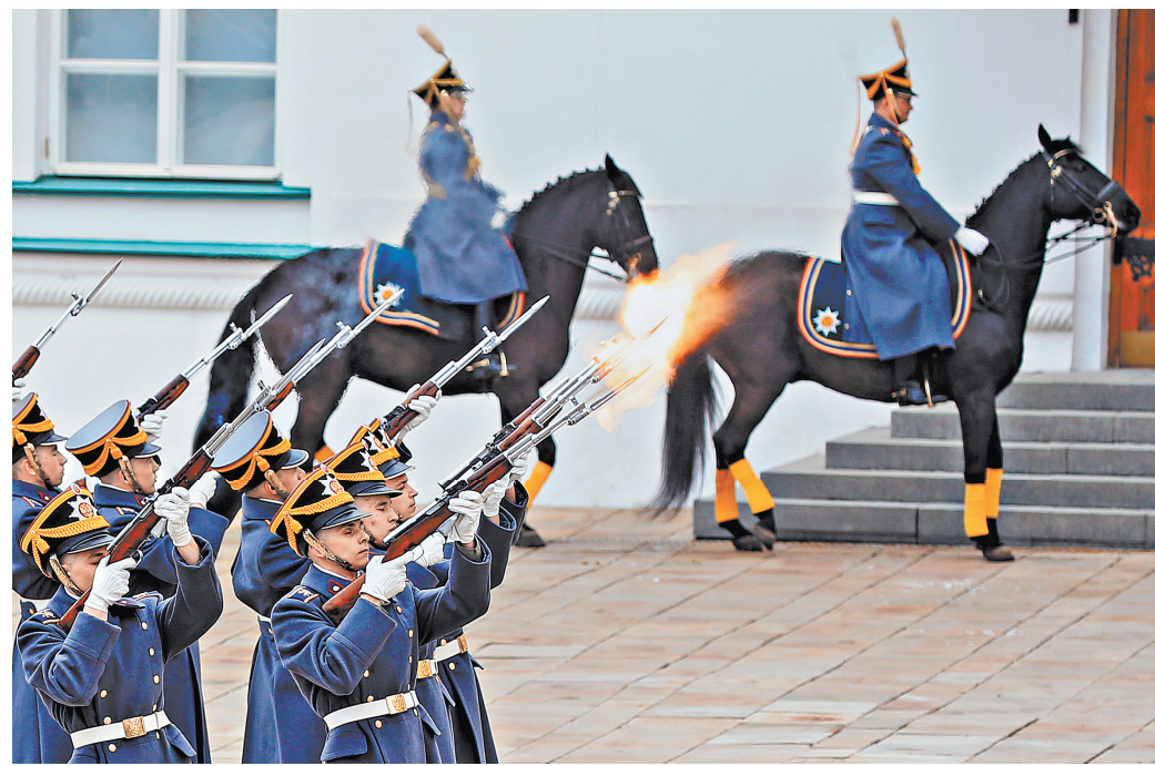
Кто-то думает, что карабины у солдат учебно-бутафорские? Сюрприз: оглушительный залп под визг зрительниц.

TRANСПОРТ Подорожал проезд по трассам М4, М3 и М11