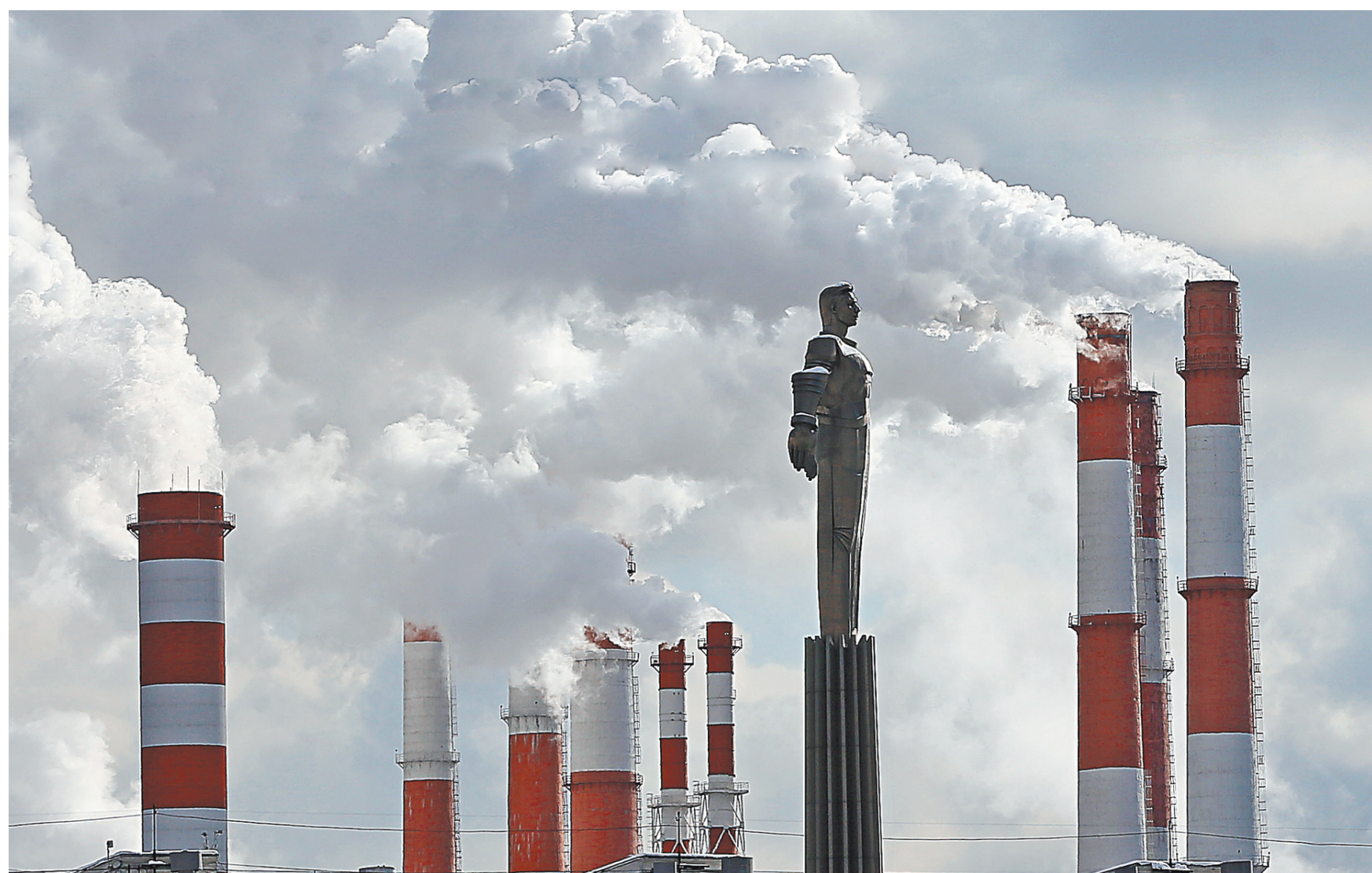
За негативное воздействие на природу в 2018 году внесено в казну 15 миллиардов рублей.