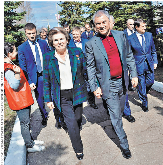
В Саратове Вячеслав Володин и первая женщина-космонавт, Герой Советского Союза, депутат Госдумы Валентина Терешкова zaloжили Аллею космонавтов у строящегося аэропорта Гагарина.

Спикер Госдумы также предложил краеведам и специалистам в сфере охраны подготовить свои предложения о внесении изменений в том числе в федеральное законодательство и заверил, что они будут внимательно рассмотрены. ●