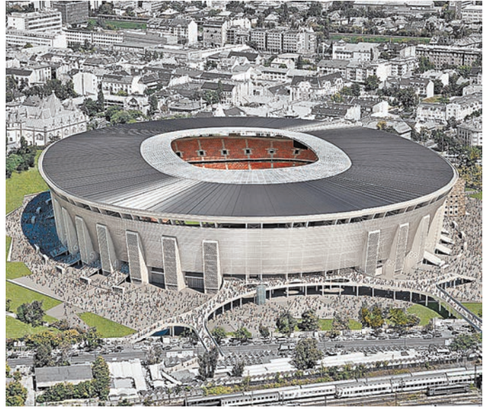
Новенькая арена в Будапеште откроется в ноябре этого года.

И только тогда мне, расстроенному, себя ввинчивая, добрые венгры поведовали: Пушкаш давно и тяжело болен. Болезнь Альцгеймера не щадит и великих. Он тяжело доживал свой век, уйдя с миром в 2006-м.