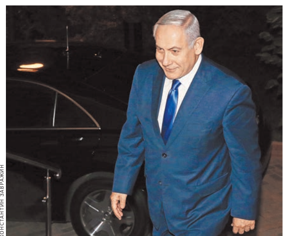
Биньямин Нетаньяху в ходе визита в Сочи. Никогда отношения Израиля и России не были такими крепкими, как сейчас.