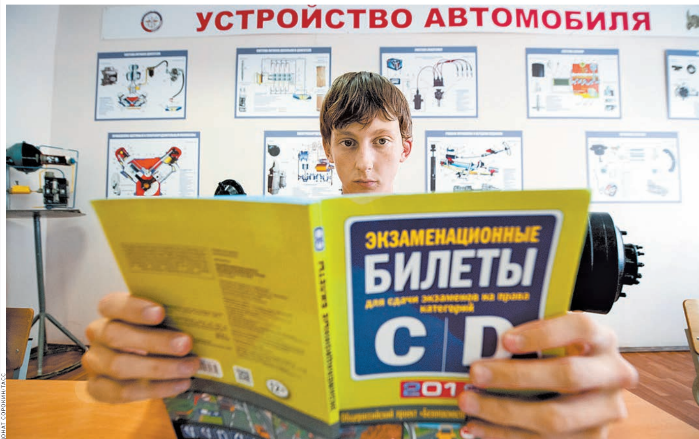
Планируется разработать самостоятельные билеты для каждой из категорий. При этом количество вопросов вырастет.

Материал подготовлен в рамках реализации федерального проекта «Безопасность дорожного движения» национального проекта «Безопасные и качественные автомобильные дороги».