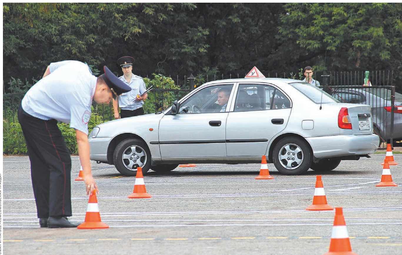
Прием экзамена в ГИБДД на площадках по категории «В» уйдет в прошлое. Проверять умения будут прямо на дорогах.