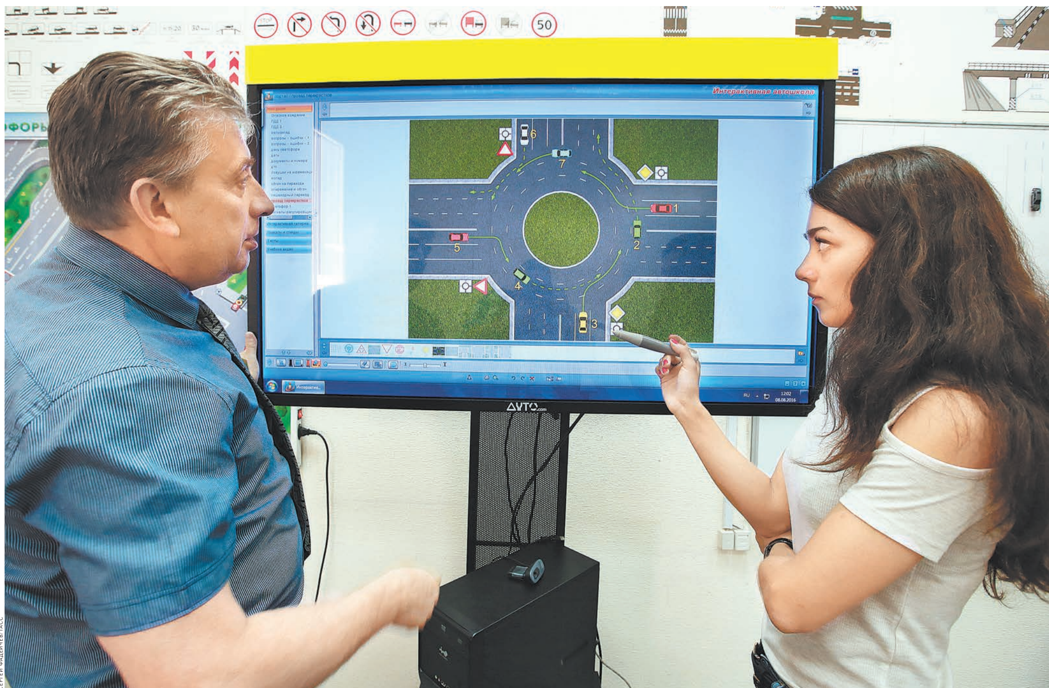
В экзаменационных билетах будут рассматриваться не отвлеченные теории, а максимально реалистичные ситуации.

Напомним, что одна из новаций — отмена экзамена по первоначальным навыкам управления, так называемой площадки. Но отмена экзамена — это, скорее, упрощение получения прав, тем более что с первого раза ее сдавали только 41 процент