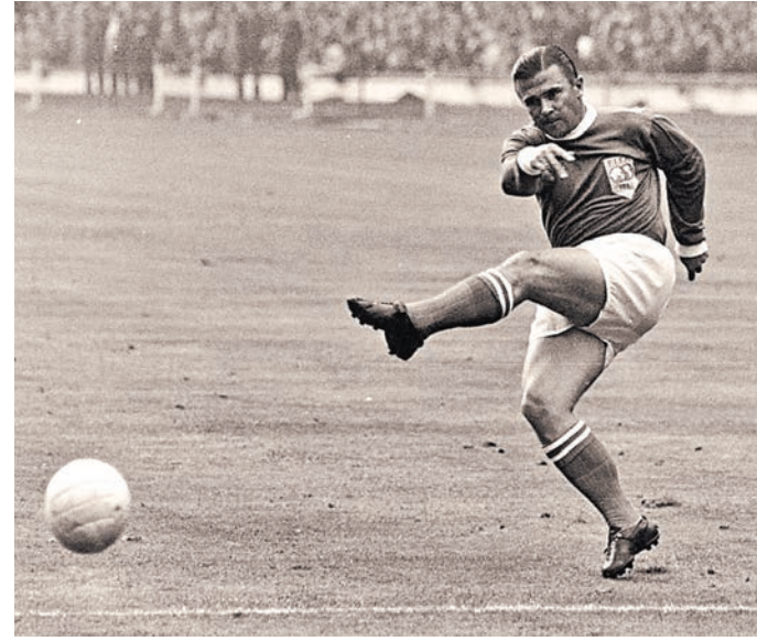
Для венгров до сих пор футболистом номер один является Ференц Пушкаш.