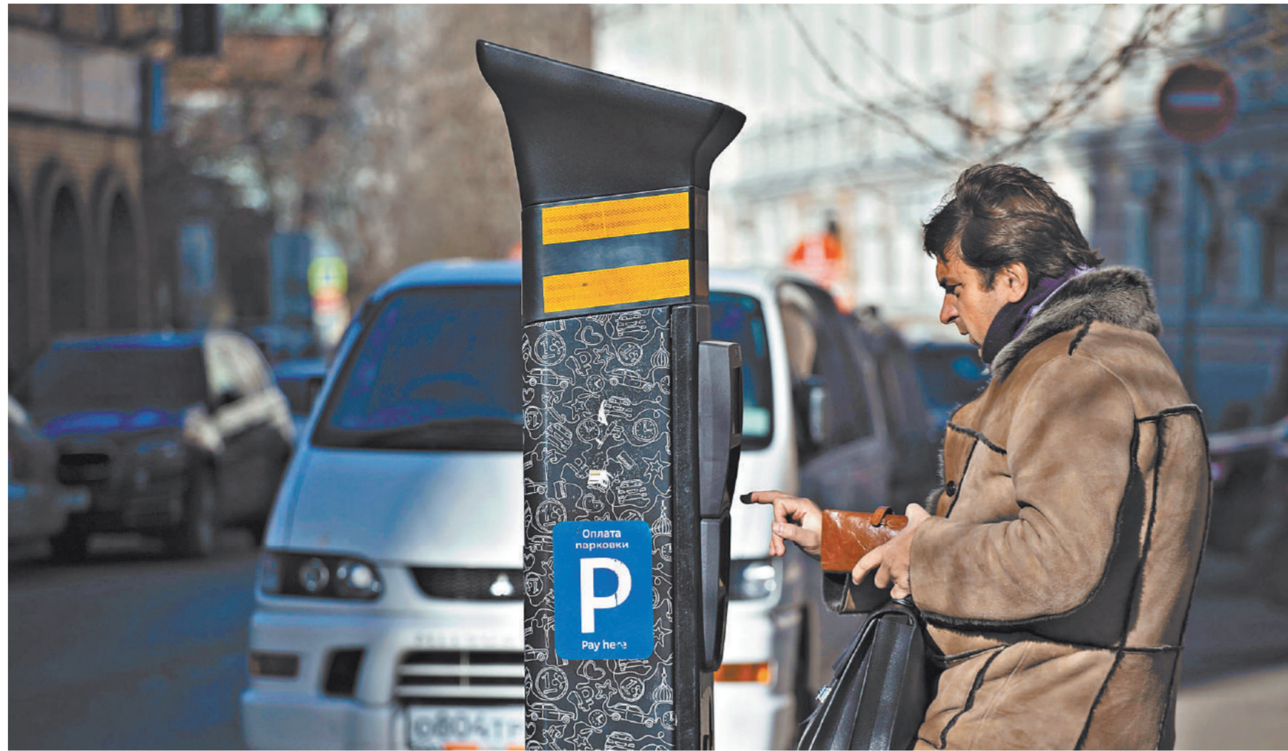
В районе метро «Новокосино» теперь есть все атрибуты платной парковки — от дорожных знаков до паркоматов.