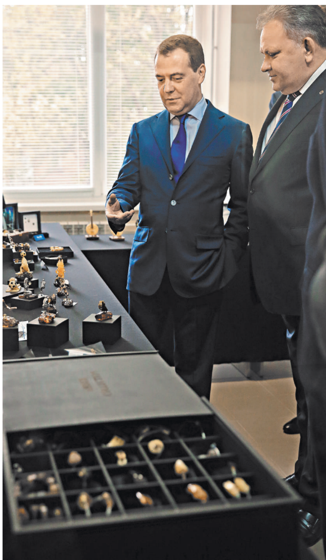
Глава правительства во время посещения Калининградского янтарного комбината.