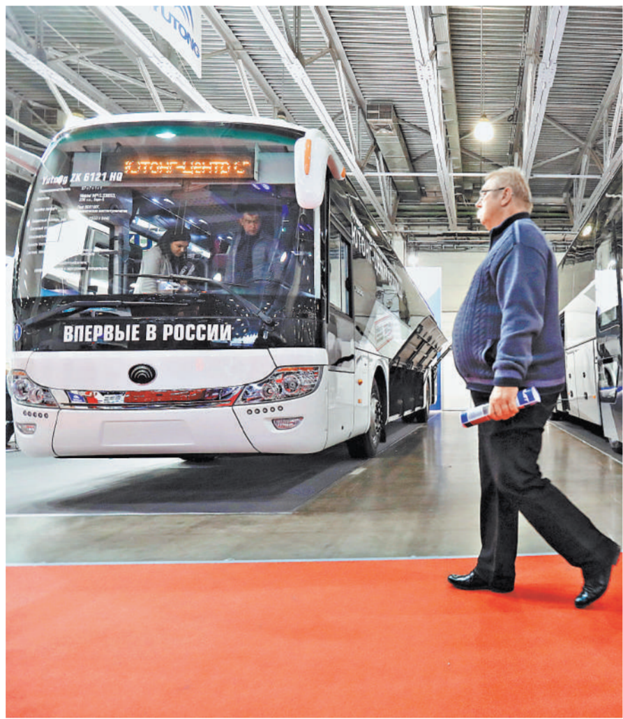
От автосалона до аварии: почему автобусы-красавцы превращаются в «смерть на колесах»?