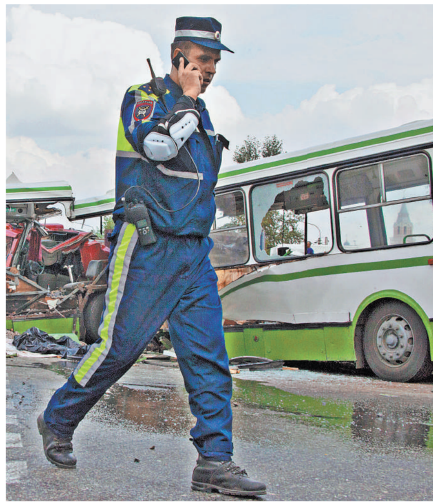
Михаил Понкин / ТАСС

Владимир Баршев После инспекция в Мос- кве, а также в других ре- гионах начала массовую проверку автобусов и пе- ревозчиков пассажиров. И в тот же день в столице открылся Международный автобусный салон. Совпадение - знаковое. Оно заставляет ответить на во- прос, почему же автобусы-красавцы на наших дорогах превращаются в «смерть на колесах».