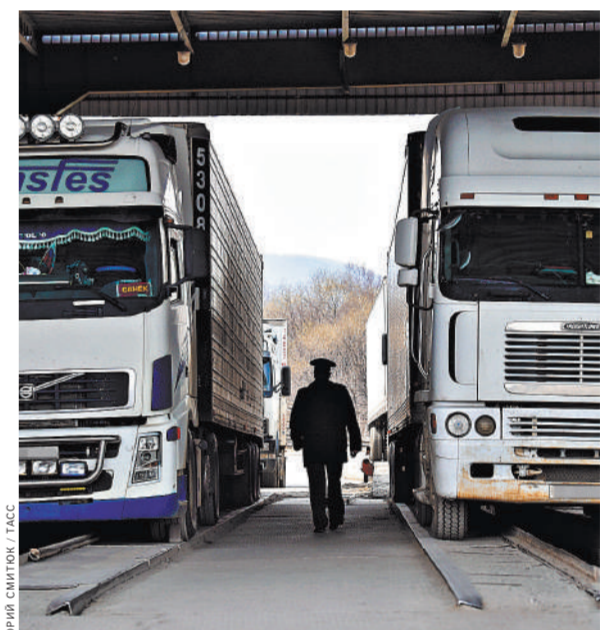
Несмотря на все санкции, поток товаров между Украиной и Россией все еще значителен в обе стороны, а с 2017 года он начал восстанавливаться и достиг почти 13 миллиардов долларов.