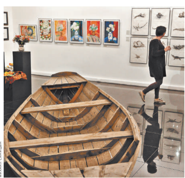
Не сразу поверишь, что все эти работы — дело рук начинающих живописцев.