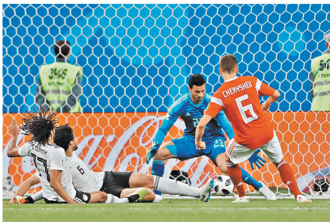
Наша команда провела матч в остро атакующем стиле.