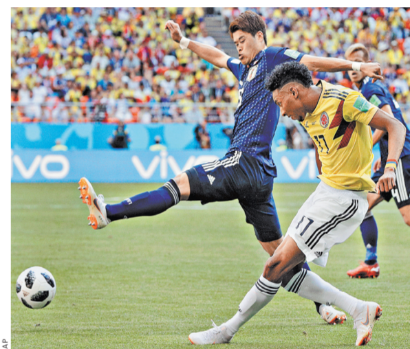
Удаление на первых минутах помало колумбийцам все планы на игру со сборной Японии.

Второй тайм японцы вновь начали активно. Правда, опасные удары Юя Осако и Такаси Инуи блокировал голкипер Давид Осина. Дабы усилить атакующую линию, Хосе Пекерман решил выпустить на 60-й минуте Хамеса Родригеса, но он был не столь заметен и запомнился лишь тем, что заработал желтую карточку за грубую игру. А вот японцы продолжали создавать моменты и в итоге добились своего—на 74-й минуте после улового с податкой известного болельщикам ЦСКА Кэйсука Хонды активный Осако вывел команду вперед—2:1!