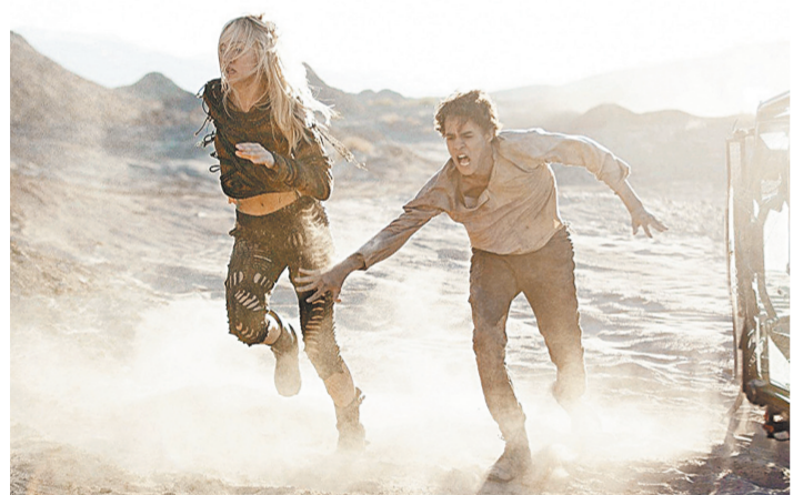
И встретит он девушку, которая окажется уцелевшим роботом-андрондом с мотком проводов вместо нервов...

Все о новинках кино читайте на сайте в спецпроекте «РГ» kino.rg.ru