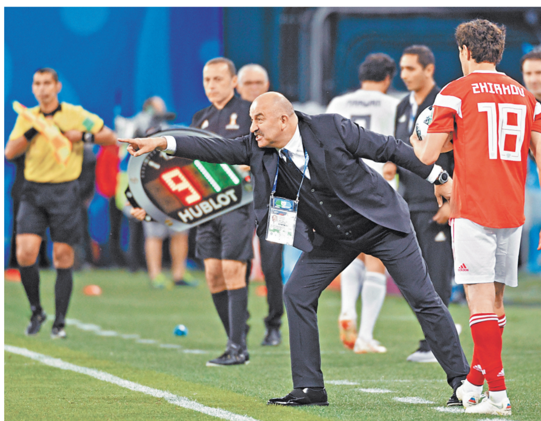
Главный тренер сборной России Станислав Черчесов пока предугадывает все ходы соперников.

О настроении нашей сборной лучше всех слов говорил тот азарт, с которым игроки — а вместе с ними и заполненный до отказа стадион — несли гимн. И стартовый