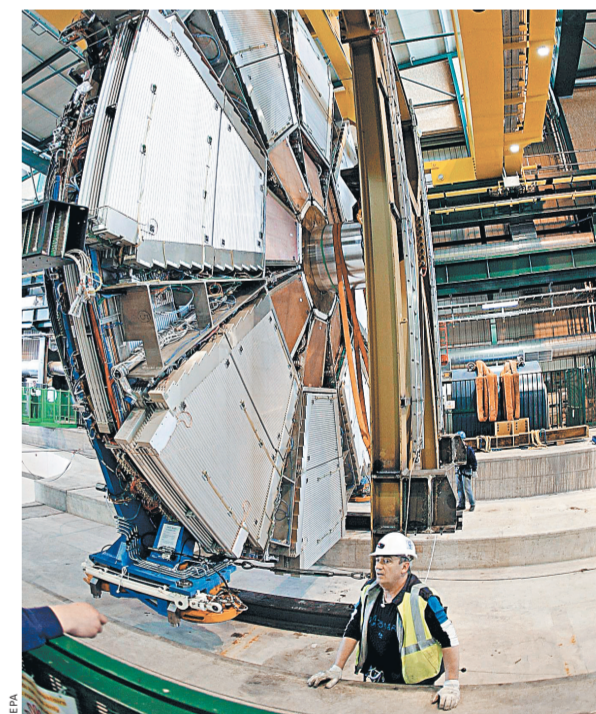
Создание знаменитого Большого адронного коллайдера обошлось почти в 9 миллиардов евро.

А усовершенствования предстоят серьезные. Около 1,2 из 27 километров кольца ускорителя будут полностью переоборудованы, значительно расширены тоннели коллайдера. Здесь будет установлена новая аппаратура, которая позволит ученым фиксировать пучки частиц на месте и повышать их концентрацию. Среди прочего на БАК будут размещены инженерные части, созданные в России, а также новые сверхпроводящие магниты. Модернизация профинансирована всеми участниками проекта, наша страна выделила 330 миллионов рублей.