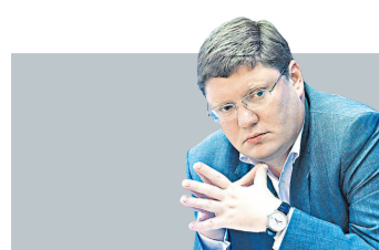
Андрей Исаев первый заместитель руководителя фракции «Единая Россия» в Государственной Думе