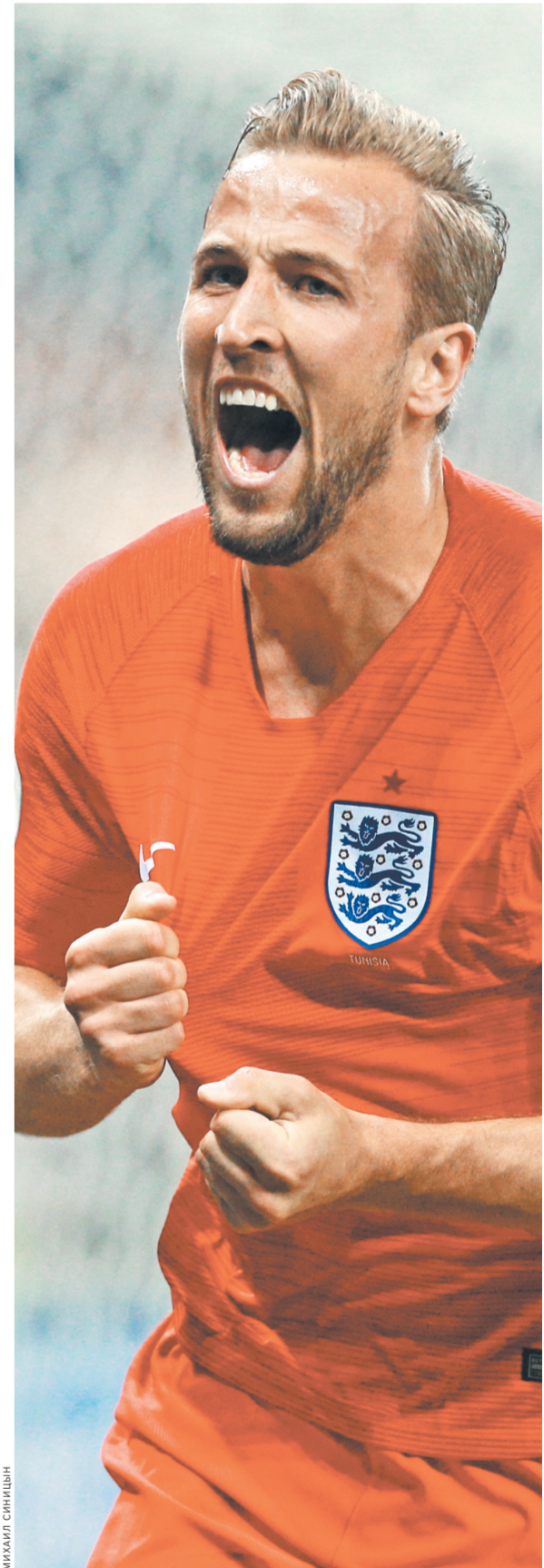
Нападающий Гарри Кейн стал палочкой-выручалочкой для своей сборной. Если бы не его второй гол, англичане потеряли бы два очка.

Кстати, мало кто знает, но карьера Кейна могла сложиться совершенно иначе. Путь Гарри в футбол начался с отчисления из академии лондонского «Арсенала», которому 11-летний паренек почему-то показался несколько физически недоразвитым. При нынешних 188 сантиметрах роста этот факт из биографии Кейна кажется забавным. А еще капитан англичан не собирается ограничивать себя в спорте своим теперешним ремеслом и когда-нибудь всерьез мечтает попробовать силы в американском футболе. Впрочем, если Кейн продолжит исправно забивать, его переход в другой вид спорта состоится не скоро.