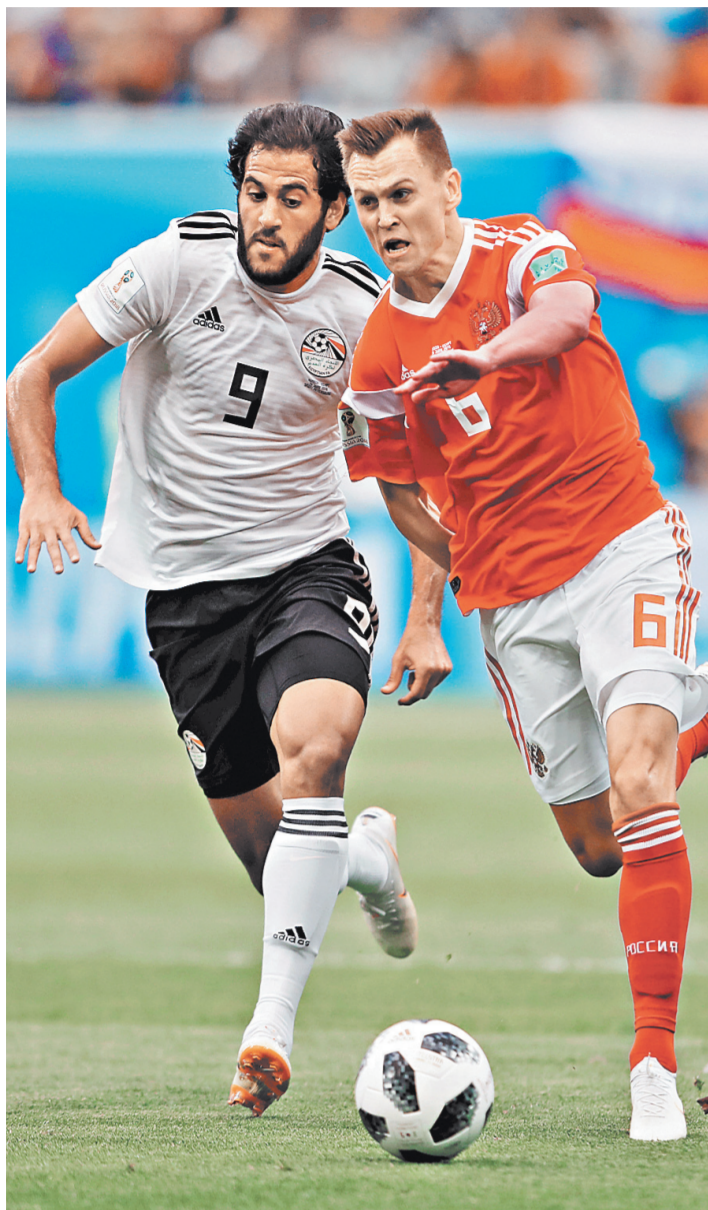
У Дениса Черышева на этом ЧМ уже три забитых мяча!