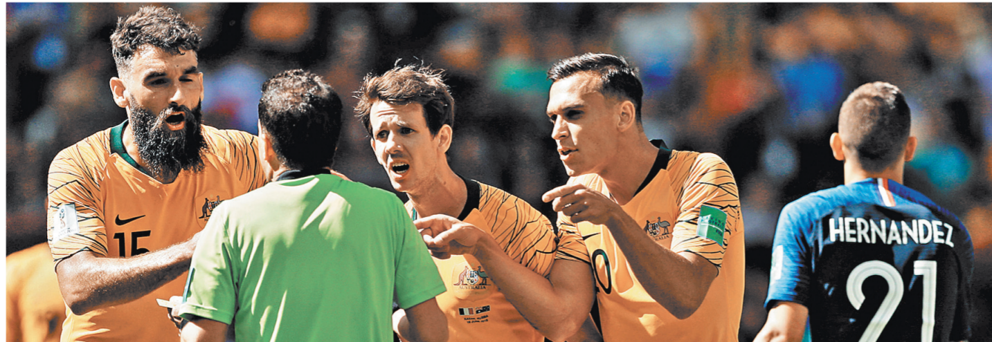
На чемпионате мира судьям приходится работать в экстремальной обстановке. Игроки много спорят, ведь цена каждого матча необычайно велика.