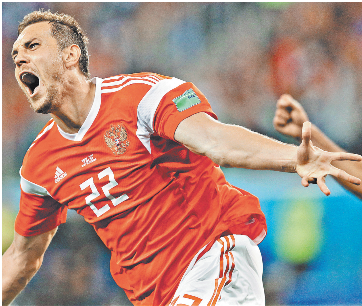
Артем Дзюба ликует — еще один мяч прилетел в ворота египтян!

1 → Разумеется, о Салахе говорили и болельщики, которые в день матча вышли на петербургские улицы. Египтяне, в огромном количестве наводнившие Невский и окрестности, поголовно были уверены, что с возвращением Салаха в строй их сборная уложит теперь на лопатки всех конкурентов, включая хозяев чемпионата мира. Наши фанаты смотрели на вещи более трезво. Отмечали, что лидер египтян три недели не играл в футбол и предсказать его истинные возможности сейчас очень трудно. А значит, с соперником можно и нужно бороться.