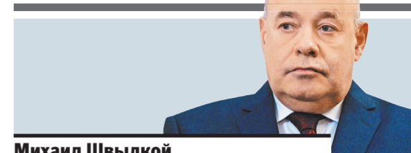
Михаил Швыдкой, доктор искусствоведения