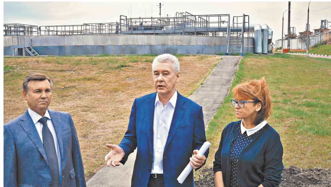
По словам мэра Москвы, модернизация Люберецких очистных сооружений сократила выбросы на 95%.

На призыв мэра включиться в его избирательную кампанию откликнулись более 4 тысячи горожан. Кто они? КОНСТАНТИН РЕМЧУКОВ: Больше всего молодых людей. Они более подвижны, мобильны, им это интересно, для них это, говоря их языком, драйв. К тому же они одни из ключевых бенефициаров того, как Собянин делает город для людей. Он построил для них 240 км беговых дорожек, 773 км велодорожек, спортплощадки, зоны в центре города, где они прыгают на роликах и кувкаряются. Атмосфера города для молодежи им нравится, и они хотят, чтобы она сохранялась и развивалась и дальше.