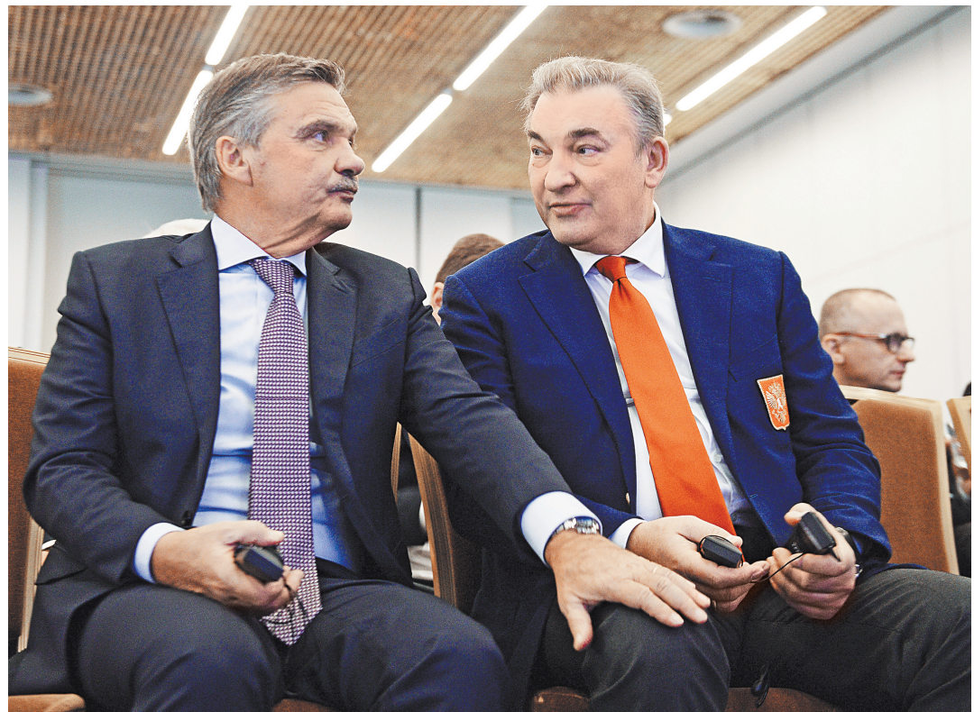
Рене Фазель (слева) никогда не скрывал симпатий к России и к ее хоккейным руководителям.