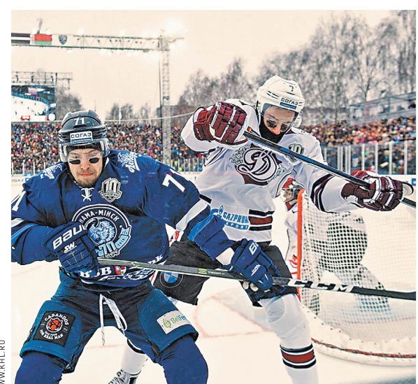
Хоккеисты динамовских команд Риги и Минска в необычном для КХЛ матче забросили на двоих пять шайб.