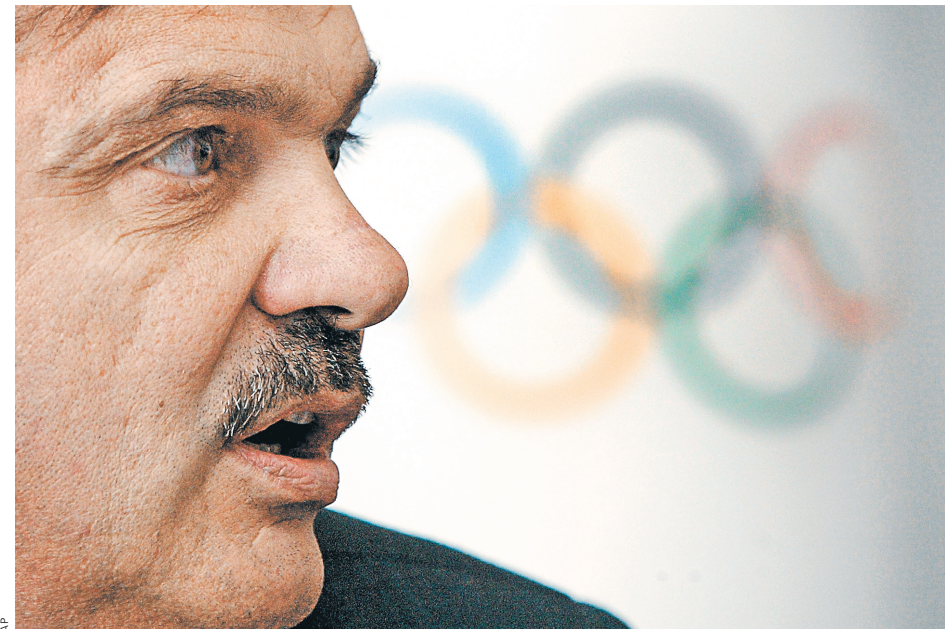
В том, что российские хоккеисты поедут на Олимпиаду, немалая заслуга Рене Фазеля.

РЕНЕ ФАЗЕЛЬ: Мужская хоккейная сборная вообще никак не была упомянута Родченковым. Что же касается женской команды, то Федерация хоккея России отреагировала правильно, заменив тренерский штаб и персонал. Игроки, признанные виновными, дисквалифицированы. Справедливо ли, не нам рассуждать. Все обвинение основывается на показаниях одного-единственного человека. Но невозможно и отрицать следы манипуляций с допинг-пробами. Я с самого начала говорил, что нам надо найти и наказать виновных — тренеров, атлетов, персонал, всех, кто того заслуживает. Но при этом мы должны защищать тех спортсменов, кто невиновен и не был вовлечен ни в какие схемы.