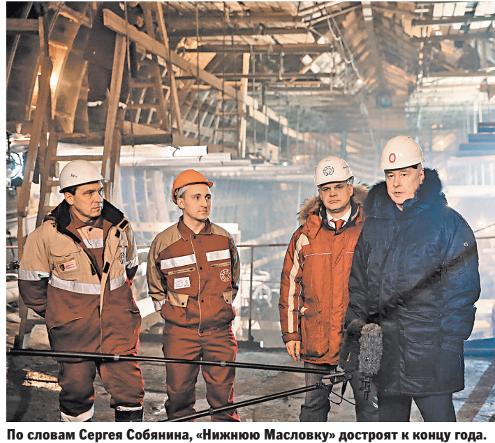
По словам Сергея Собянина, «Нижнюю Масловку» достроят к концу года.