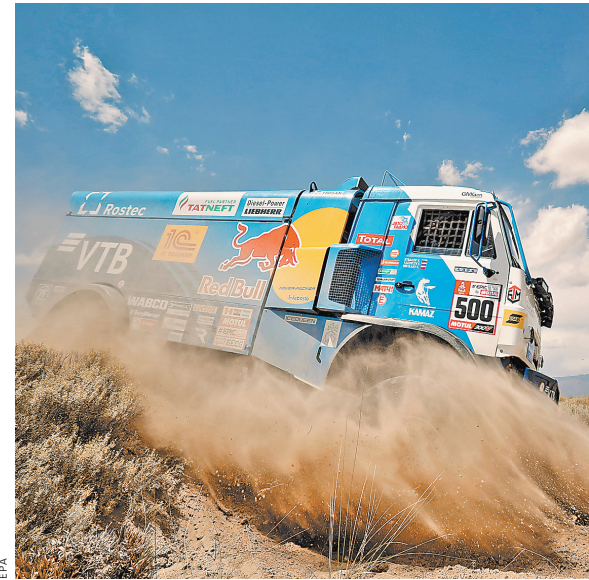
«Дакар-2018» стал одним из сложнейших в истории ралли-рейда, но «КАМАЗ» снова справился.

В зачете мотоциклов впервые в своей карьере первенствовал австриец Маттиас Валькнер («Хонда»), а в классе внедорожников триумф праздновал испанец Карлос Сайнс-старший, выигравший «Дакар» второй раз спустя восемь лет после предыдущего успеха.